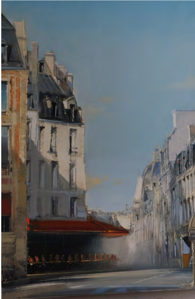
Paris en août - 73 x 50 cm