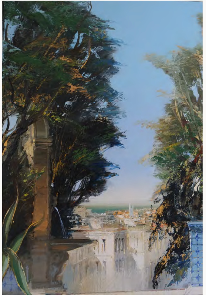
Lusitania - 73 x 50 cm