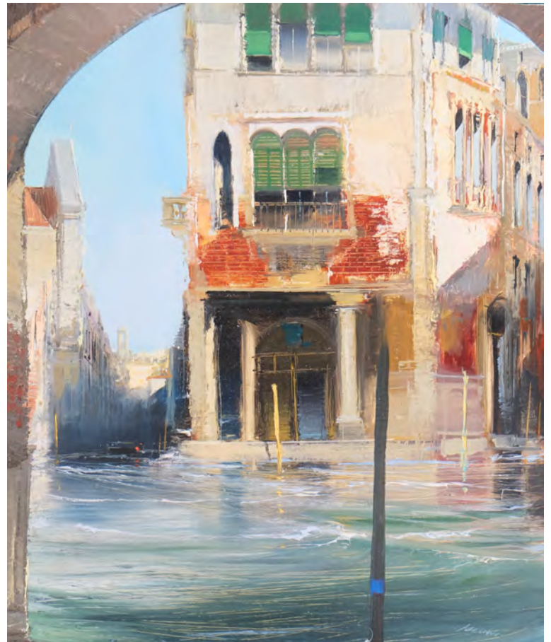
La fenêtre de Baldassare Galuppi - 73 x 60 cm