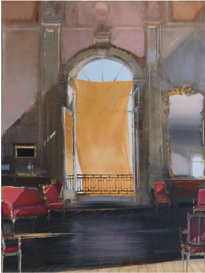
La clameur de Naples - 81 x 60 cm