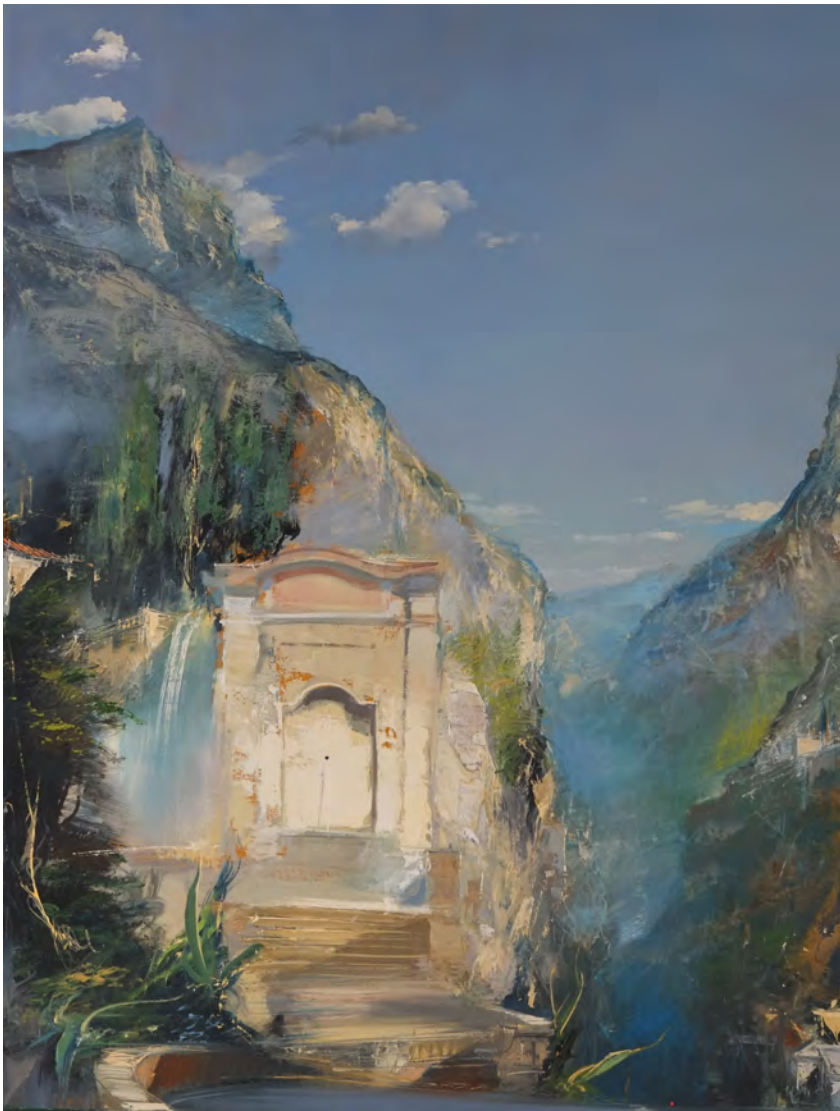
La fontaine sacrée - 116 x 89 cm