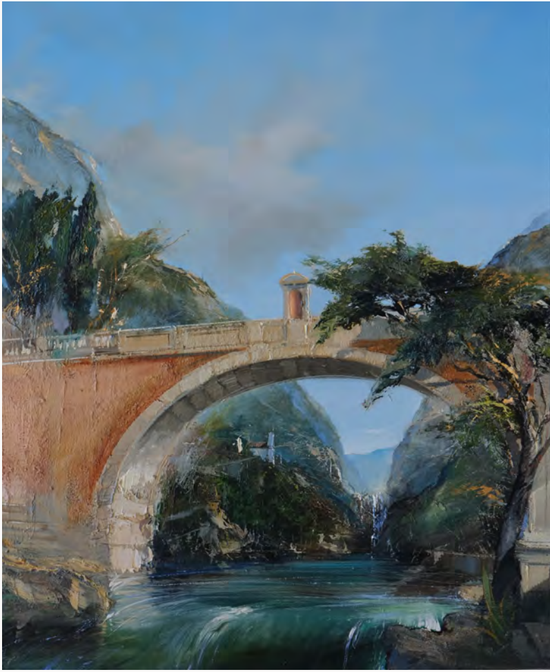
Vert Adige - 100 x 81 cm