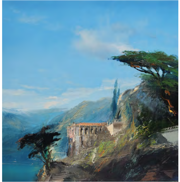
Jolis nuages - 60 x 60 cm