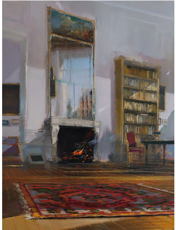
L'appartement de la place des Vosges - 73 x 54 cm