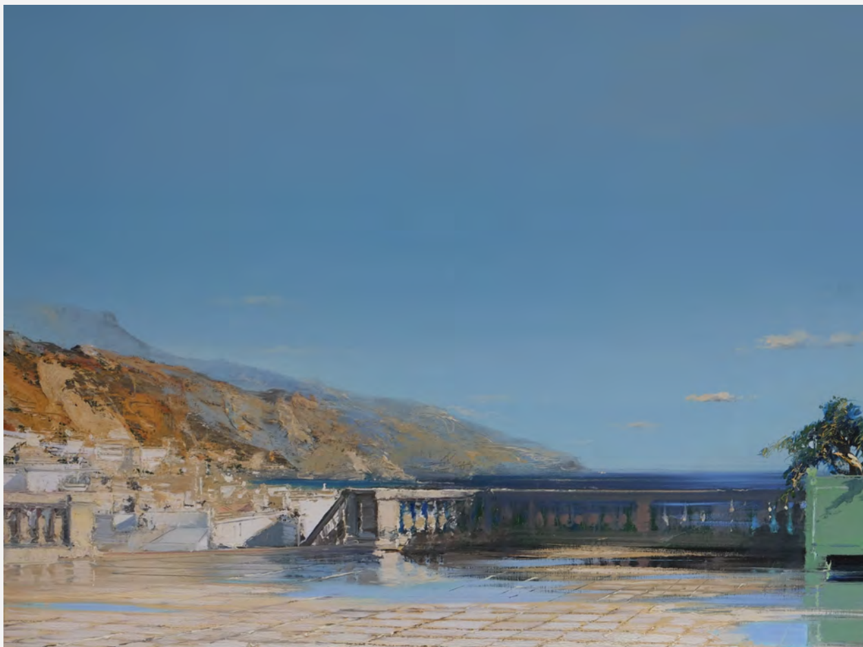
Eole - 60 x 81 cm