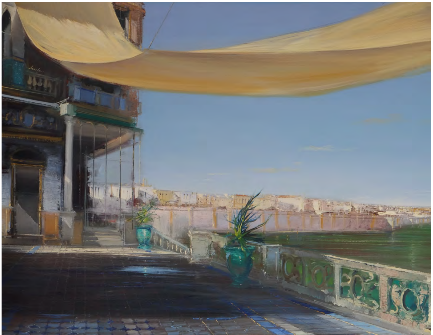
La sevillana - 89 x 116 cm