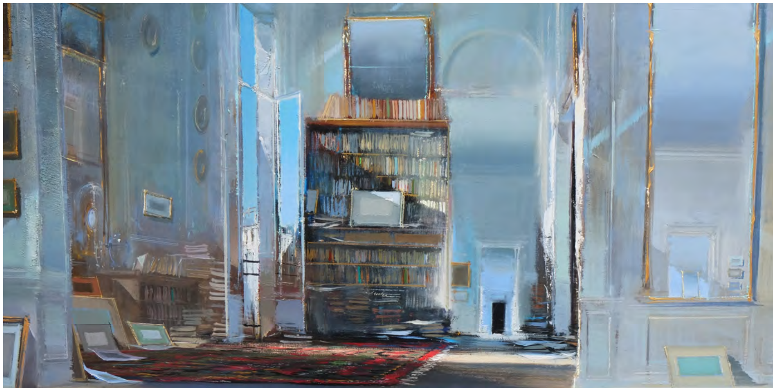
Allegretto - 60 x 120 cm