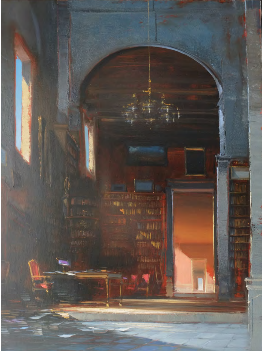
Les lettres de l'Arioste - 130 x 97 cm