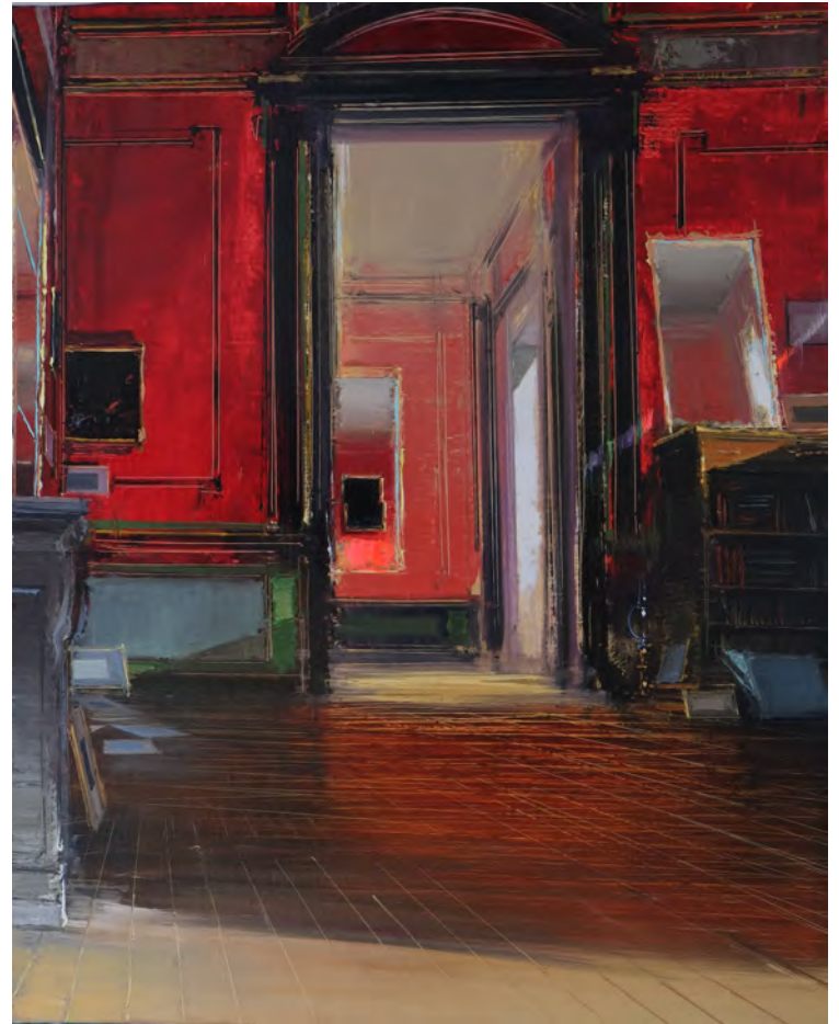
A la recherche d'une gravure du Piranèse - 81 x 65 cm