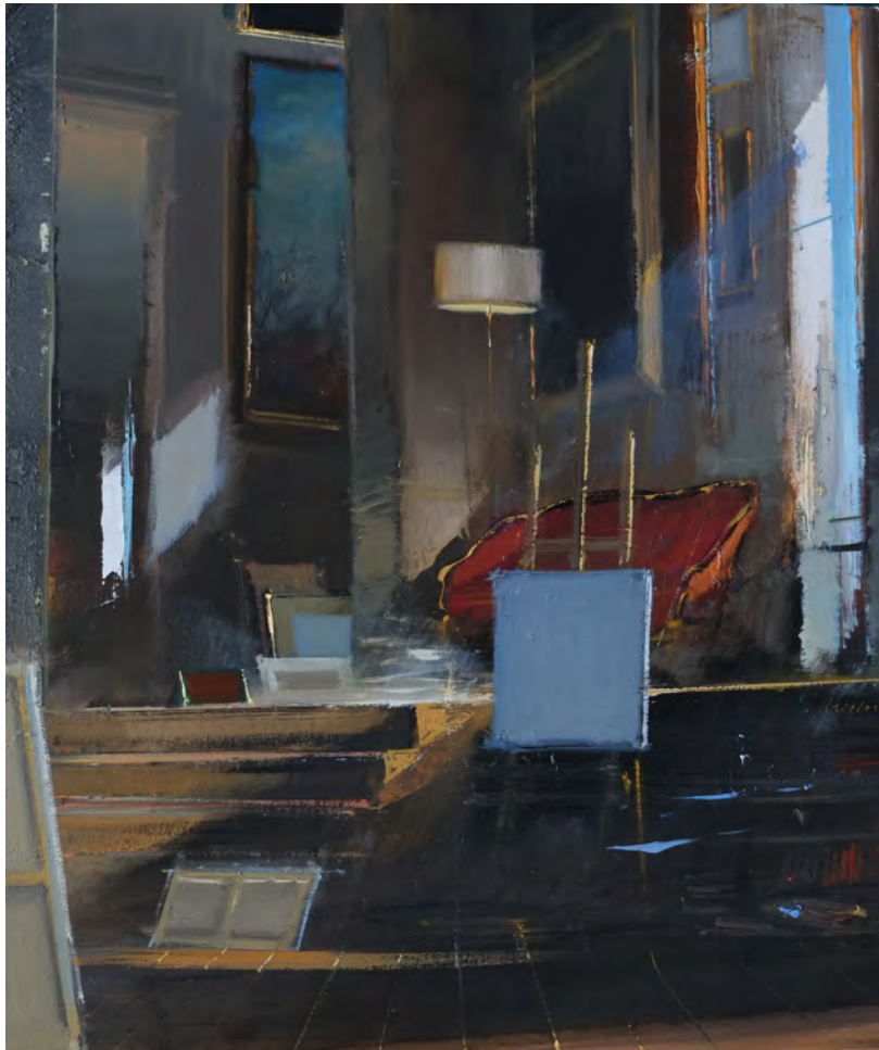
L'atelier de la Nouvelle Athènes - 65 x 50 cm