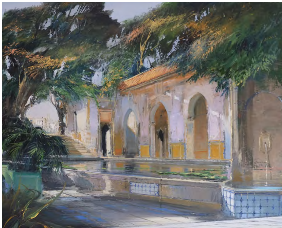
Effet d'Andalousie - 81 x 100 cm