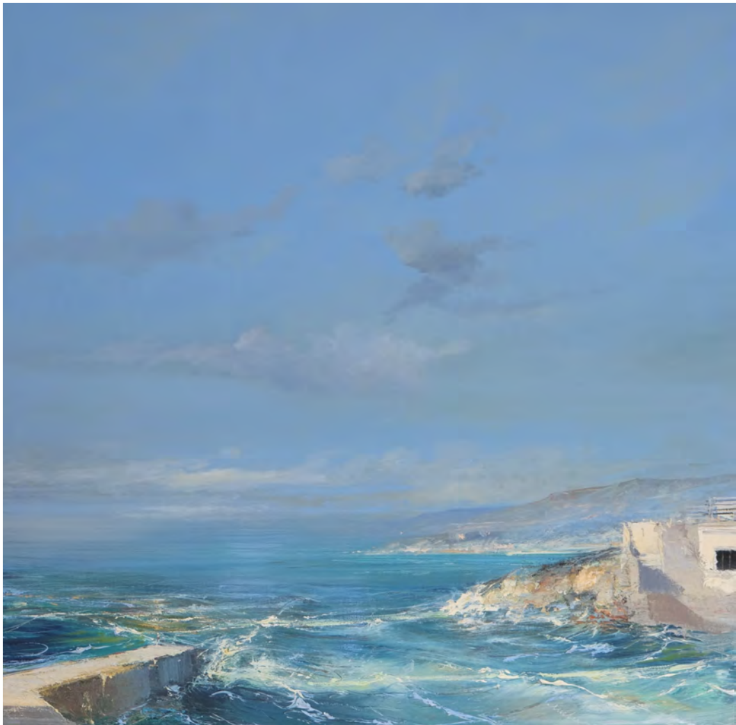
Effet marseillais - 100 x 100 cm