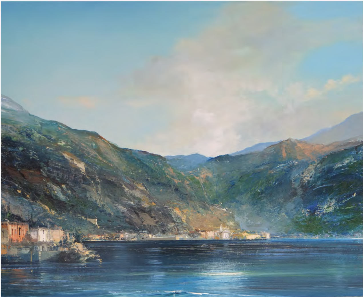
Rive piémontaise - 81 x 100 cm