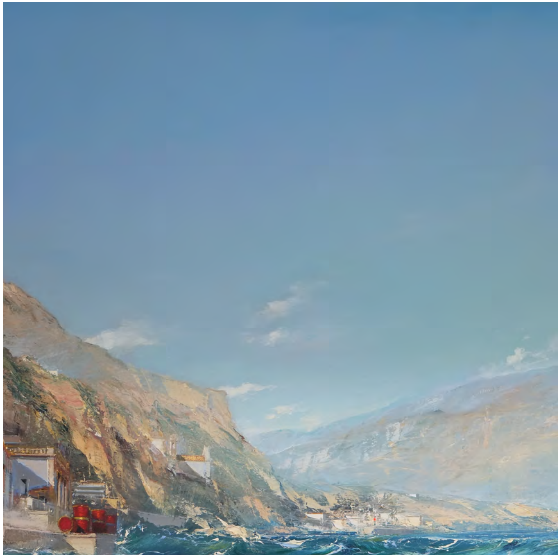
Grèce - 100 x 100 cm