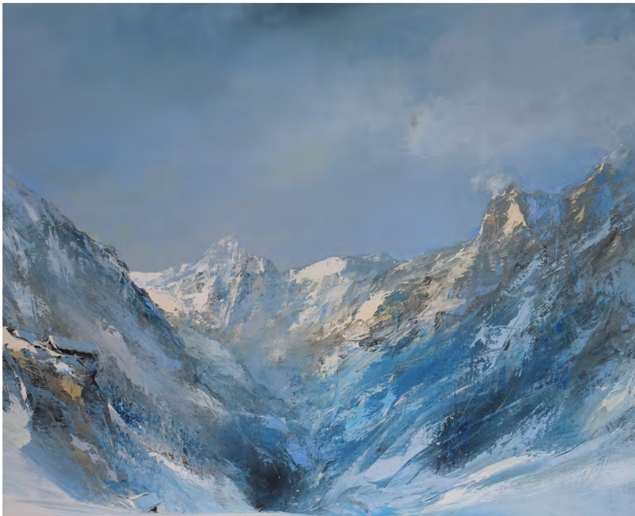
Appenzell - 81 x 100 cm