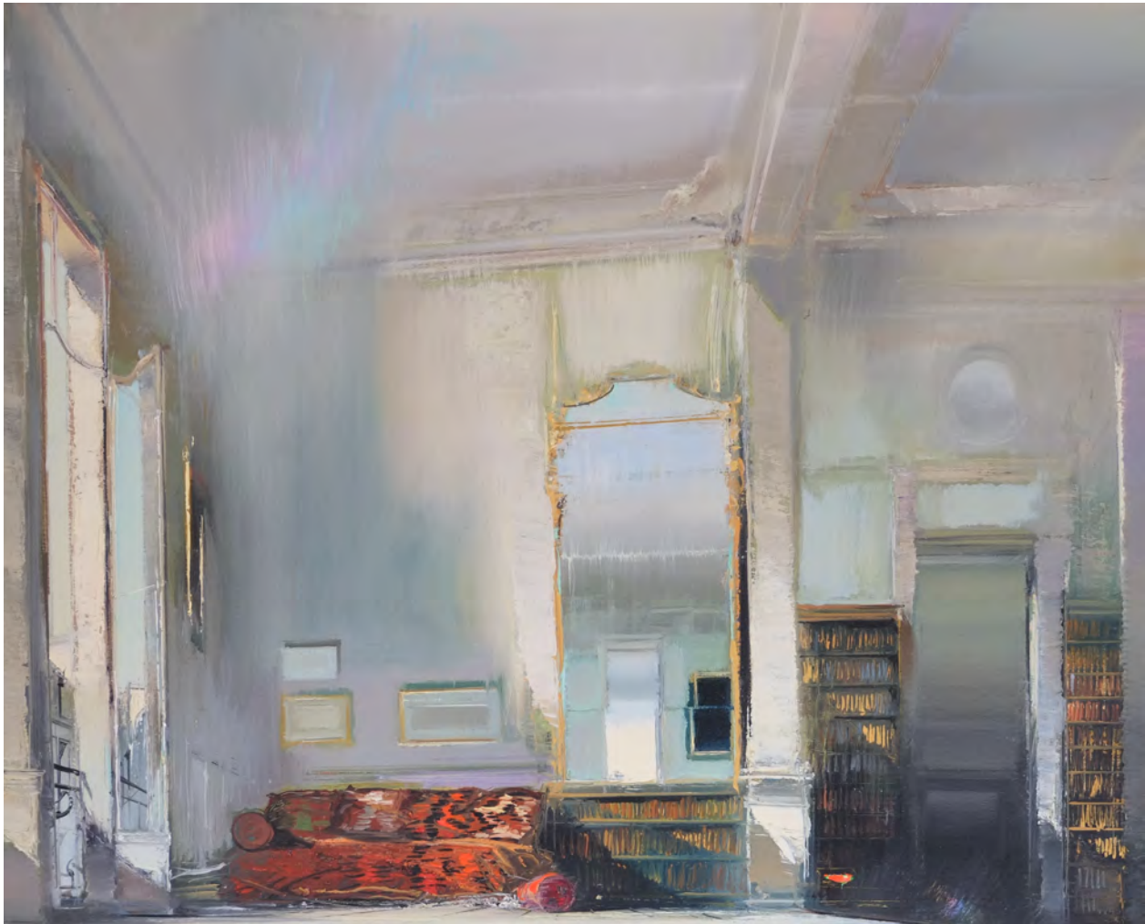
L'appartement de la rue des Beaux-arts - 81 x 100 cm