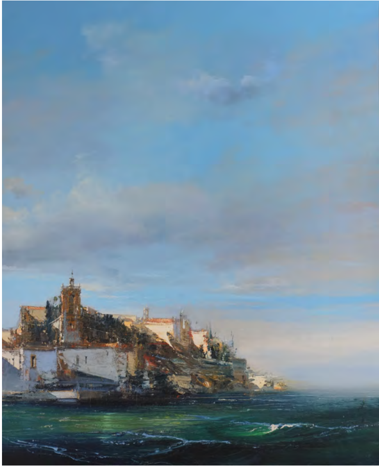
Isola - 100 x 81 cm