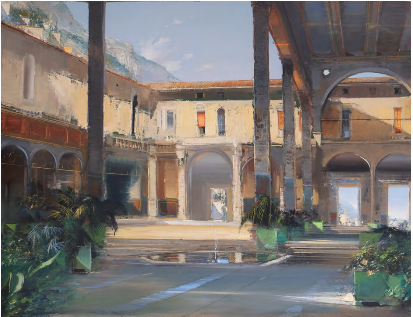
Le rosier de Borromini - 114 x 146 cm