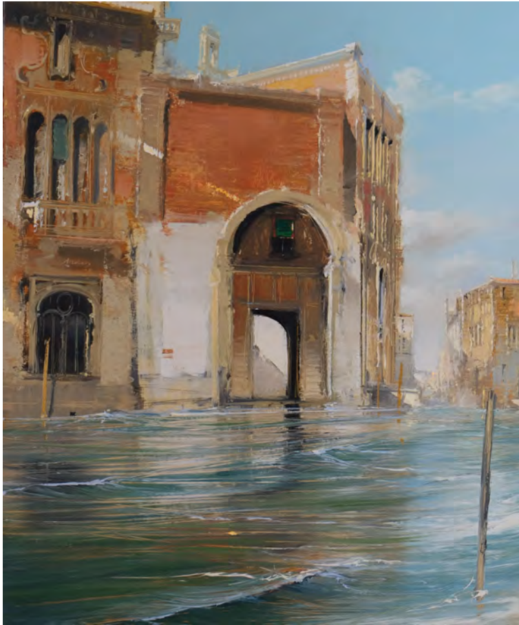
La fenêtre de l'Abbé Vivaldi - 73 x 60 cm