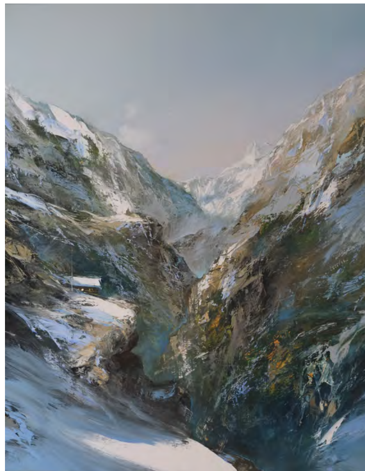
Erste Schnee - 92 x 73 cm