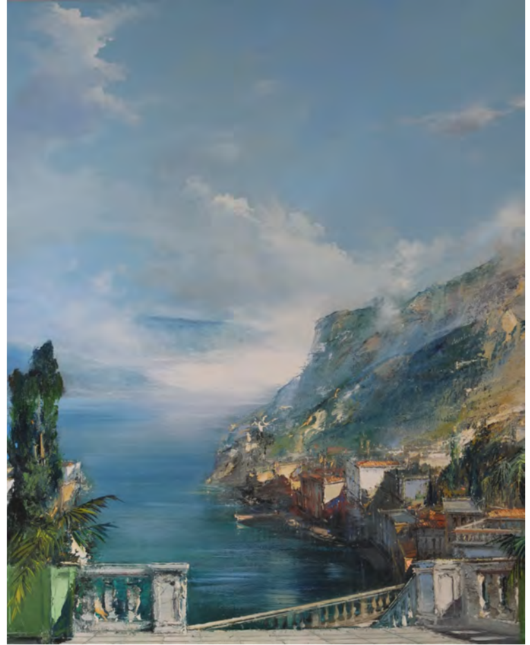
L'onde perse - 100 x 81 cm