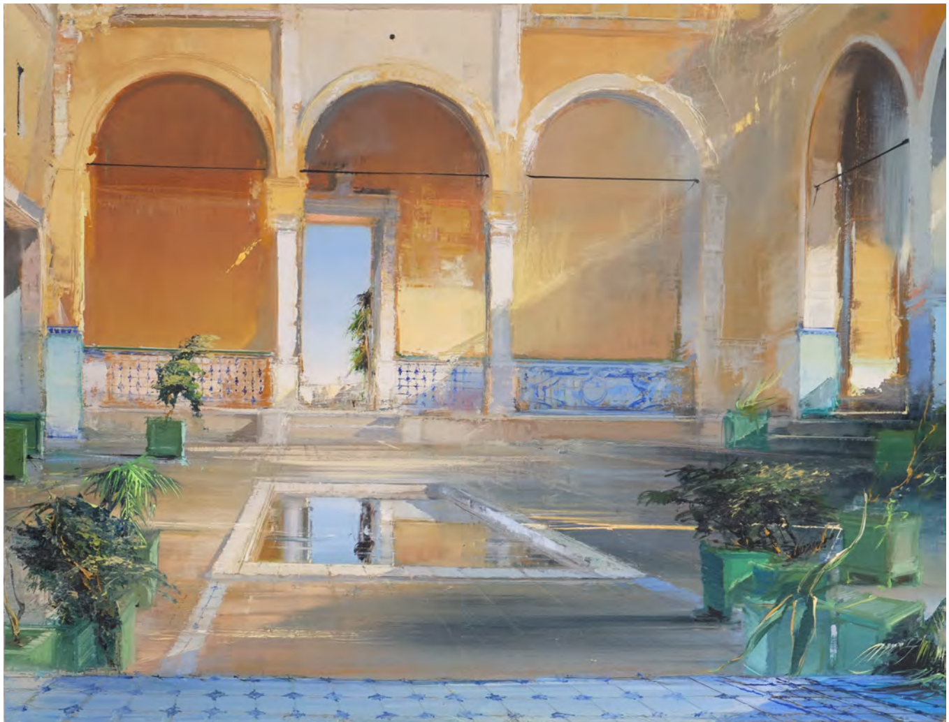
La fenêtre du Padre Antonio Soler - 89 x 116 cm