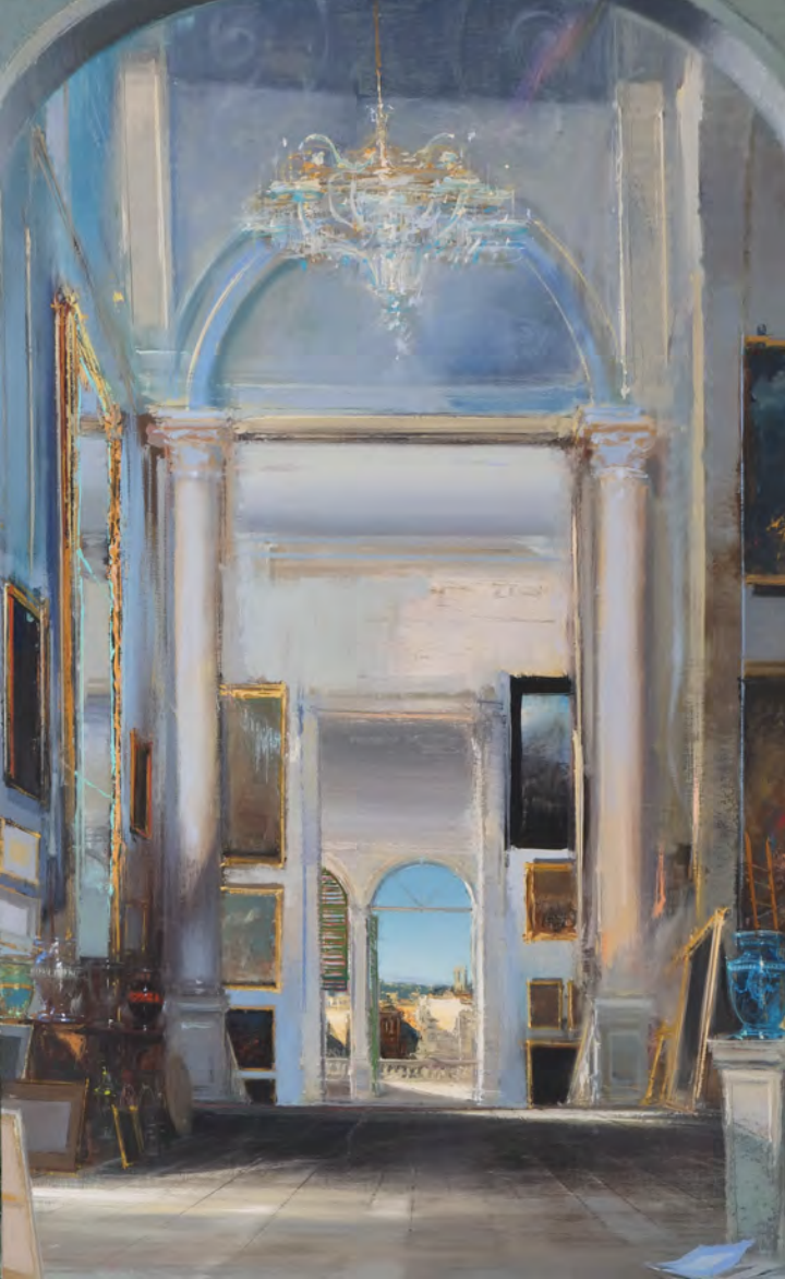
Chroniques italiennes - 130 x 81 cm