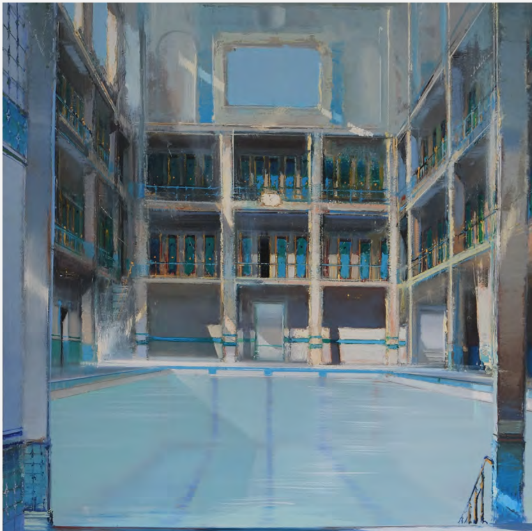
Eau de Javel - 100 x 100 cm