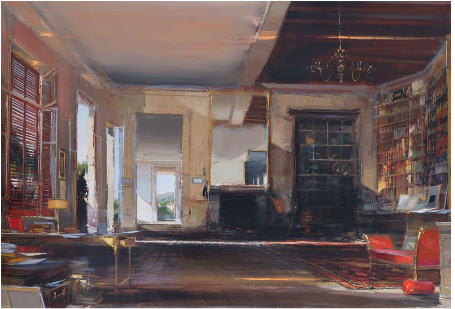
A la campagne - 114 x 162 cm