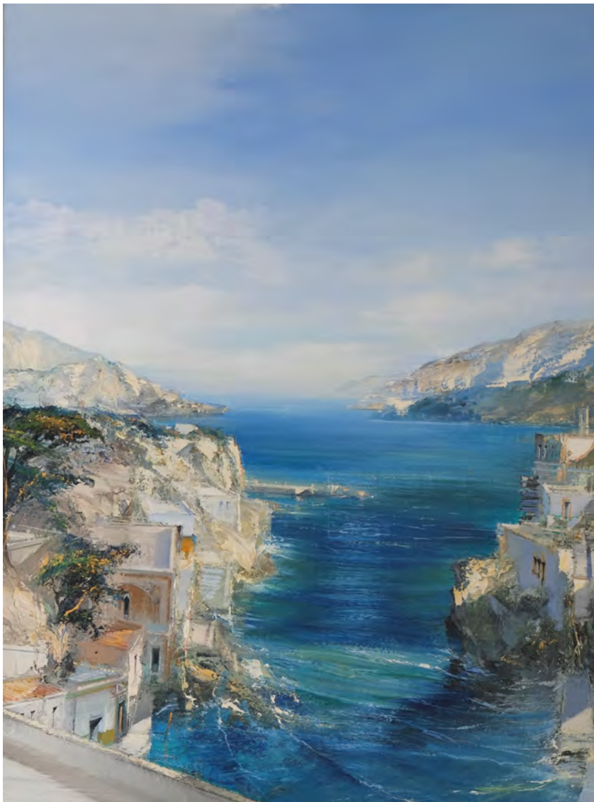
Bleu d'Algarve - 130 x 97 cm