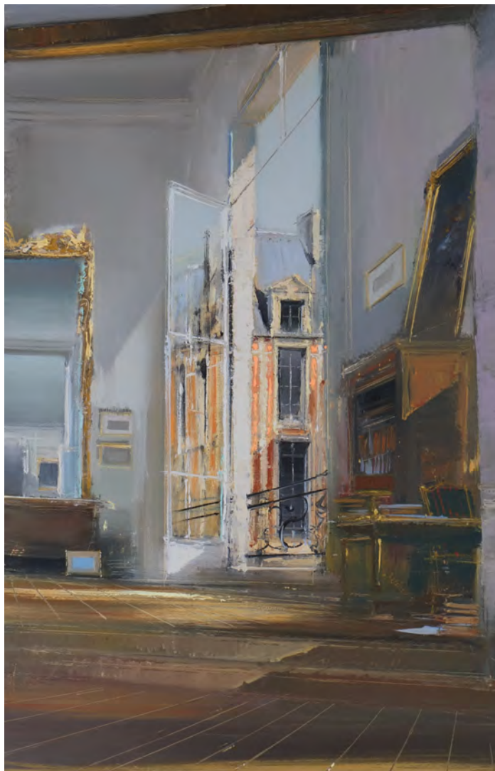
Grand siècle - 92 x 60 cm