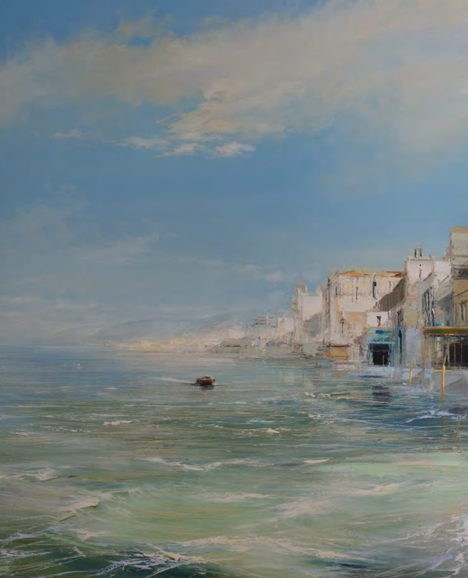
Le vent se levait - 100 x 81 cm