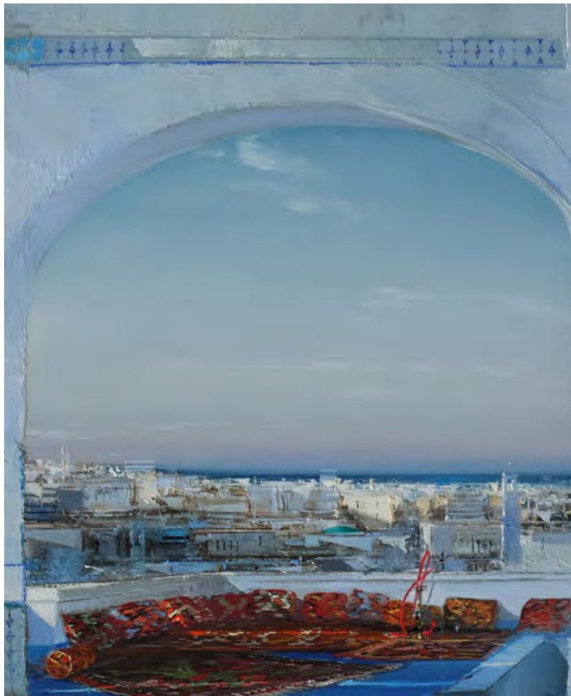
Levant - 73 x 60 cm