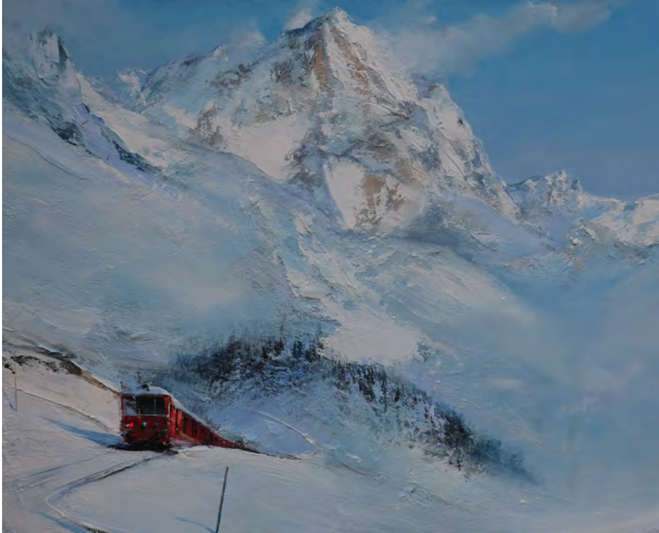
Train valaisan - 81 x 100 cm