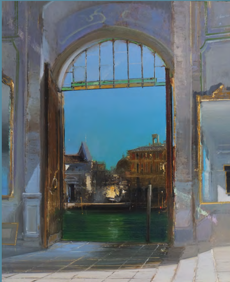
La luna - 73 x 60 cm