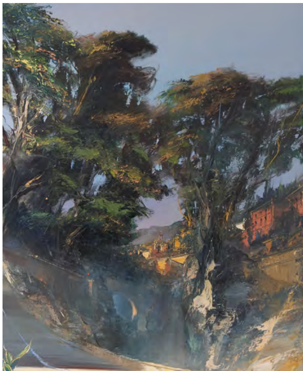
Latium - 81 x 65 cm