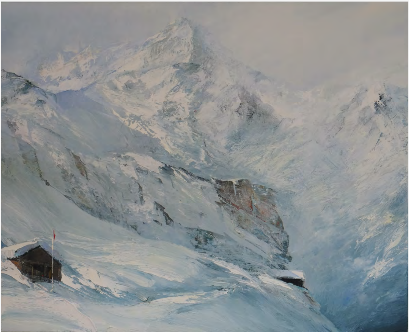
Helvetia - 81 x 100 cm