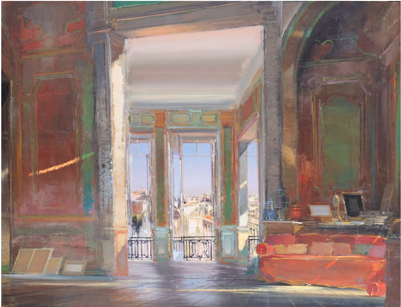
Giugno - 89 x 116 cm