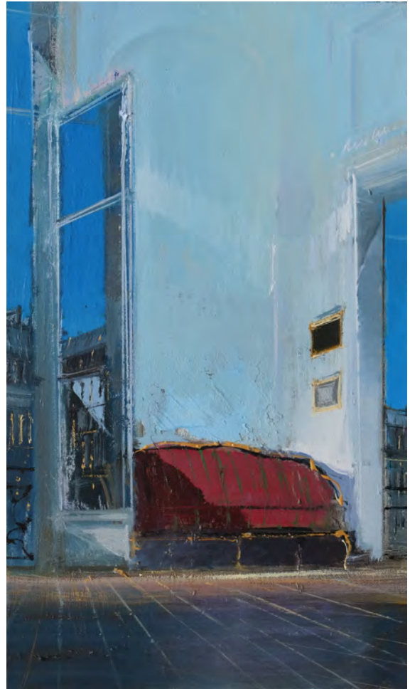
Summertime - 46 x 27 cm