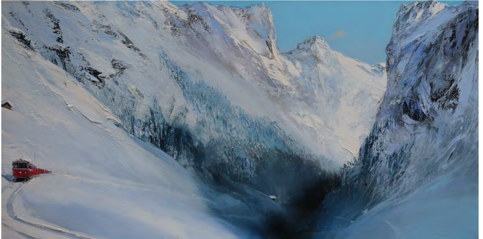
Satin blanc - 60 x 120cm