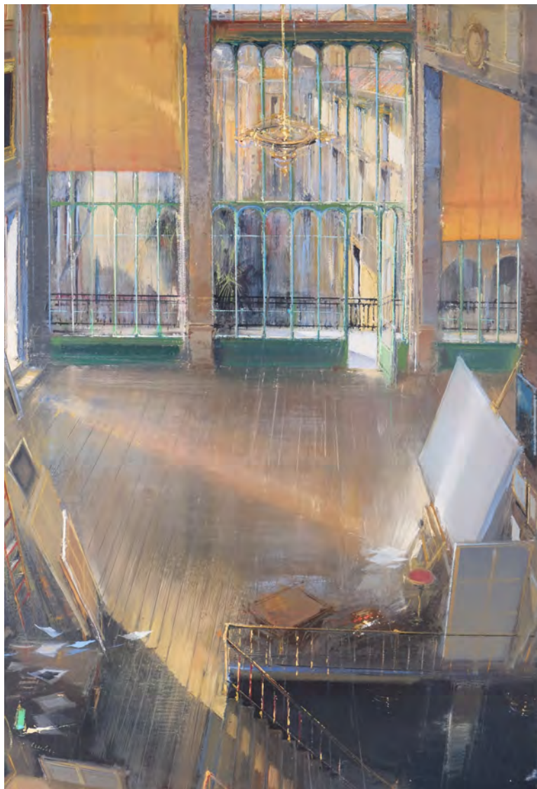
L'atelier catalan - 130 x 89 cm