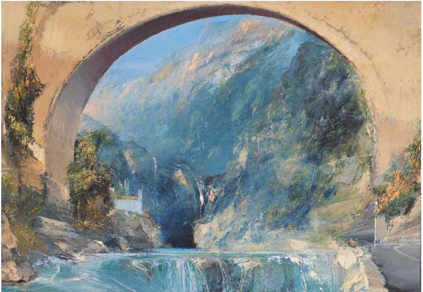
Il ponte - 81 x 116 cm