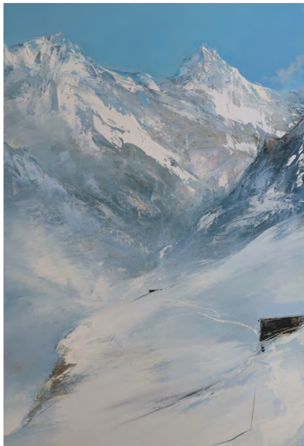
Entre le Valais et le Piémont - 81 x 54 cm