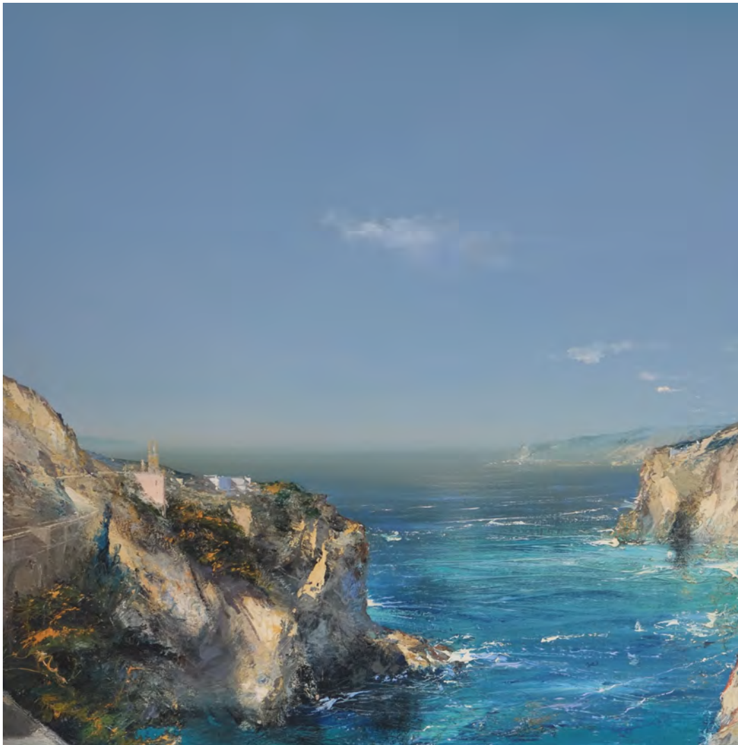
Grande Grèce - 100 x 100 cm