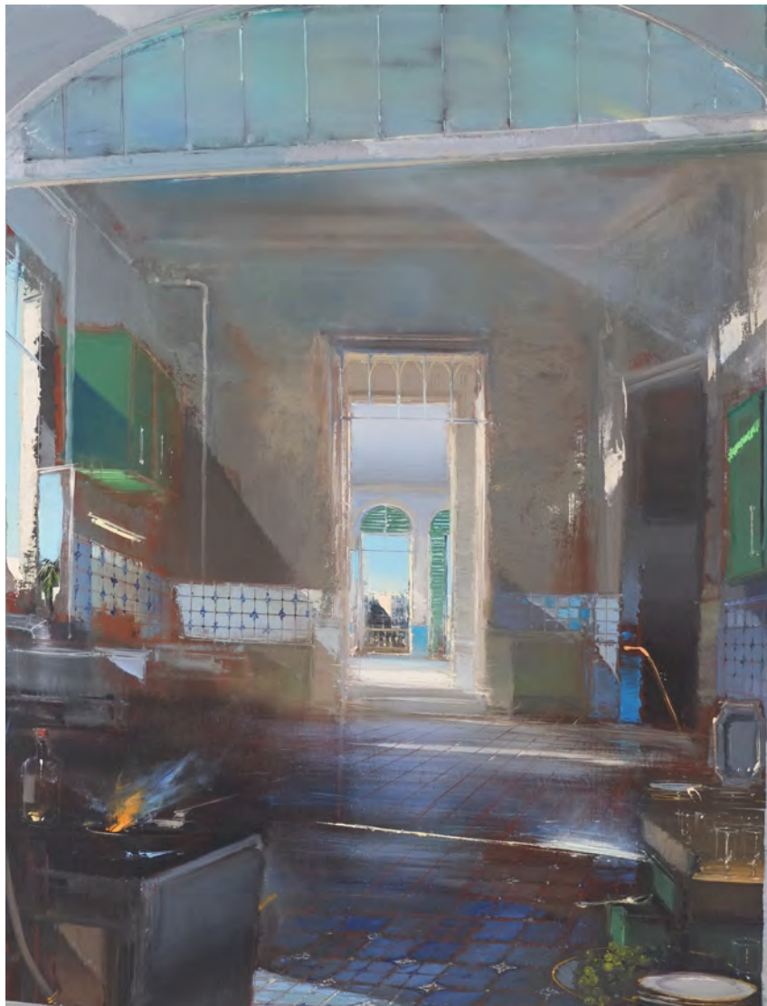
Rhum brésilien - 116 x 89 cm