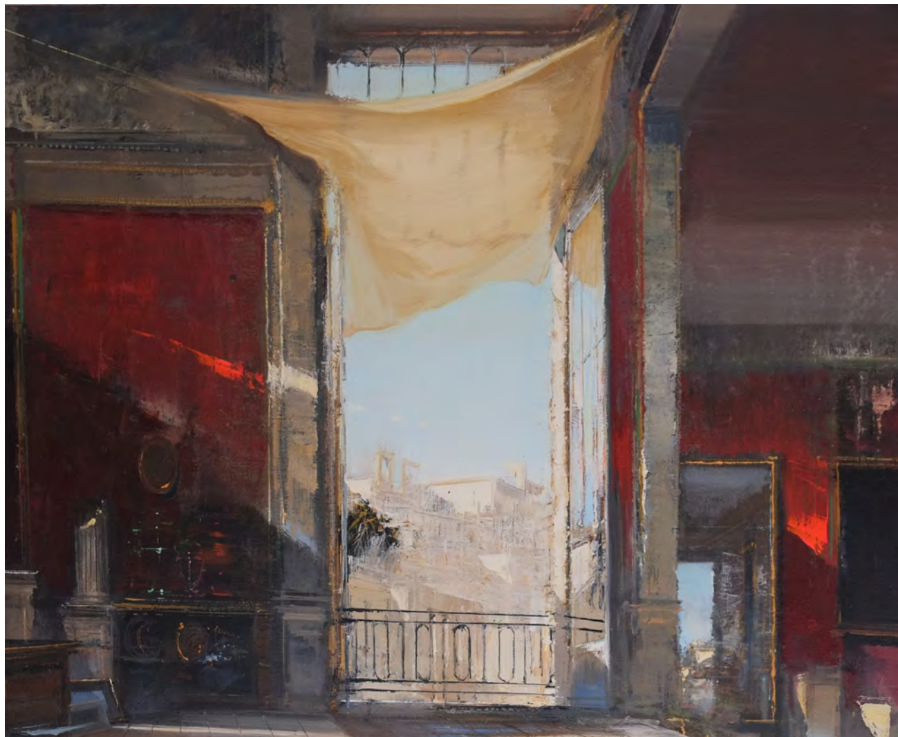
A fresco - 81 x 100 cm