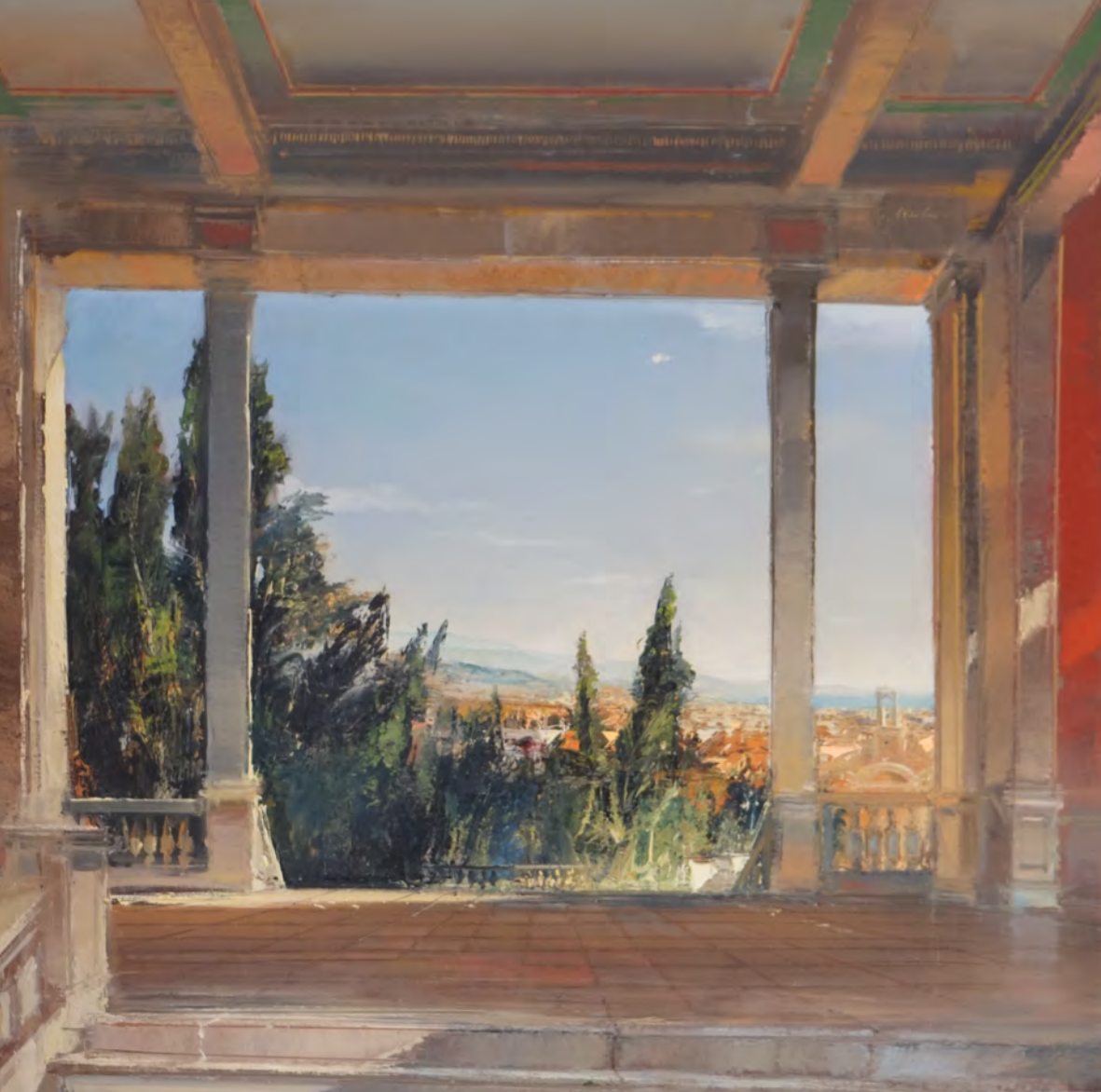
A la napolitaine - 100 x 100 cm