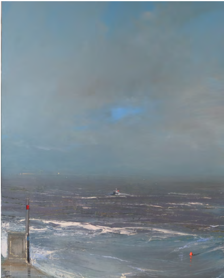
Il ritorno dei pescatori - 81 x 65 cm