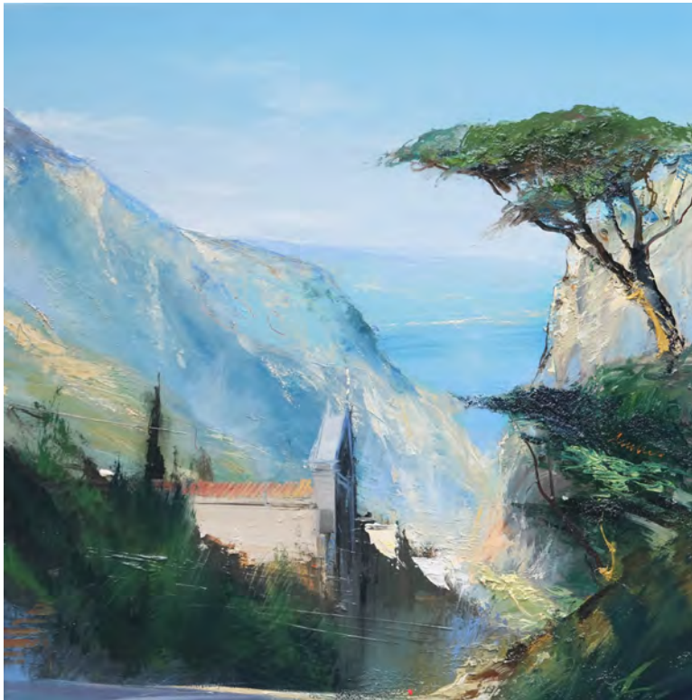
Joli vent - 60 x 60 cm