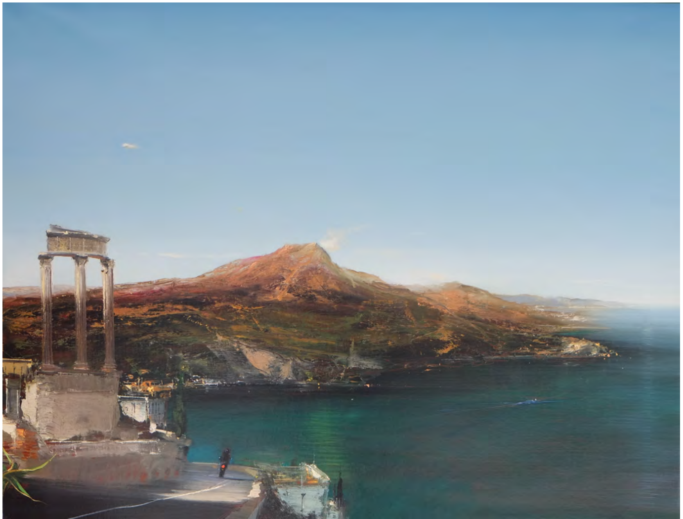
La motocicletta - 89 x 116cm