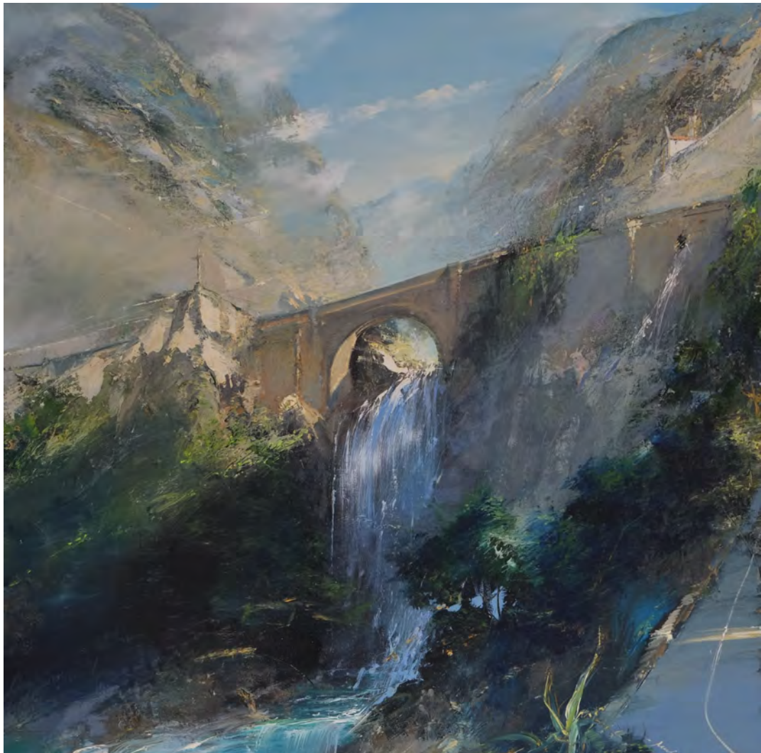
Ticino - 100 x 100 cm