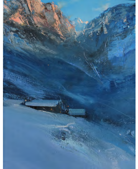
L'heure bleue - 65 x 50 cm