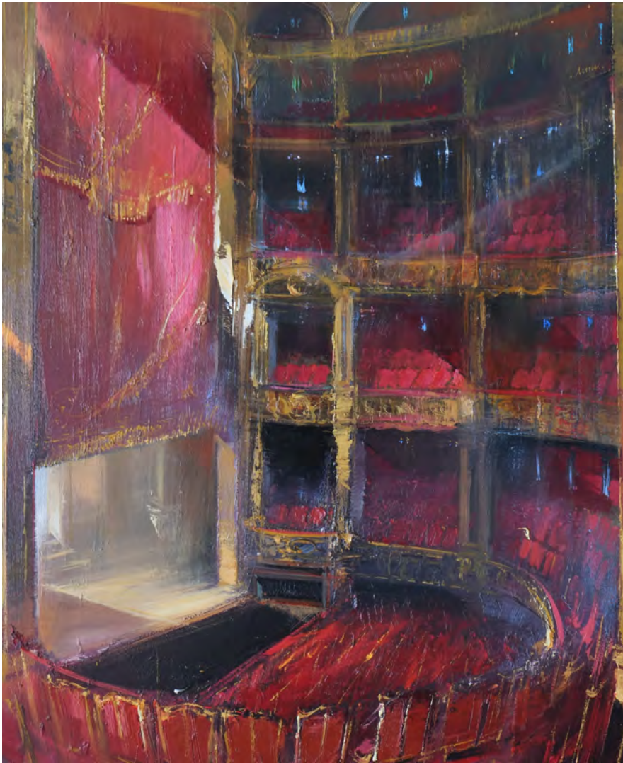
La Cavantine - 100 x 81 cm