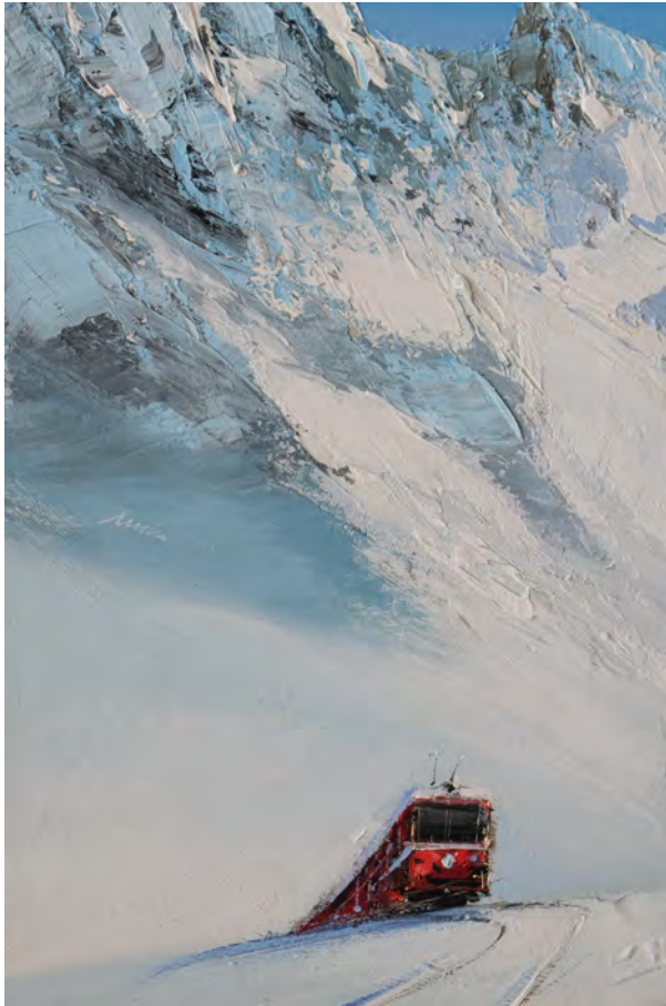
Oberland - 41 x 27 cm