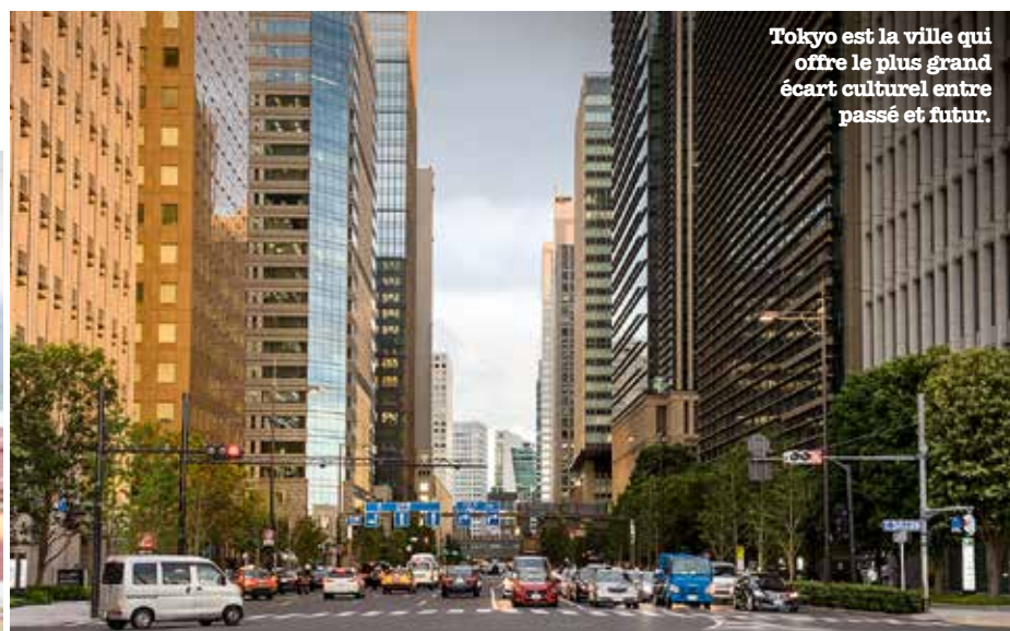
Tokyo est la ville qui offre le plus grand écart culturel entre passé et futur.