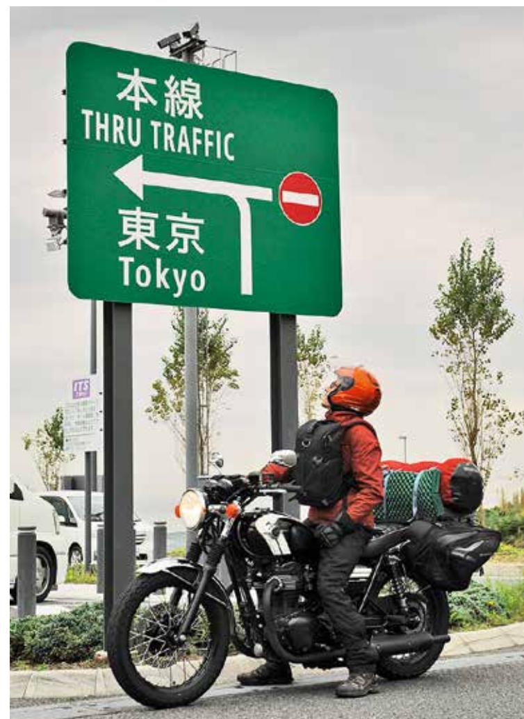
Entre villes et campagnes, le Japon offre deux visages radicalement différents et la moto est le moyen idéal pour les découvrir.

decidez de voir un peu moins de pays via les nationales. Une seconde option moins coûteuse mais qui réduit le rythme de croisière car la vitesse y est limitée à 40 ou 50 km/h. Les Japonais ne sont pas toujours respectueux des limitations (la route serait-elle un exutoire ?), mais lorsqu'ils le sont, personne ne les double. Prenez alors votre mal en patience et admirez le paysage. • Il est obligatoire de rouler avec le permis de conduire traduit en japonais (65 euros/pers.) Une formalité dont se charge le loueur.