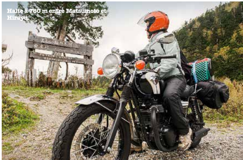
Halte à 780 m entre Matsumoto et Hirayu