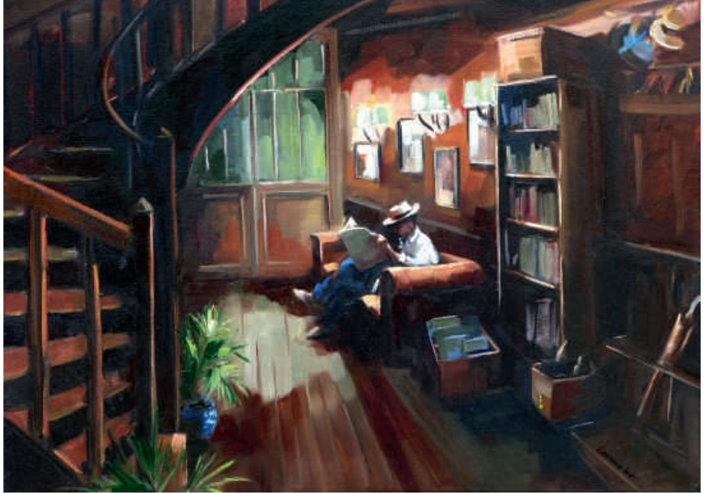
La lecture du journal - 65 x 92 cm