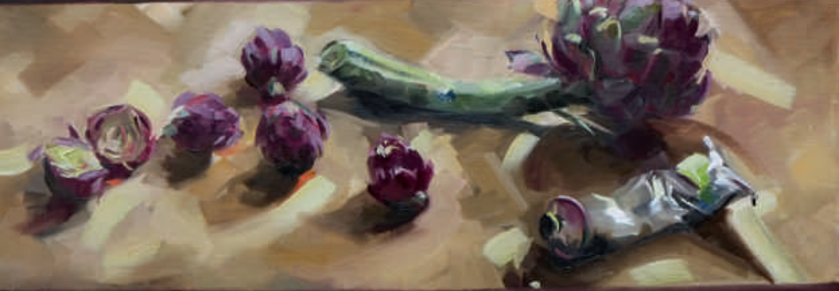
Cœur d'artichauts - 40 x 80 cm