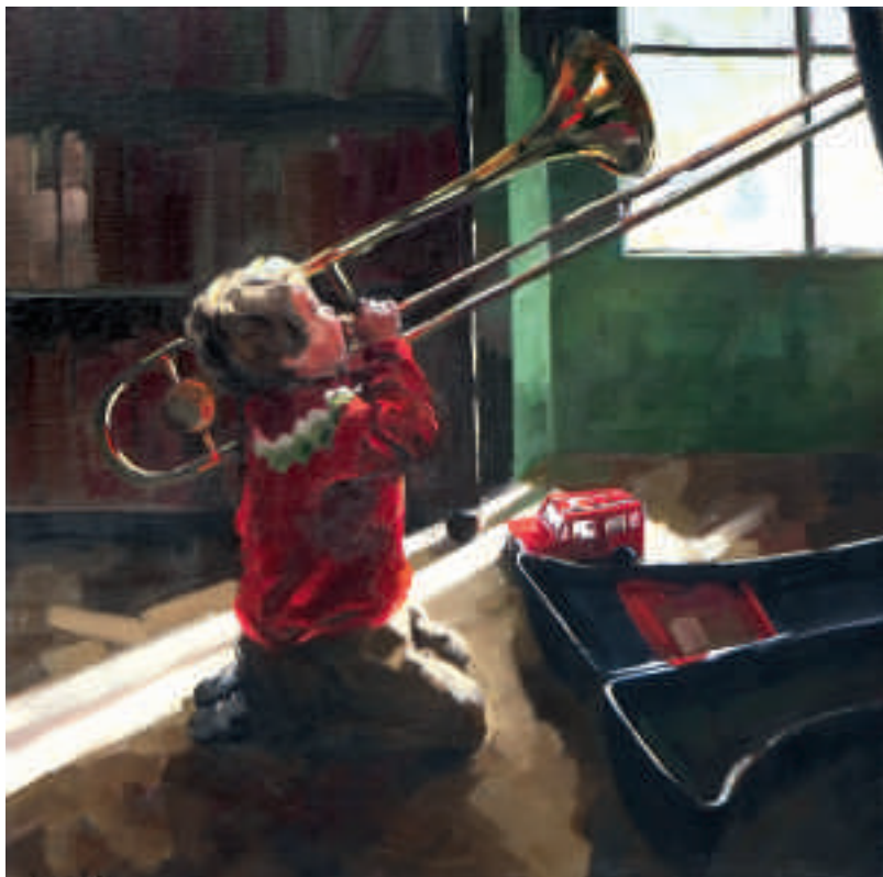
L'appel du trombone - 80 x 80 cm