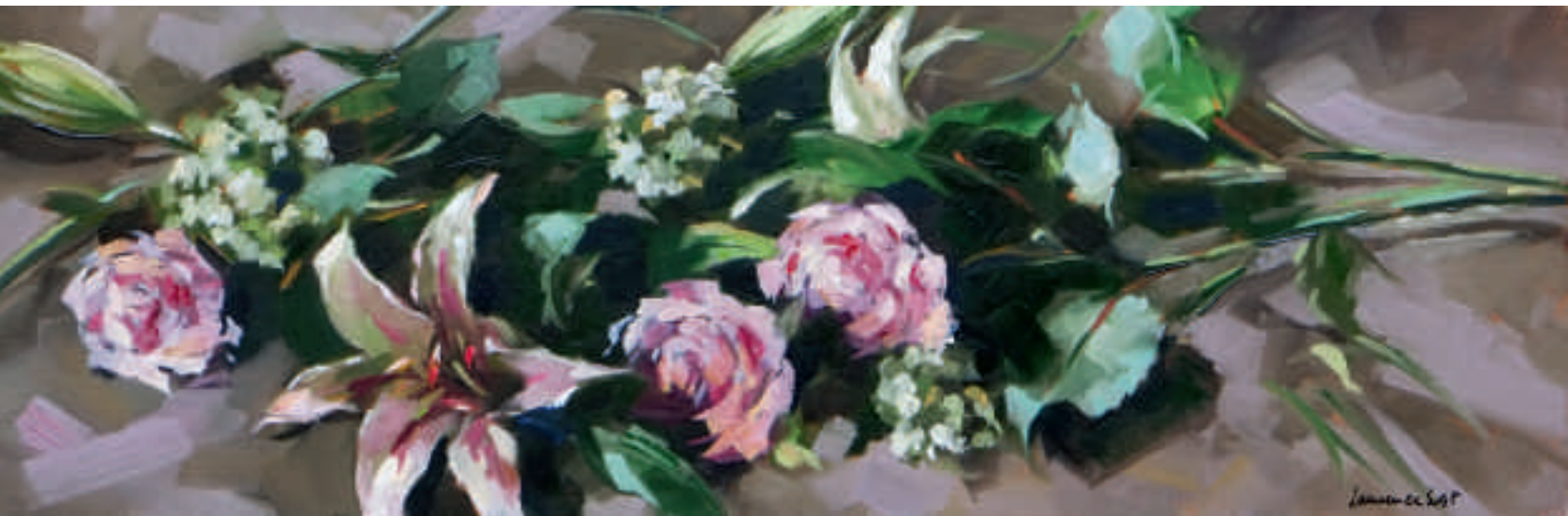
Le lys - 25 x 75 cm