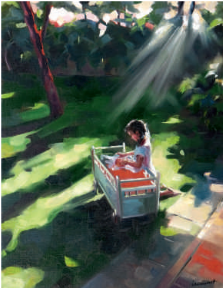
Ci-contre : Fin de journée d'été - 65 x 50 cm