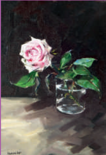
La rose de Joséphine - 55 x 38 cm