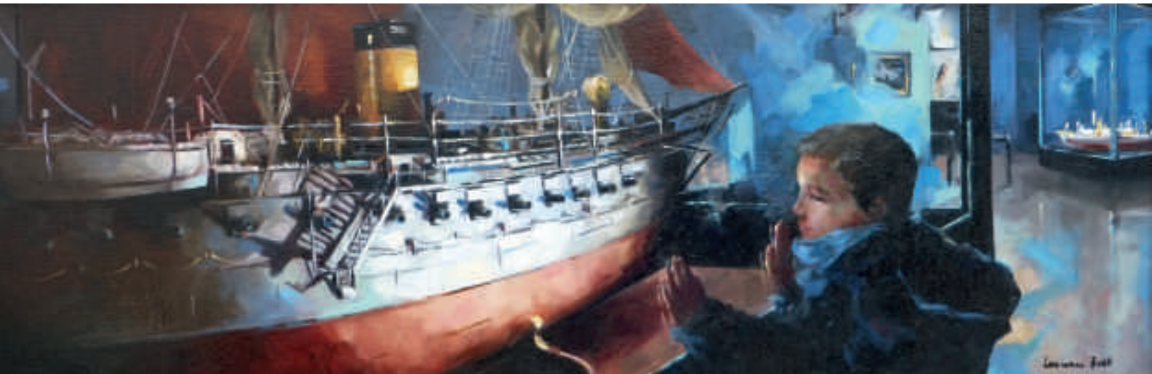
Un jour je serai marin - 40 x 120 cm