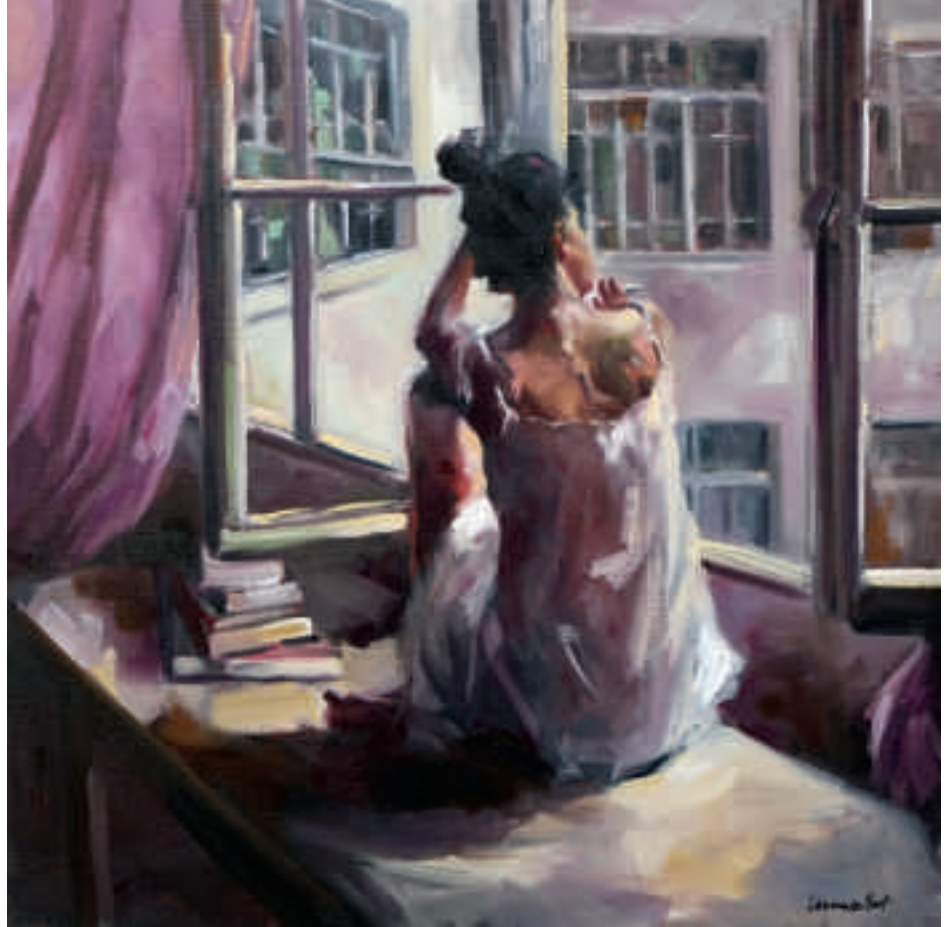
Ci-dessus : La pause après la pose - 60 x 60 cm