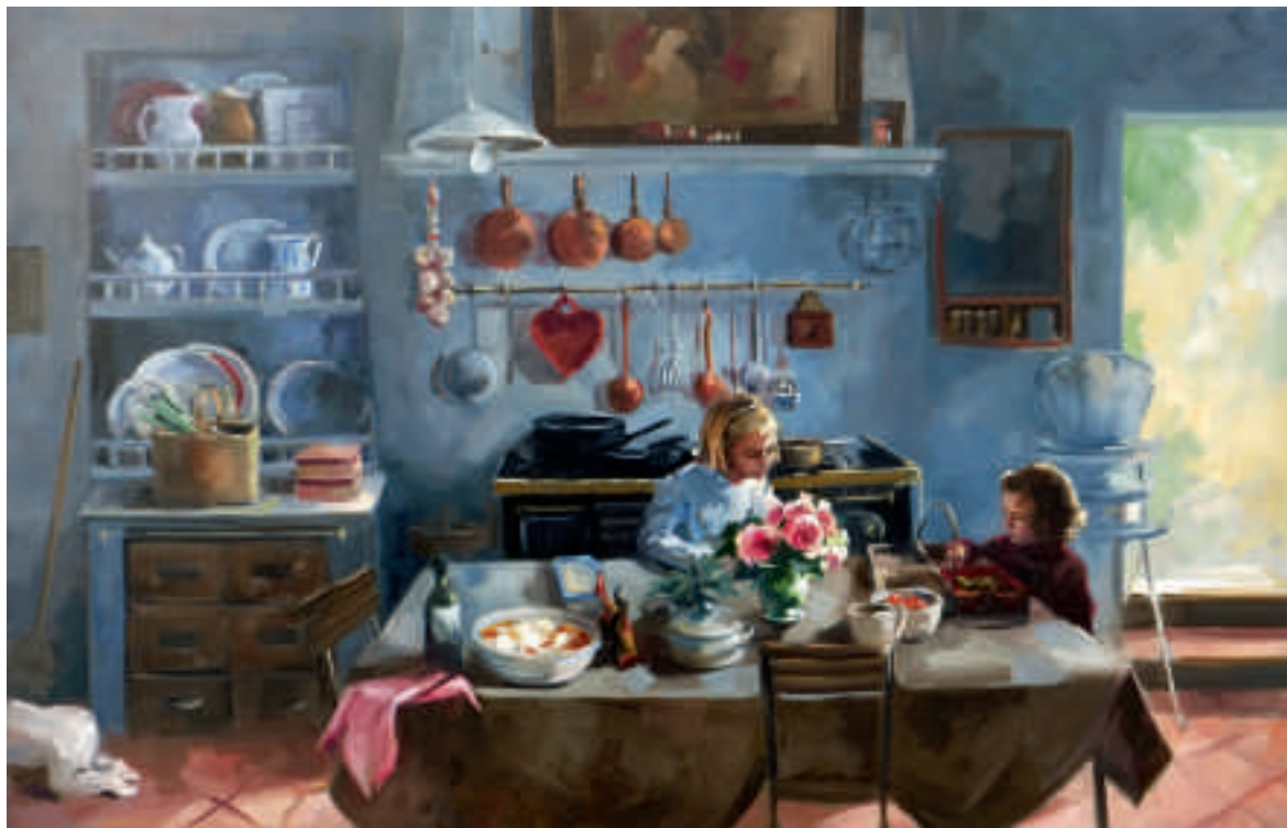
Déjeuner de Toussaint - 80 x 130 cm

DÉJEUNER DE TOUSSAINT Odeurs presque ancestrales d'un repas automnal, des saveurs d'enfance que nos mémoires exhalent.