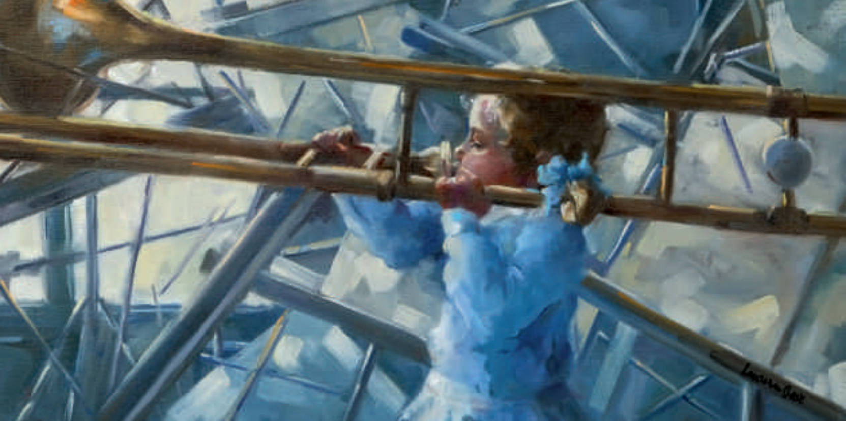
Concerto bleu - 40 x 80 cm