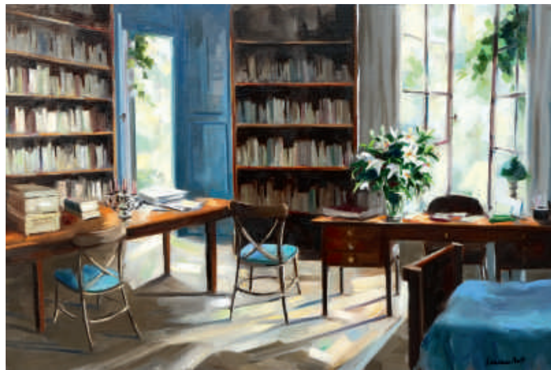
Renaissance - 60 x 92 cm