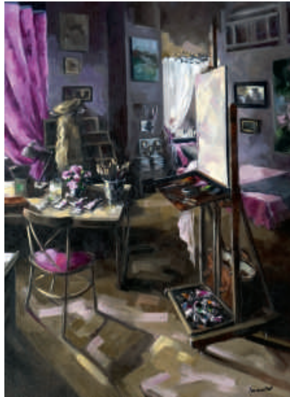
À gauche : L'atelier II - 80 x 40 cm