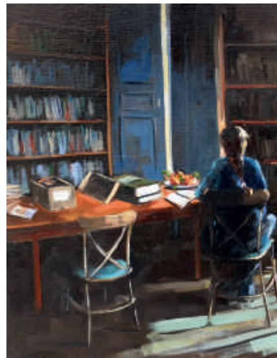
Convalescence - 60 x 92 cm

SOUFFRANCE (convalescence, renaissance) Même dans l'ombre intérieure, même si les fleurs se meurent, la lumière est espoir, promesse de bonheur.