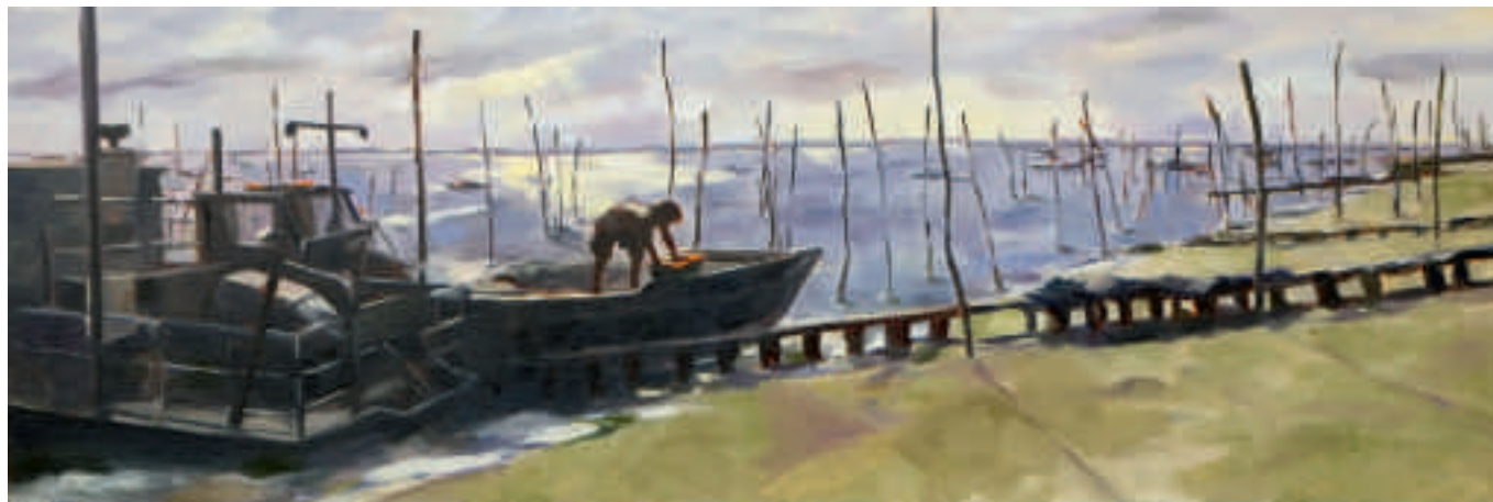
Le retour du parc à huîtres - 50 x 150 cm