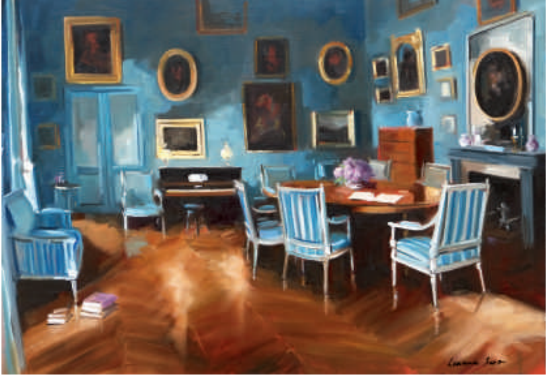
Le salon de George Sand - 65 x 92 cm