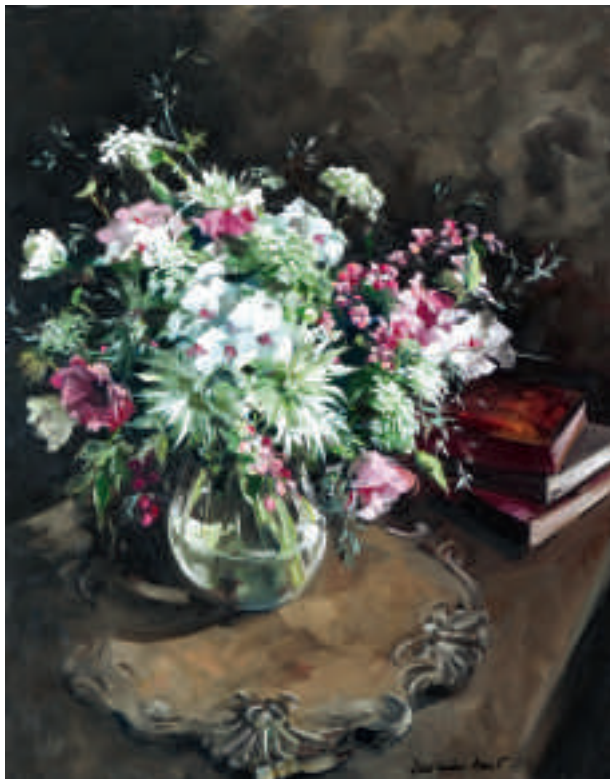
Ci-dessus : Hortensias et pivoines - 92 x 73 cm