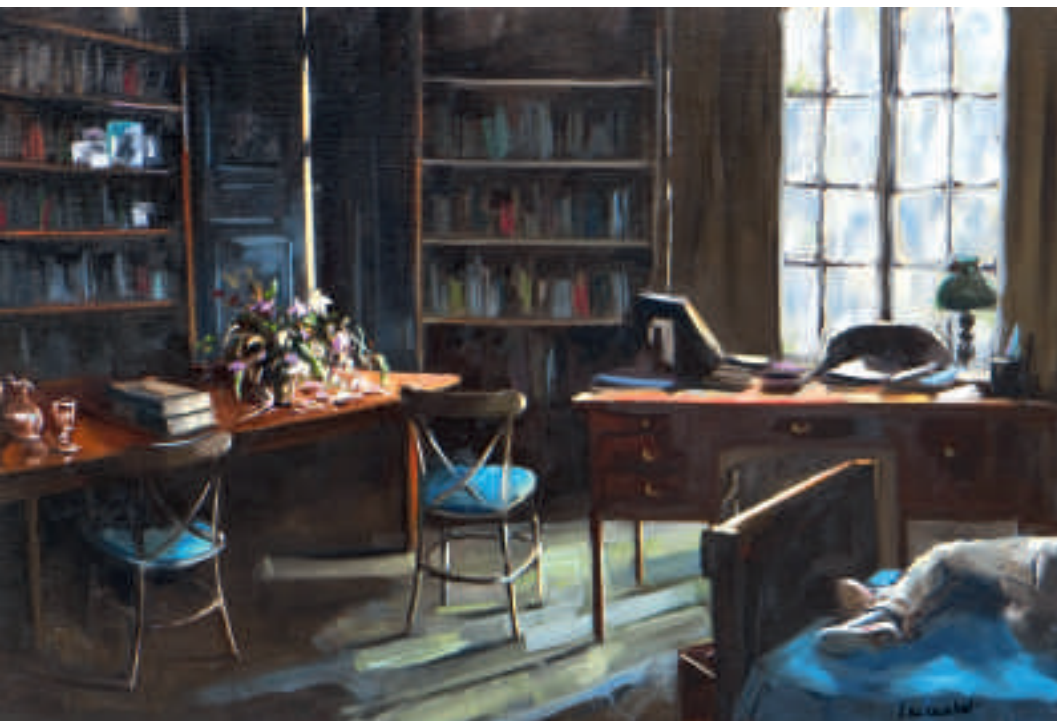
Souffrance - 60 x 92 cm