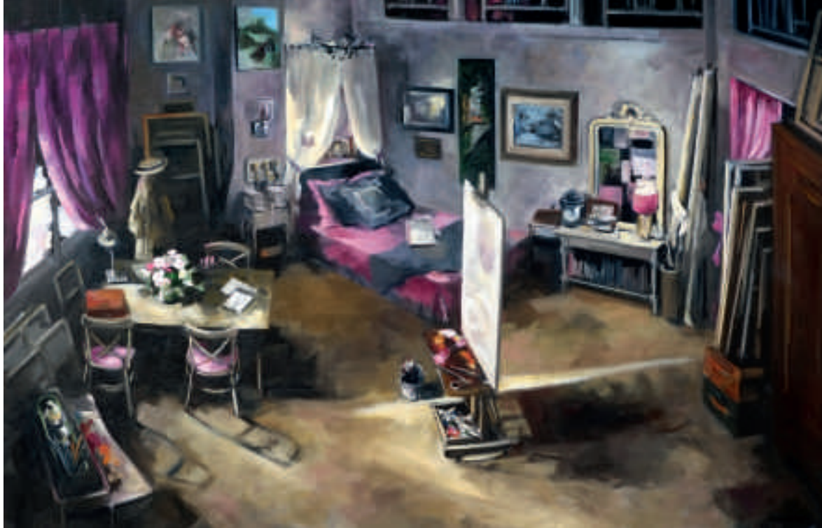
L'atelier III - 89 x 146 cm

L'ATELIER III L'atelier grand ouvert, tel un cœur qui espère faire entrer la lumière d'un peintre si sincère.