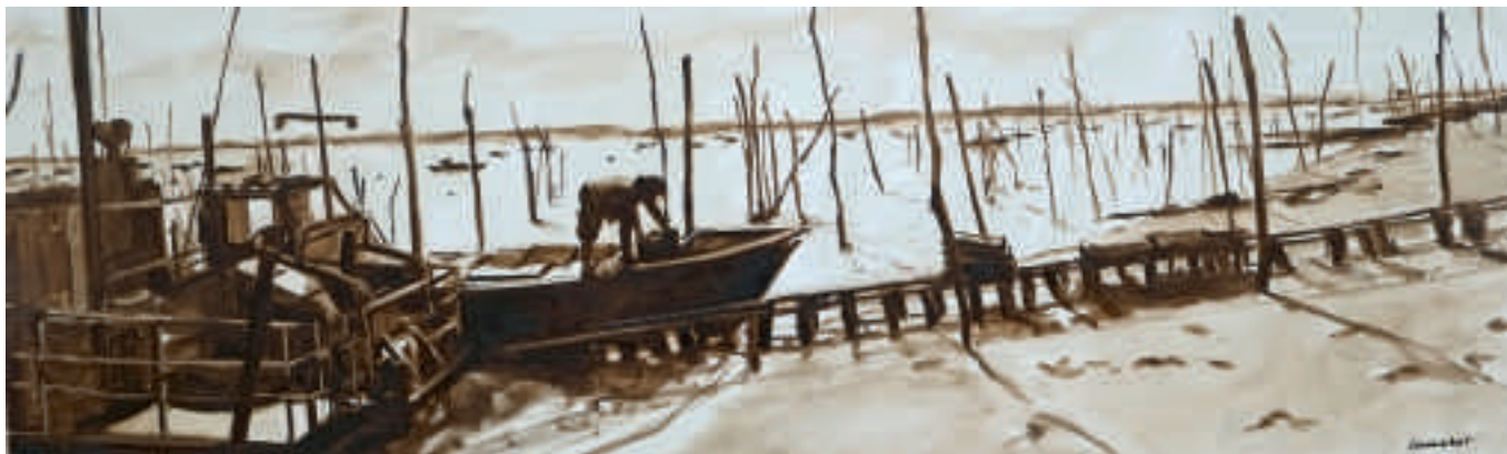
L'ostréiculteur black and white - 50 x 150 cm