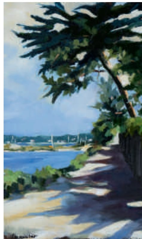
La Luge, Cap Ferret - 55 x 33 cm

L'APPEL DU TROMBONE (un cuivre au ciel) Un cuivre au ciel réveille soudain, les soldats, les romains, une fanfare de musiciens, ses immenses rêves de gamin.