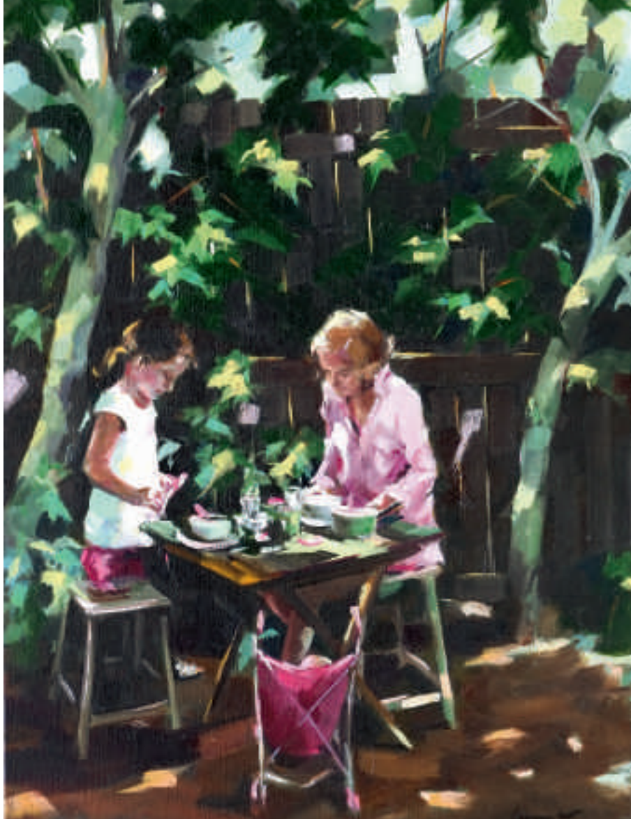
Dinette sous les arbres - 73 x 54 cm