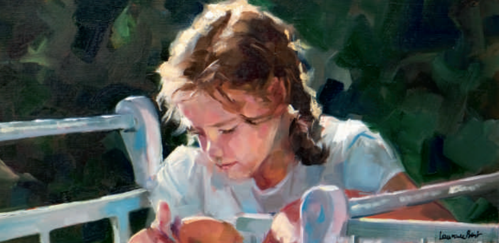
Constance - 30 x 60 cm