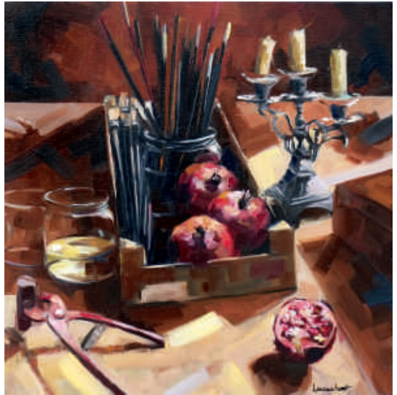
Ci-dessus : Pince à tendre fruits de la passion - 60 x 60 cm