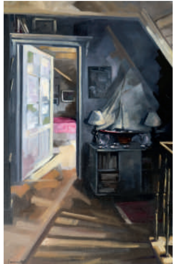
Ci-dessus : La chambre - 100 x 65 cm