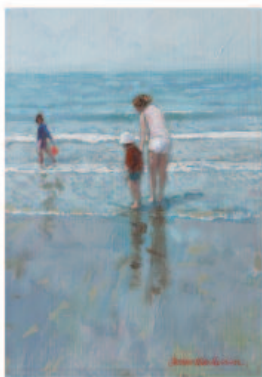
Plage de Deauville

Le nom même de Deauville évoque l'image d'une ville au bord d'un océan, une ville de grès et de schistes, une ville de la Côte d'Albâtre. C'est dans cette ville, au bord de la mer, que James Tissot a peint sa série de tableaux sur Deauville. La plage est visible dans les tableaux, mais elle n'est pas le sujet principal. Elle est au premier plan, mais elle est remplacée par les figures des baigneurs, des promeneurs, des amoureux. C'est dans cette ville, au bord de la mer, que James Tissot a peint sa série de tableaux sur Deauville. La plage est visible dans les tableaux, mais elle n'est pas le sujet principal. Elle est au premier plan, mais elle est remplacée par les figures des baigneurs, des promeneurs, des amoureux.