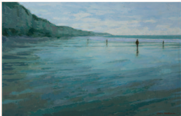
Plage de la Côte d'Albâtre

« La palette de James accorde des gammes de bleus, de verts de gris et d'ocres aux lumières de la Côte d'Albâtre dans lesquelles baignent ses sujets ou règne l'atmosphère rêveuse suggérant l'évidence du bonheur. »