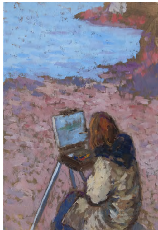
L'artiste - 35 x 24 cm