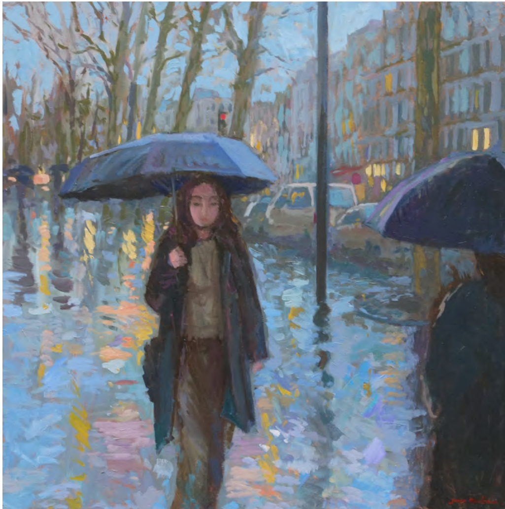
La rencontre - 90 x 90 cm