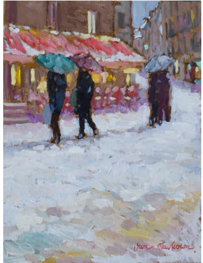
Les trois parapluies - 35 x 27 cm