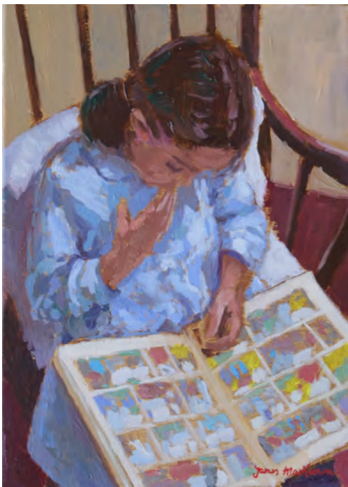
La BD - 46 x 33 cm