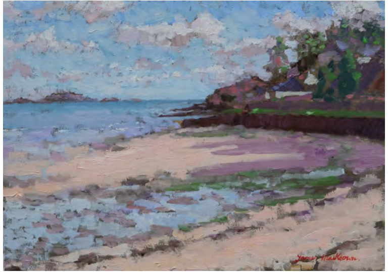
Un vent froid - 33 x 46 cm