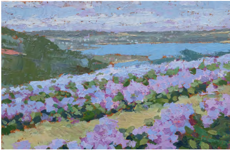
Les hortensias - 27 x 41 cm