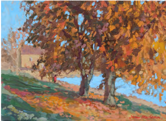
Automne - 24 x 33 cm