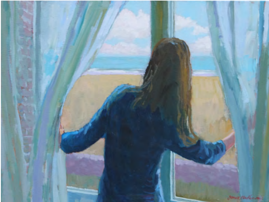
La surprise - 46 x 61 cm