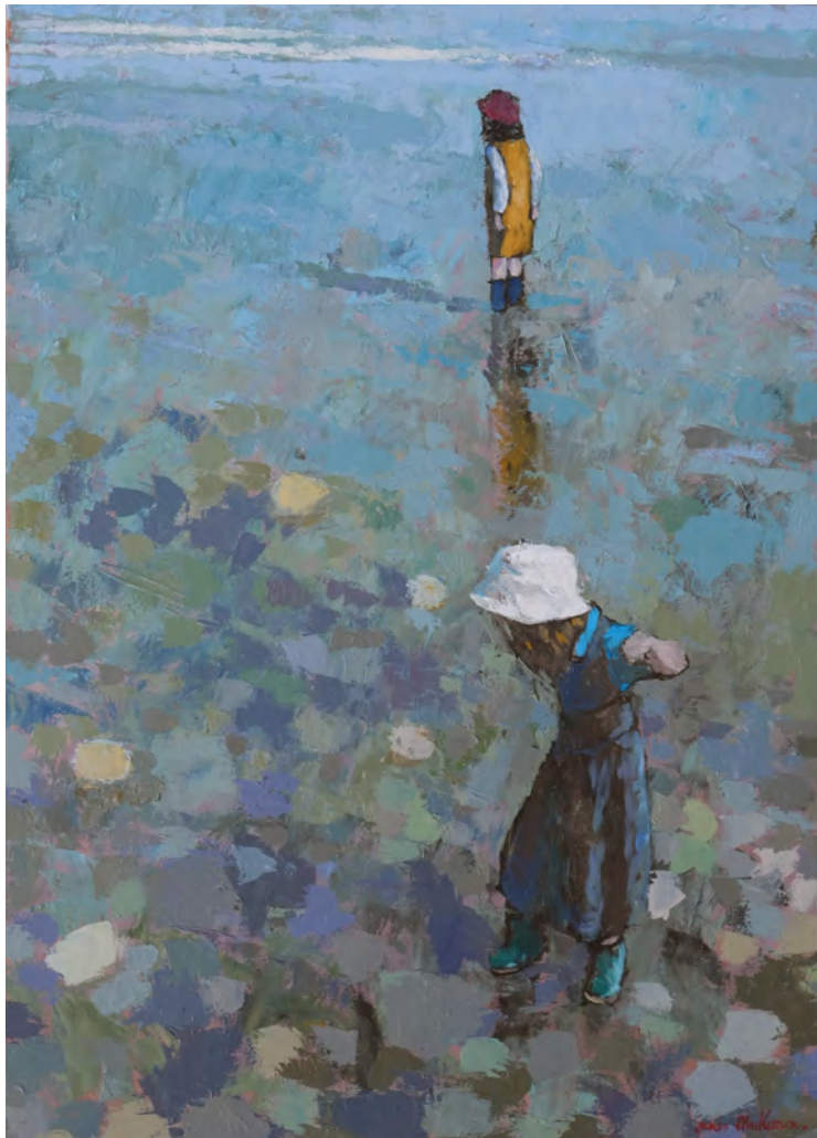
Marée basse, le petit bob blanc - 92 x 65 cm