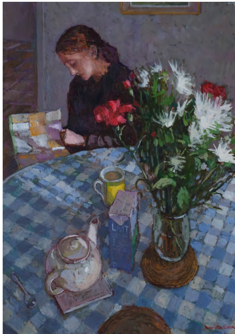
A droite: Le thé - 92 x 65 cm