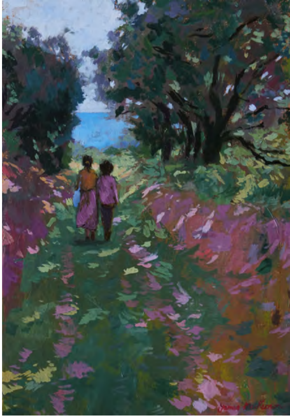
Le chemin - 55 x 38 cm