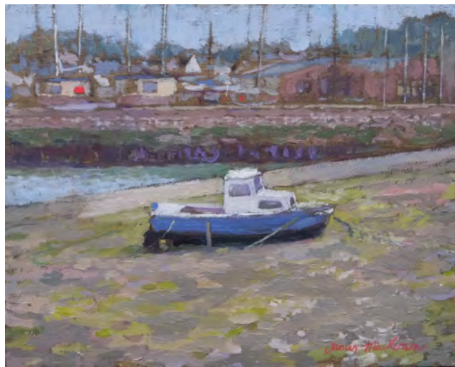
Le bateau bleu - 24 x 30 cm