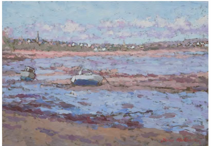
Marée basse à l'abbaye de Beauport - 33 x 46 cm