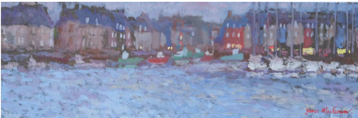
Le port, le soir - 20 x 60 cm