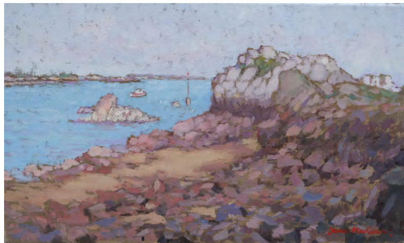
La roche, Loguivy - 33 x 55 cm