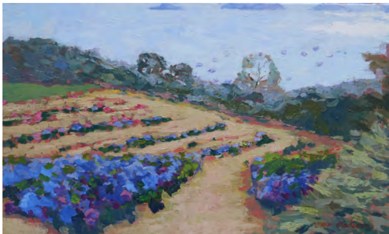
Un champs d'hortensias - 33 x 55 cm