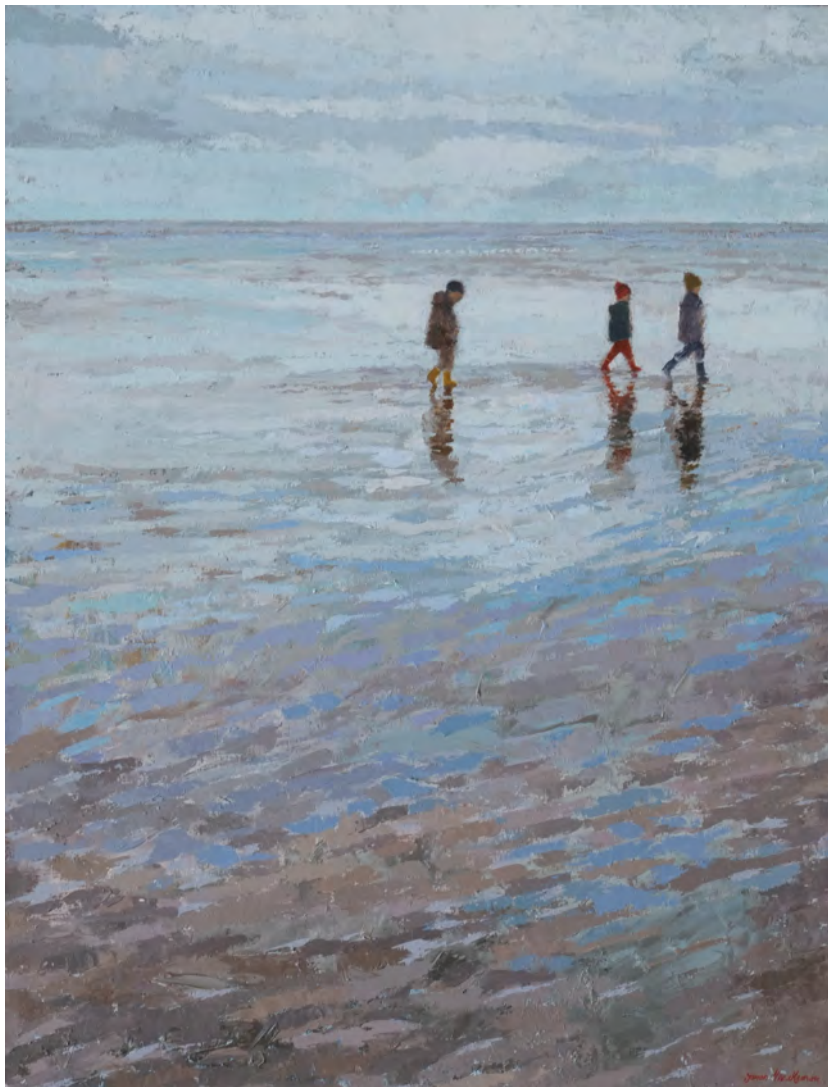
Le grand silence - 116 x 89 cm