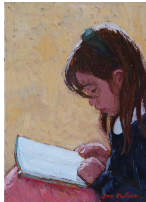
La petite lectrice - 46 x 33 cm