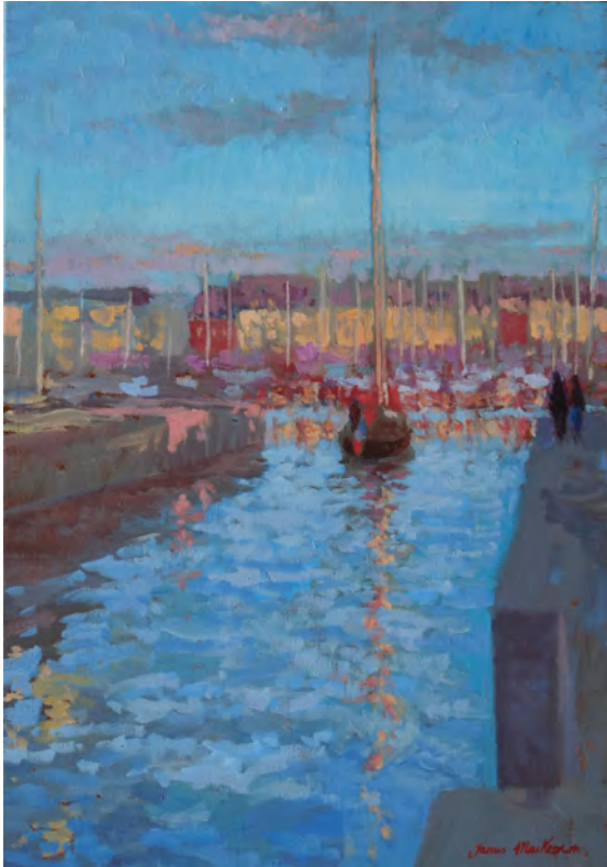
Le retour - 55 x 38 cm