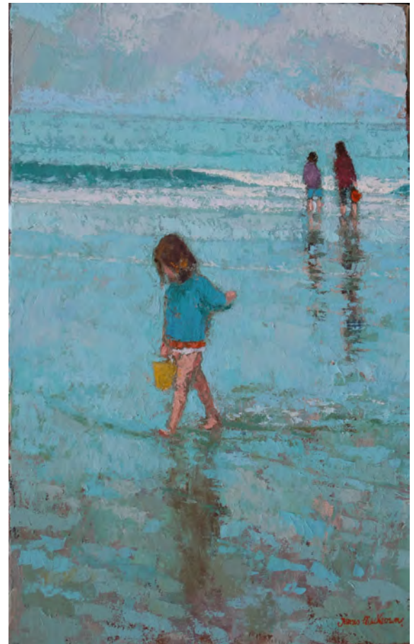
Pieds nus - 61 x 38 cm