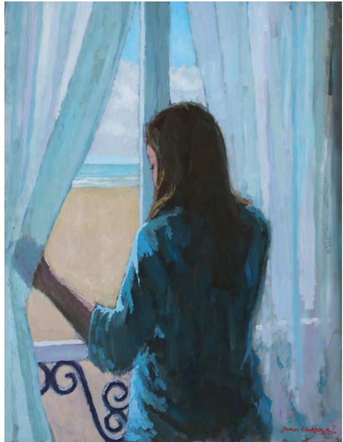
L'attente - 65 x 50 cm