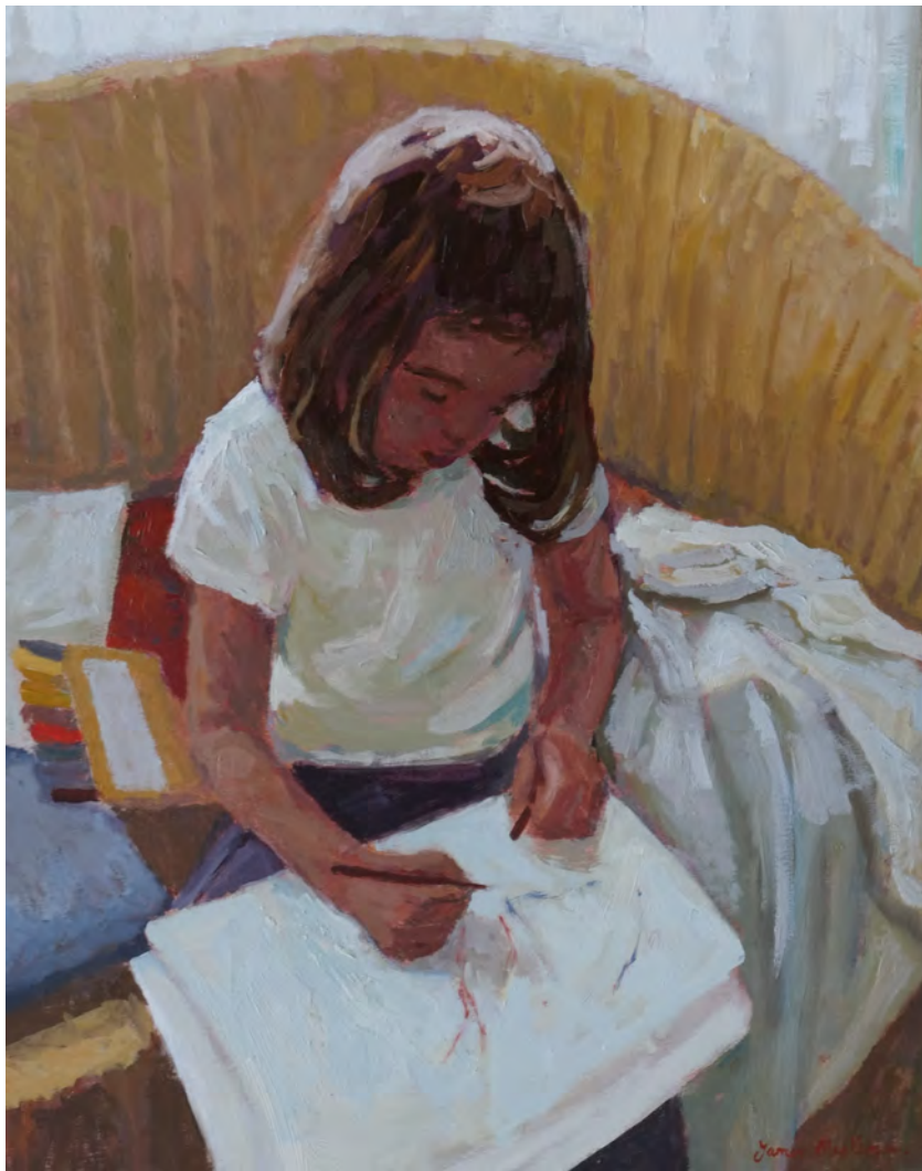
Le dessin - 81 x 60 cm