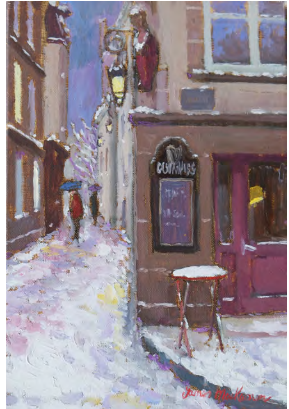
Guinness à Saint-Malo, la neige - 35 x 24 cm