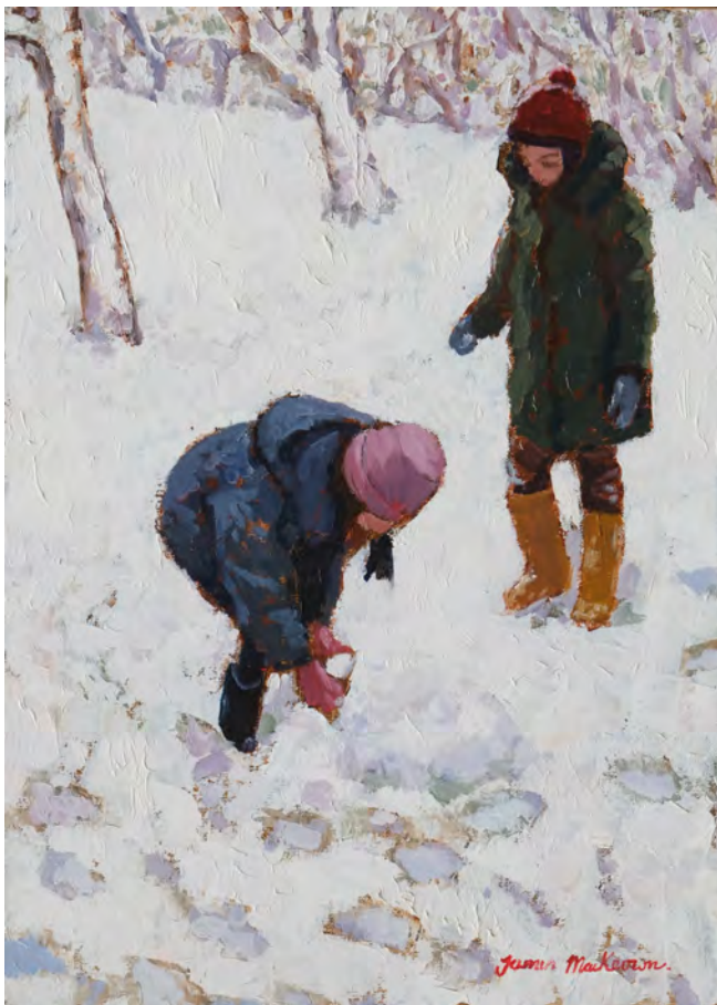
Dans la neige - 46 x 33 cm