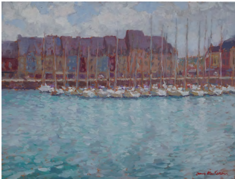
Paimpol - 46 x 61 cm