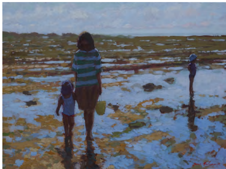
Fin de la journée - 60 x 81 cm