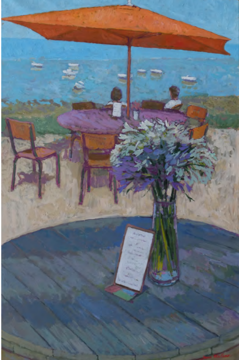
Le bar à huitres - 100 x 65 cm