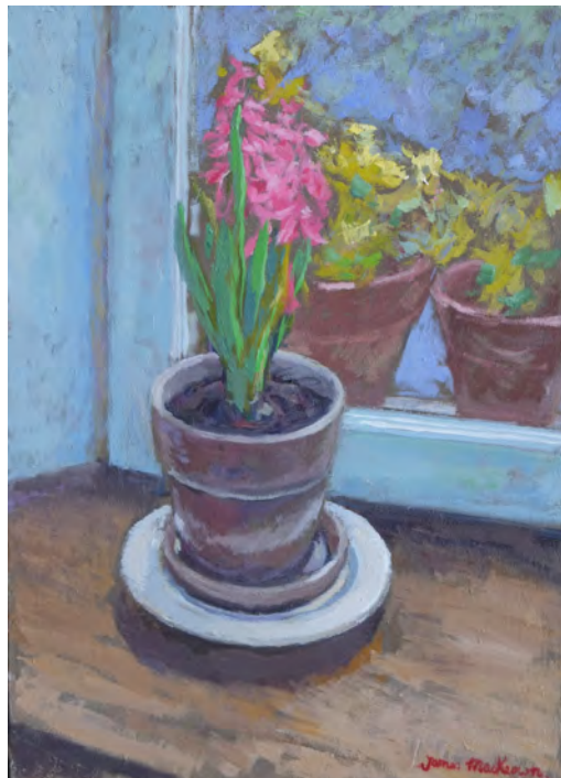
La jacinthe - 46 x 33 cm