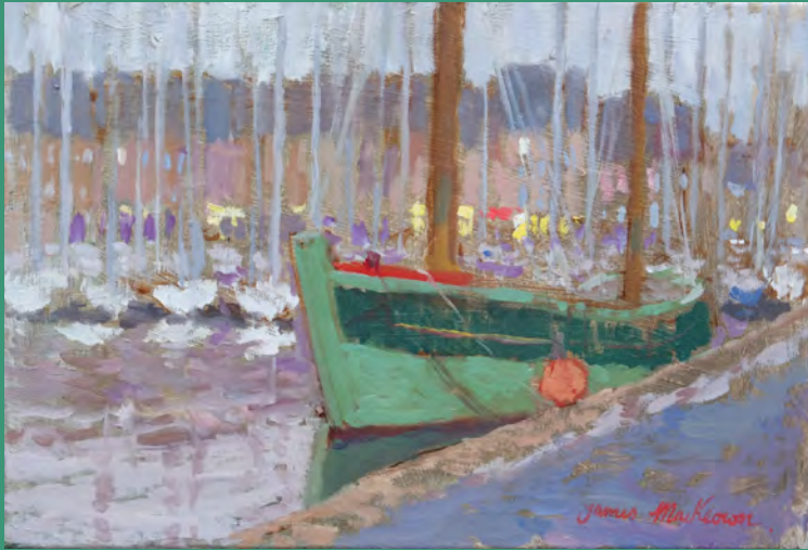
Le Neptune - 24 x 35 cm