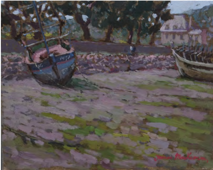
Un autre jour - 24 x 30 cm