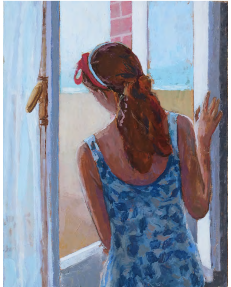
A la fenêtre - 65 x 50 cm