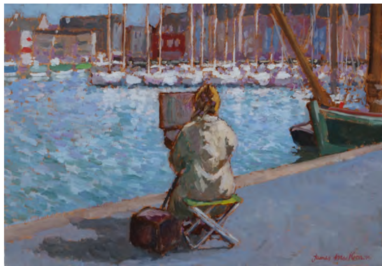
Vue sur le port - 38 x 55 cm