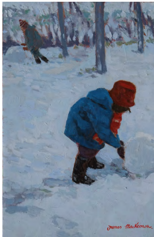
Ça roule - 41 x 27 cm