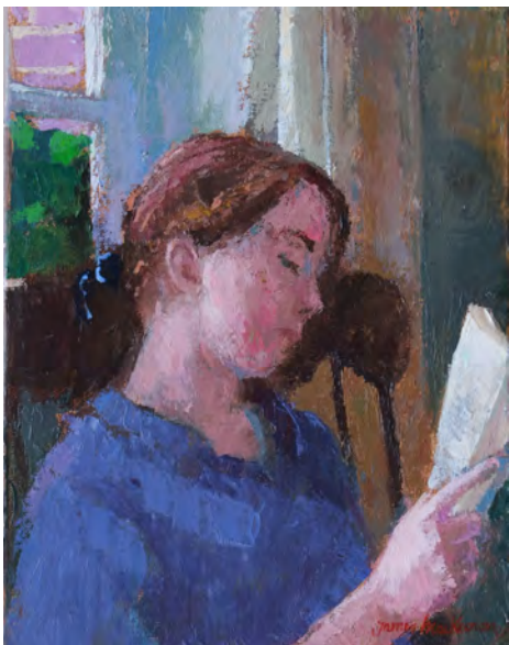
Le petit livre - 35 x 27 cm