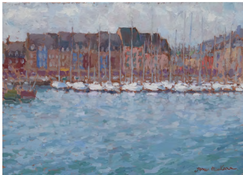
Entre les orages, le port de Paimpol - 33 x 46 cm