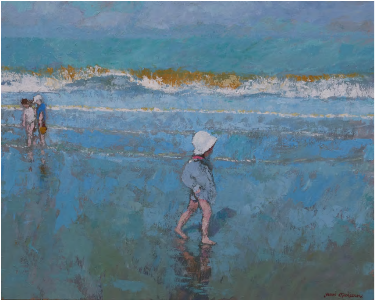
La vague qui tombe - 65 x 81 cm