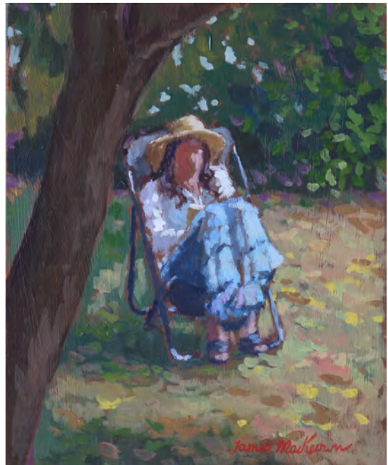
Ci-contre: Dans le jardin - 27 x 22 cm