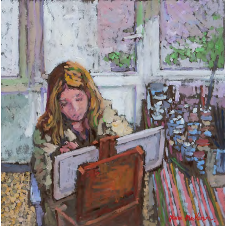
Dans l'atelier - 40 x 40 cm