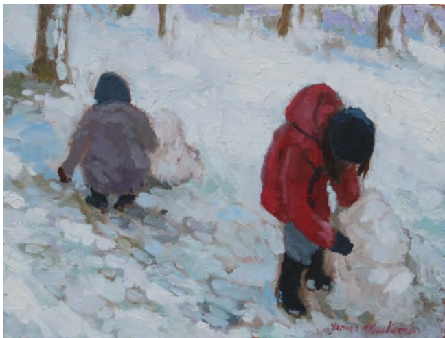
Les deux bonhommes de neige - 27 x 35 cm