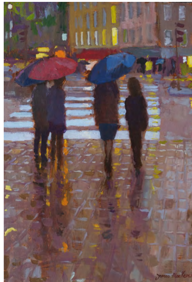
Les parapluies à Paris - 55 x 38 cm