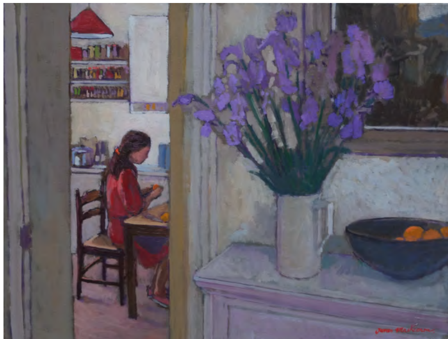
Les oranges - 46 x 61 cm