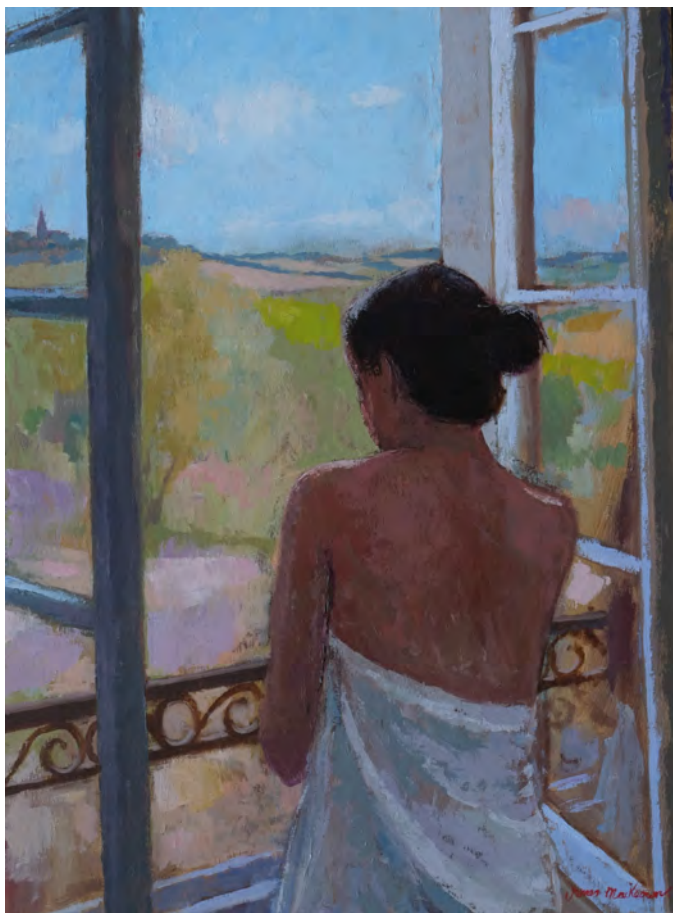
Le matin - 73 x 54 cm