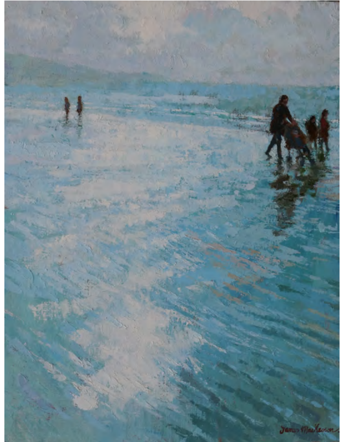
La poussette - 65 x 50 cm