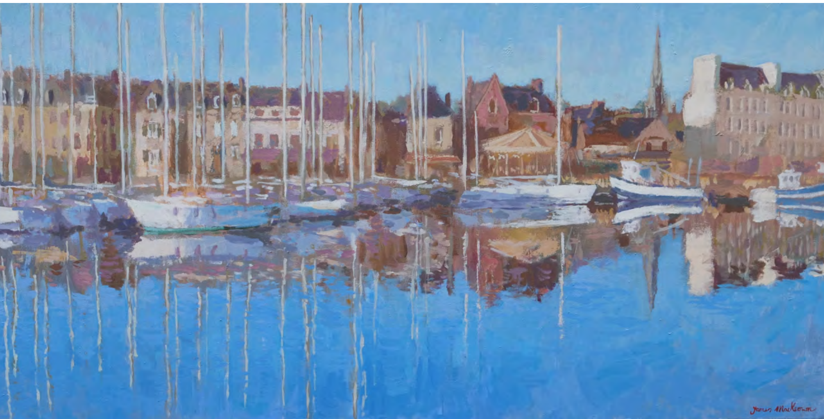
Le silence, tôt le matin - 60 x 120 cm