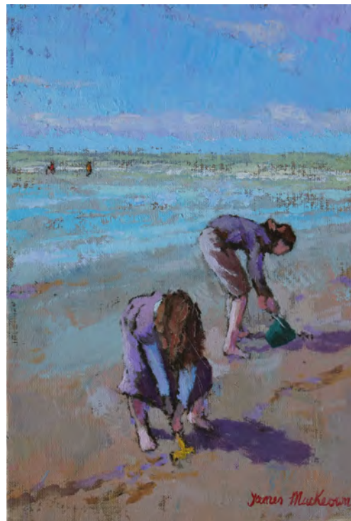
Les deux - 35 x 24 cm