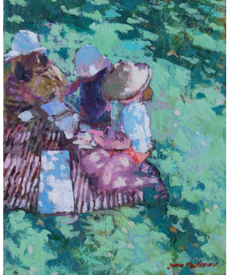
Le pique-nique des livres - 41 x 33 cm