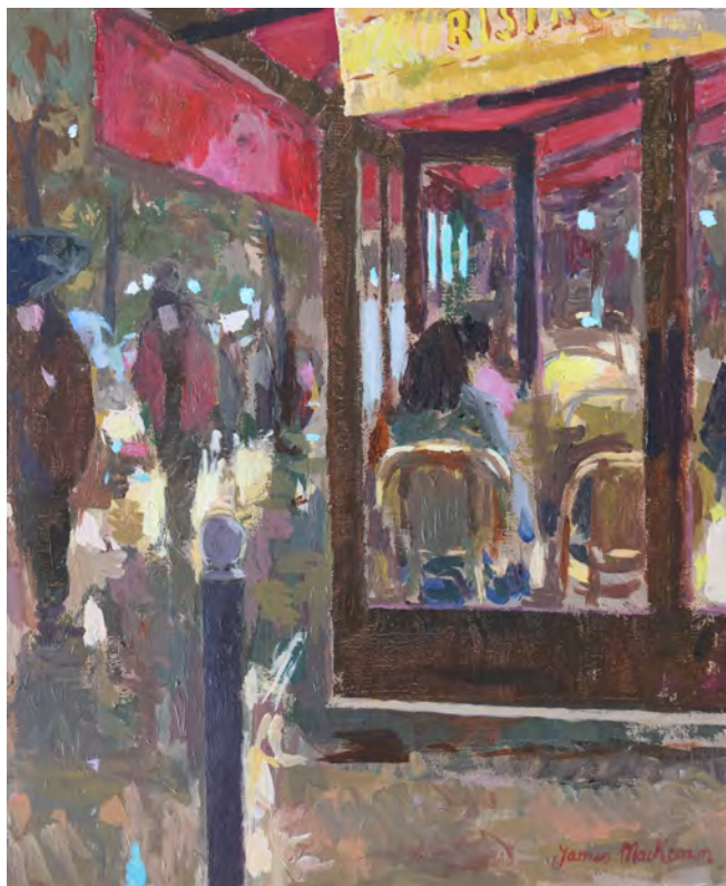
Le bistrot - 46 x 38 cm