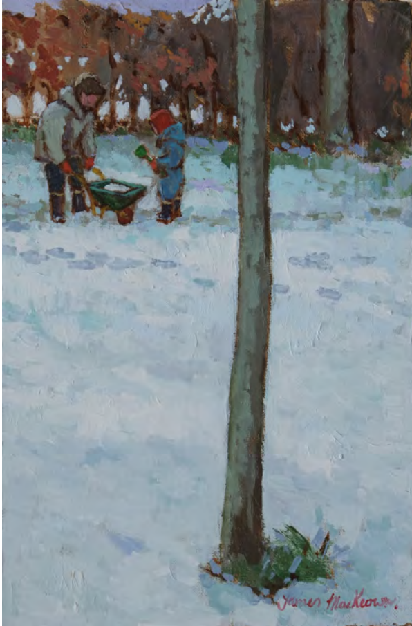
La brouette - 41 x 27 cm