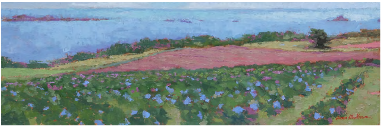
Le champs d'hortensias - 25 x 75 cm