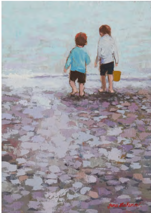
Il y a des galets - 46 x 33 cm