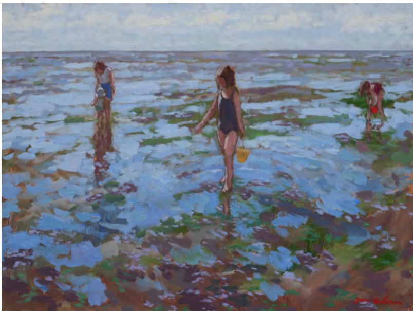
Les deux seaux - 60 x 81 cm