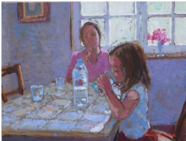
Le verre d'eau - 27 x 35 cm