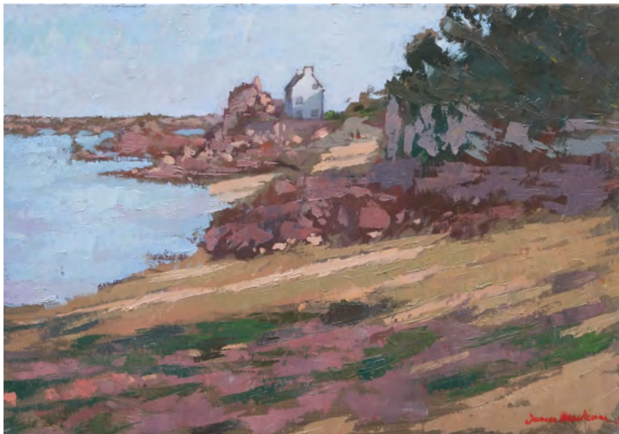
Loguivy en hiver - 38 x 55 cm