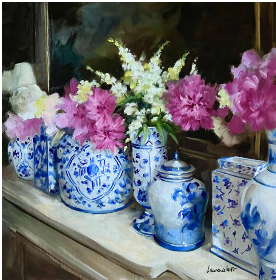
Symphonie de pivoines - 80 x 80 cm