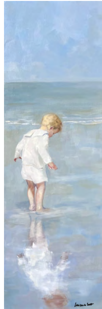
Le reflet 3 - 120 x 40 cm