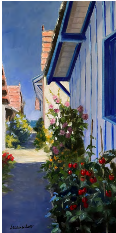
Les tomates de l'Herbe - 80 x 40 cm