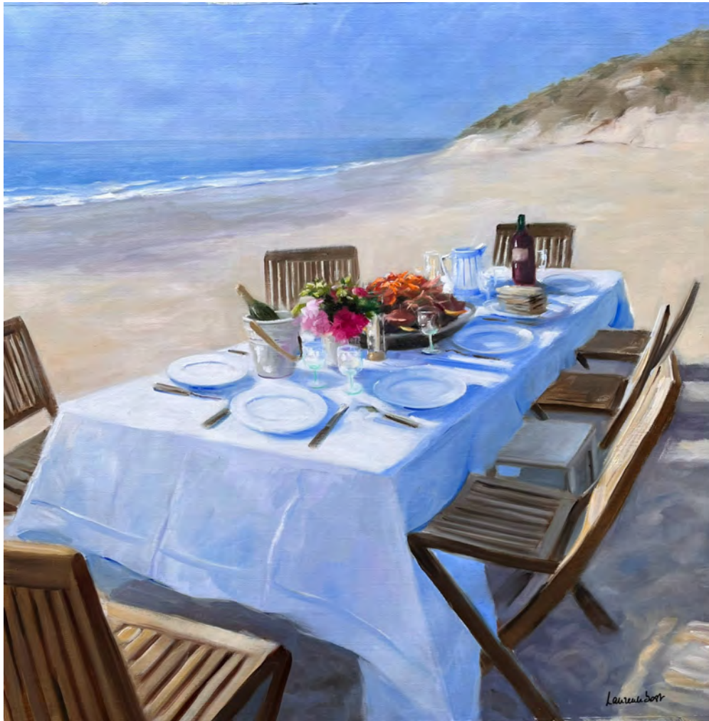
Dîner à l'océan - 90 x 90 cm