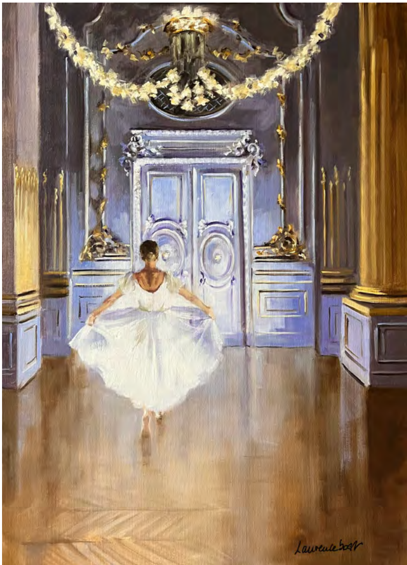
Danser à Orsay - 100 x 73 cm