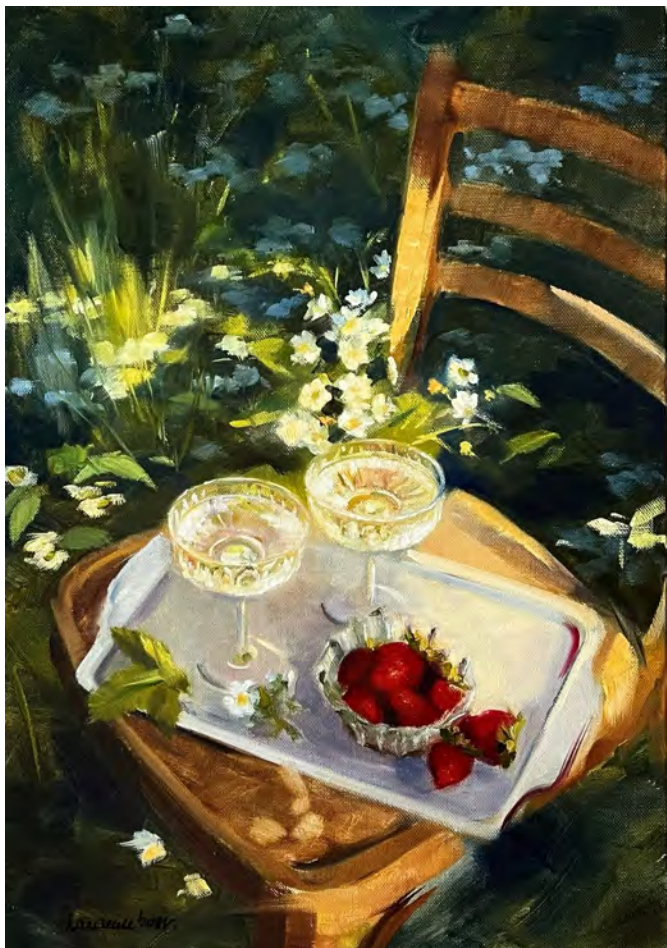
Champagne et fraises 1 - 65 x 46 cm