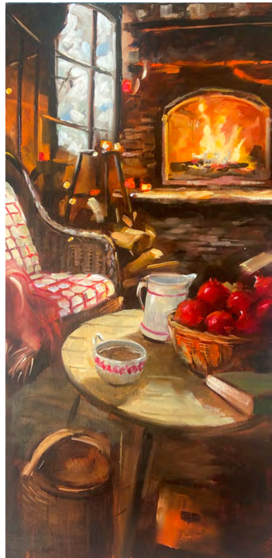
Thé au chalet - 100 x 50 cm