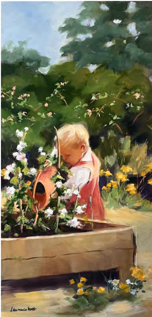
Au potager 1 - 80 x 40 cm