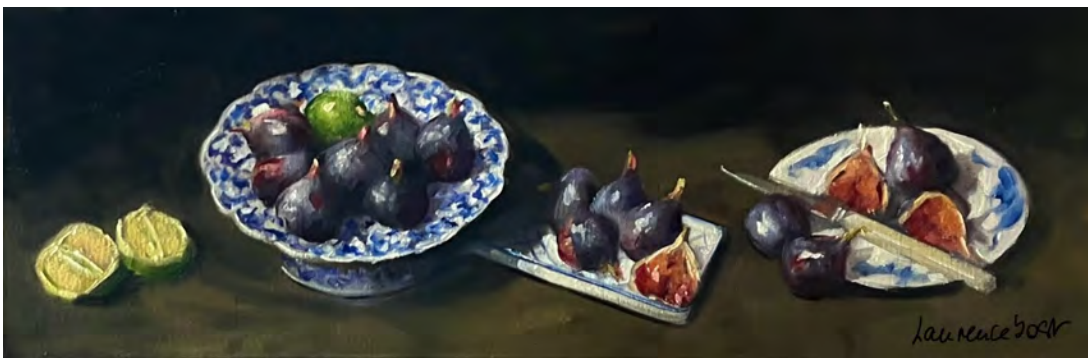
Figs and green lemons 3 30 x 90 cm