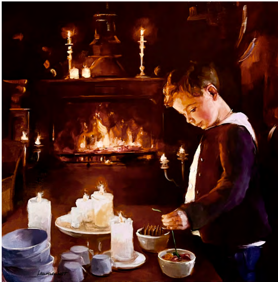
Goûter d'hiver - 80 x 80 cm