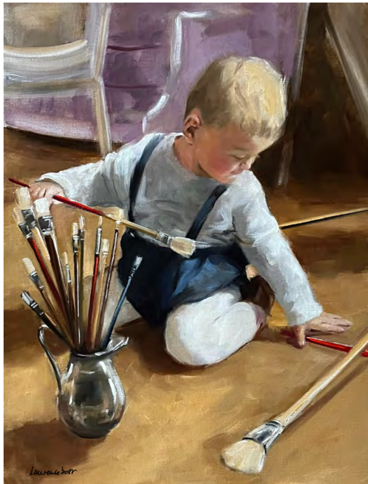
Petit-fils de peintre - 65 x 50 cm