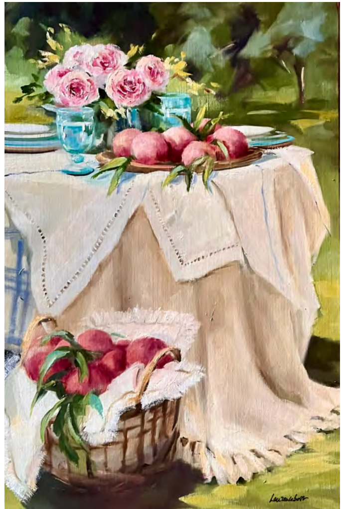
Pêches et roses - 81 x 54 cm