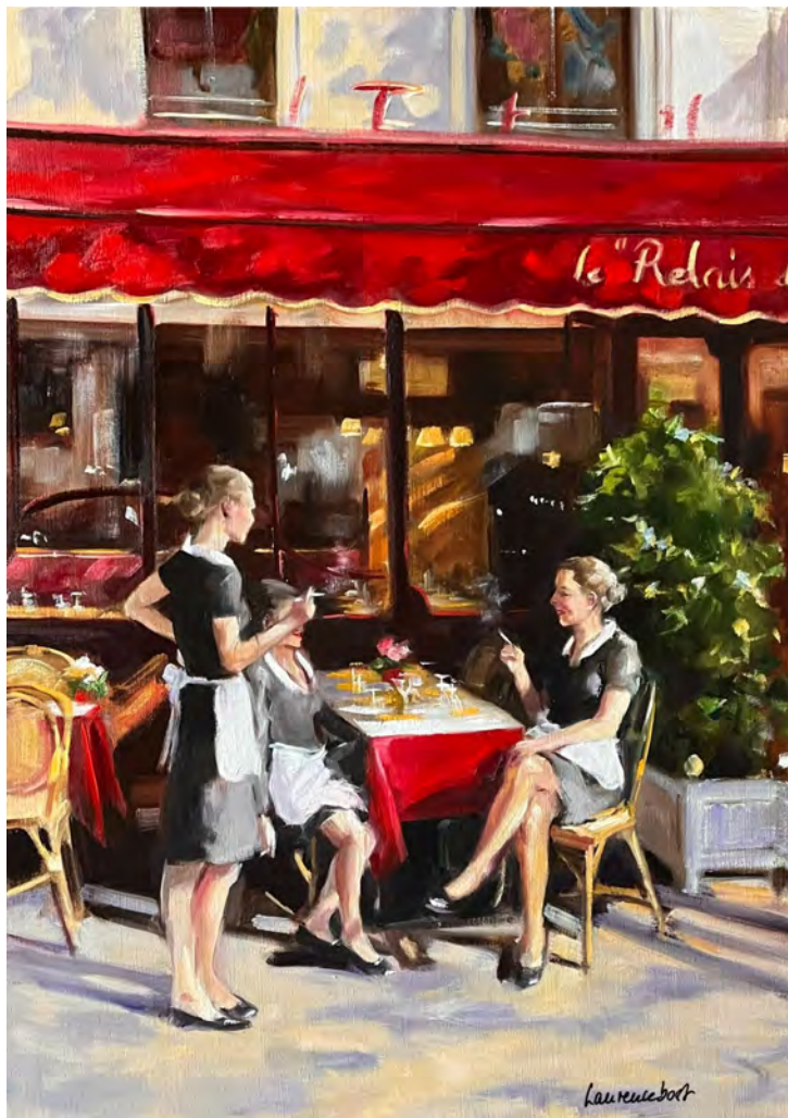
Avant le service, l'Entrecôte - 92 x 65 cm