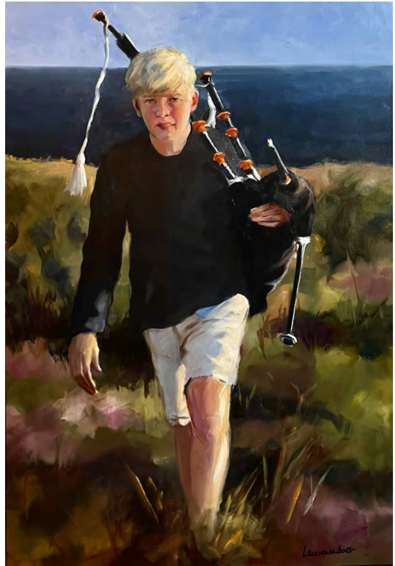
Alexis Tolstoi - 116 x 81 cm