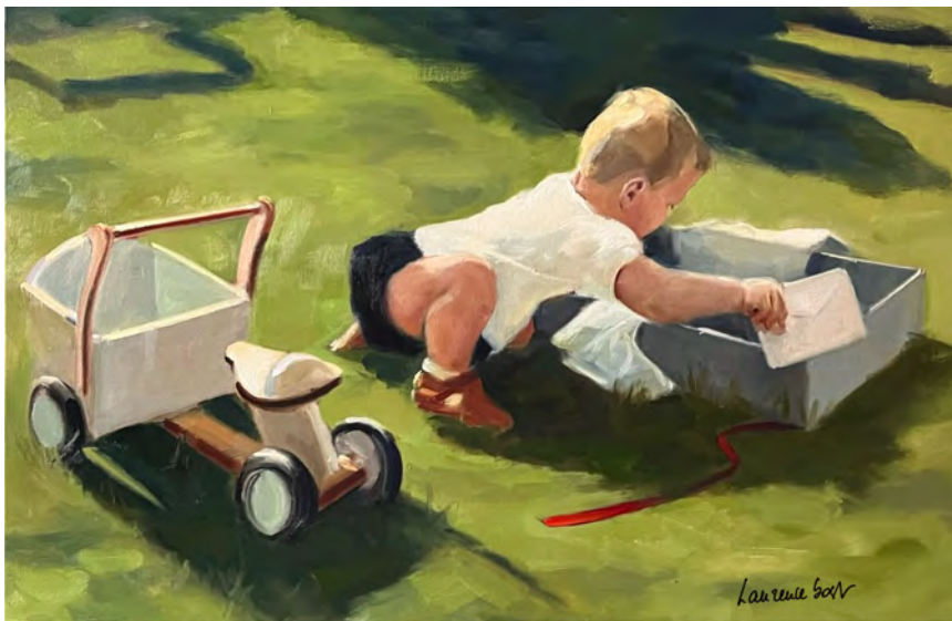
Le tricycle des 1 an - 60 x 92 cm