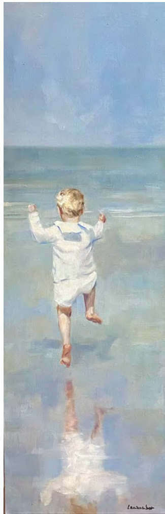
Le reflet 2 - 120 x 40 cm