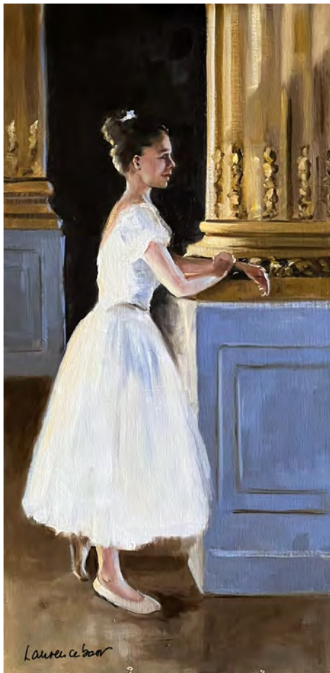
L'attente - 100 x 50 cm