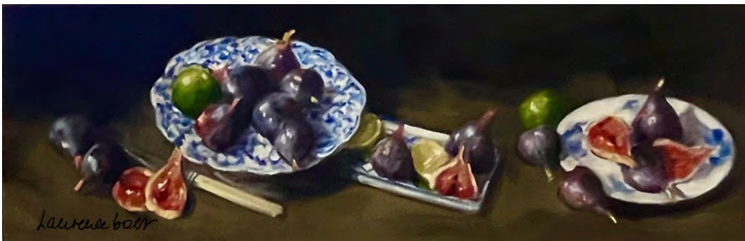
Figs and green lemons 2 30 x 90 cm