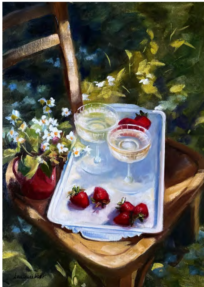
Champagne et fraises 2 - 65 x 46 cm