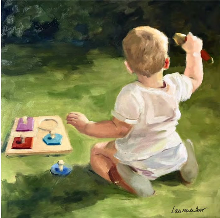
Joseph et son gros lot - 60 x 60 cm