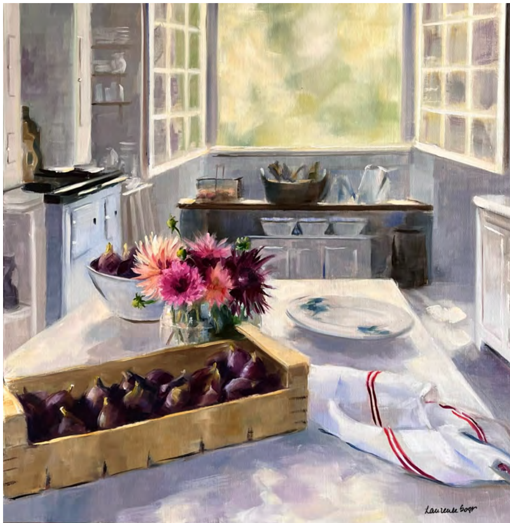
Figues et dahlias - 90 x 90 cm