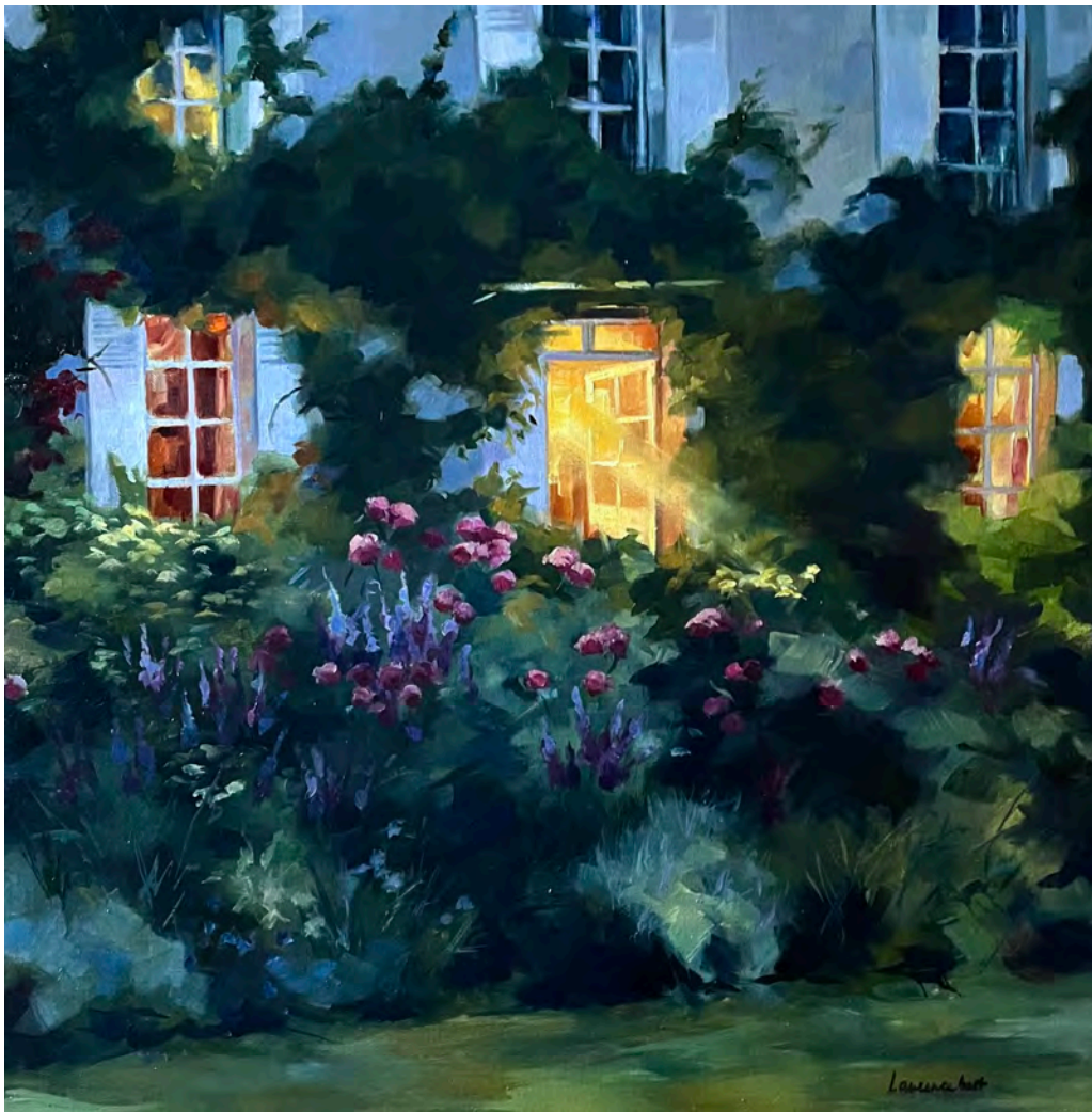
Le rayon anglais - 90 x 90 cm