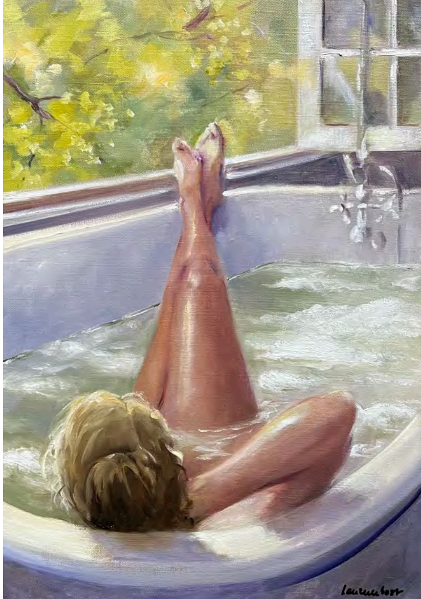
Le bain - 65 x 46 cm