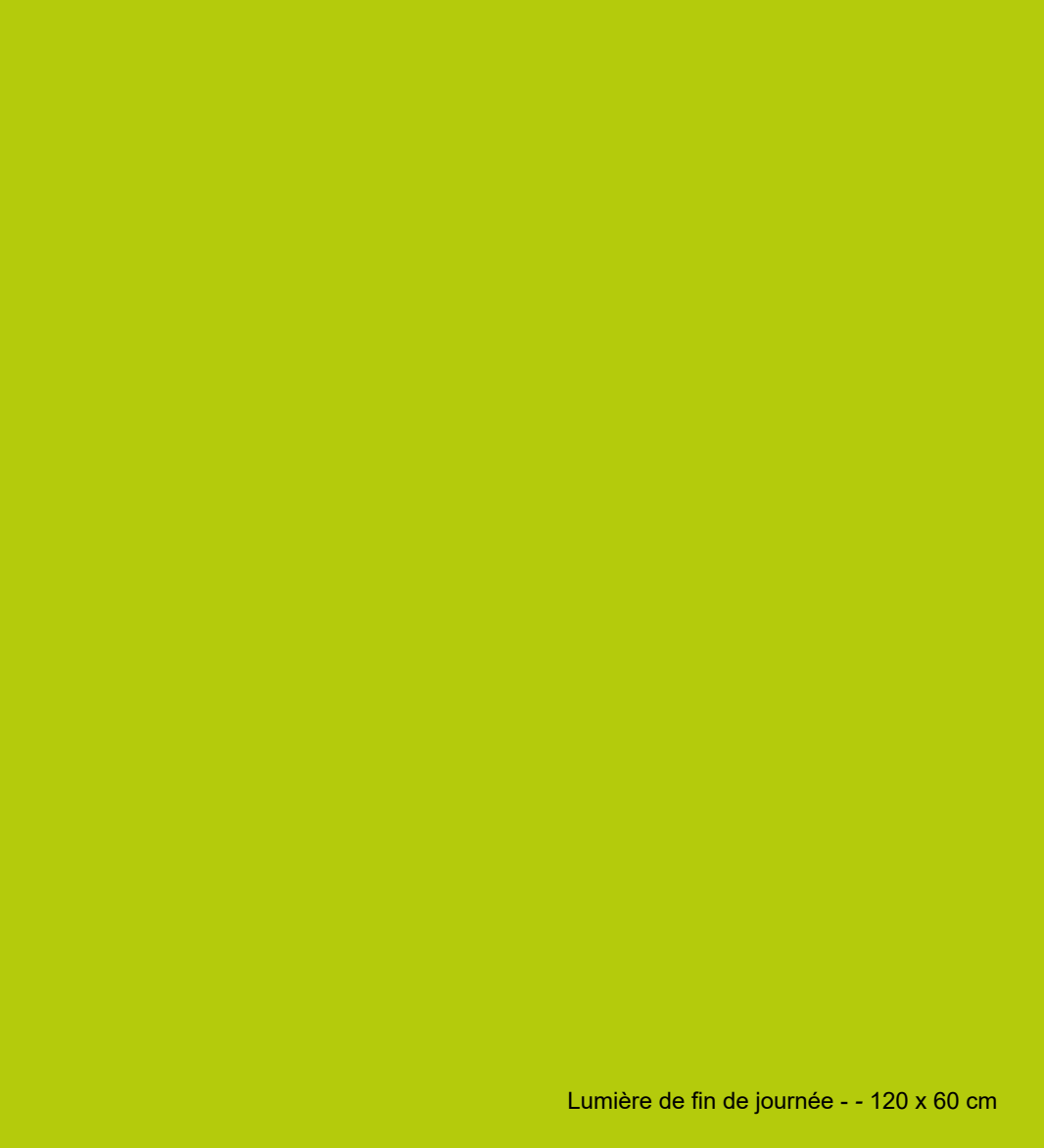
Lumière de fin de journée - - 120 x 60 cm