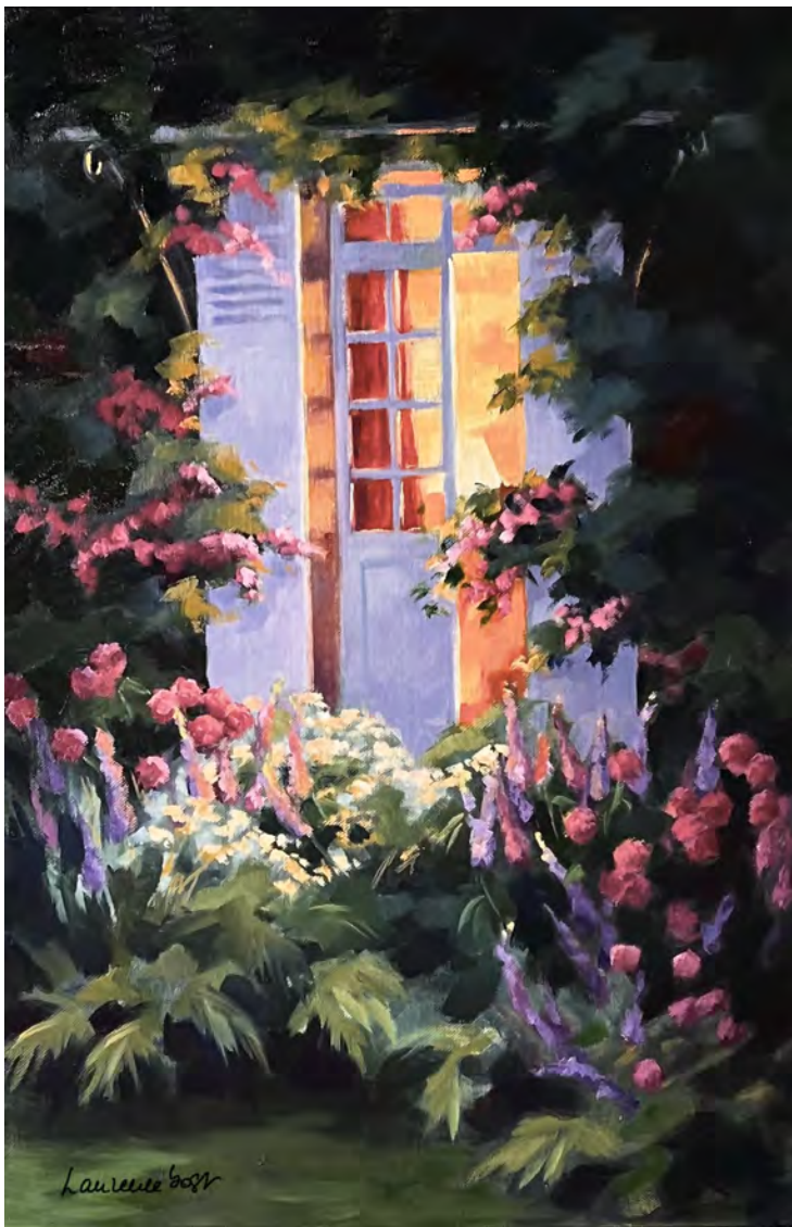
La porte bleue - 73 x 54 cm