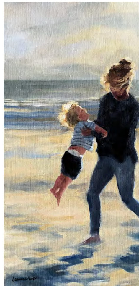
A la deux - 80 x 40 cm