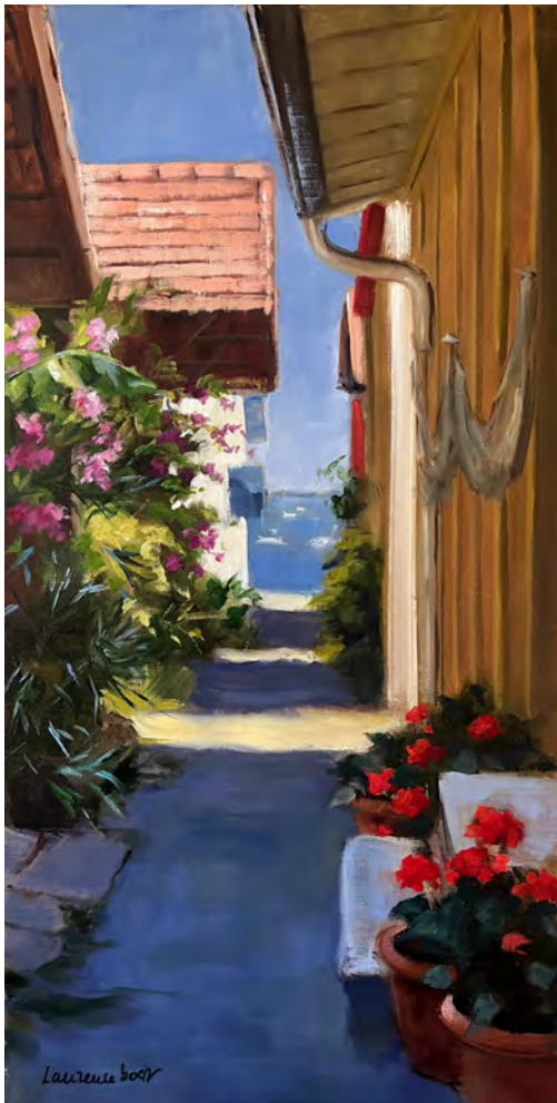
Ruelle de l'Herbe - 80 x 40 cm