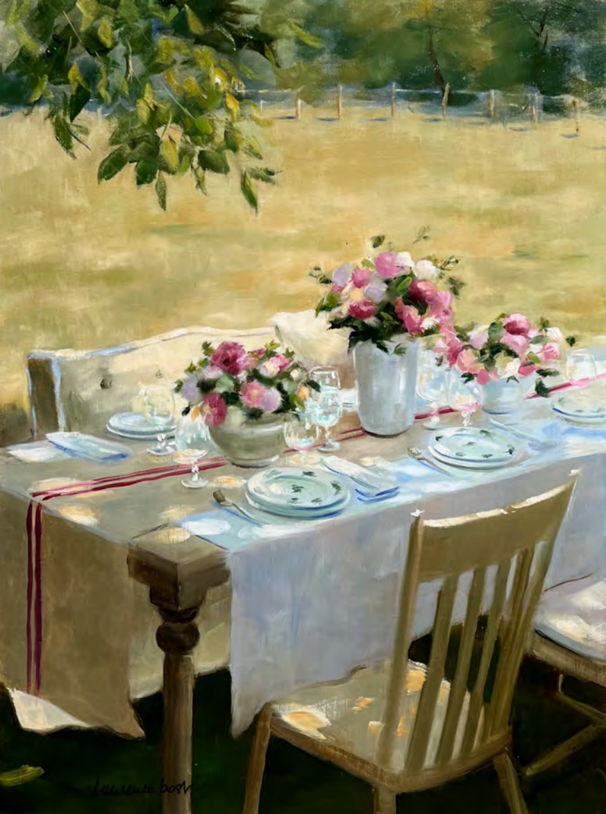
Déjeuner à la campagne - 100 x 73 cm