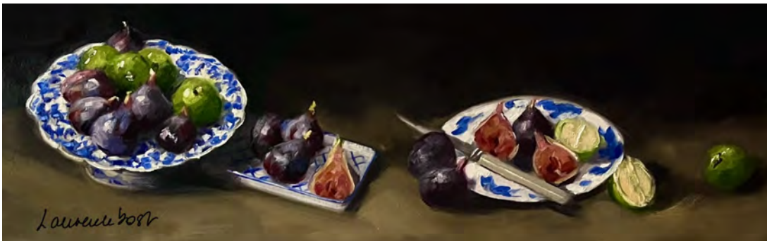
Figs and green lemons 1 30 x 90 cm