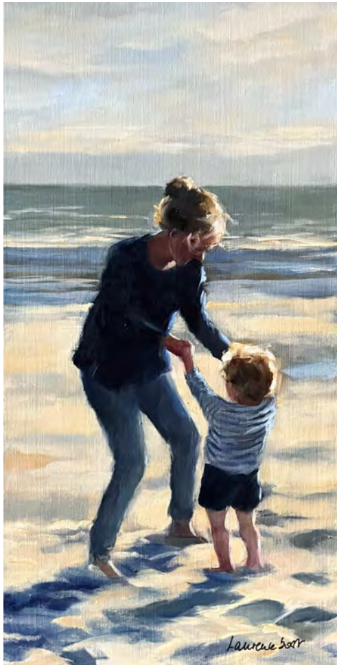
A la une - 80 x 40 cm