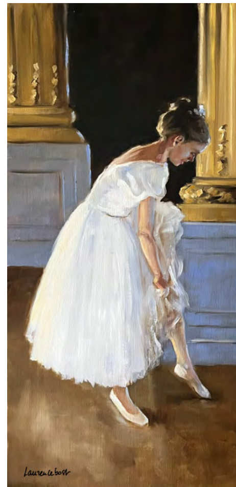
Avant d'aller danser - 100 x 50 cm