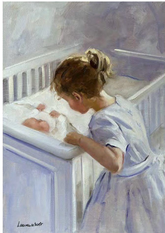
Douce attention - 65 x 46 cm