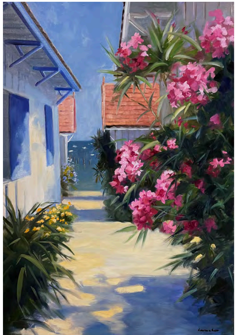
Lauriers roses à l'Herbe - 116 x 81 cm