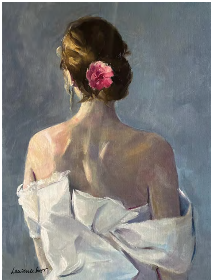
Camélia - 65 x 50 cm