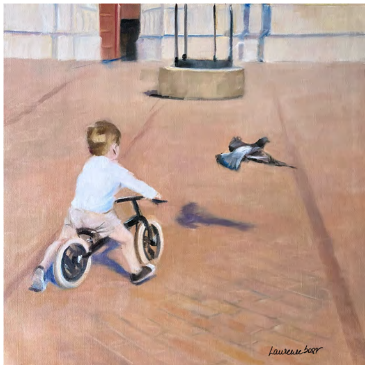
L'envol du pigeon - 60 x 60 cm