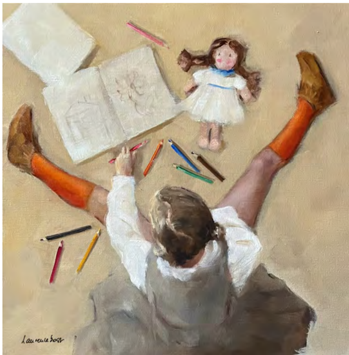
Coloriage - 60 x 60 cm