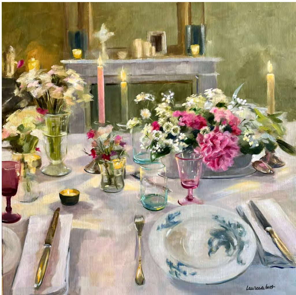
Repas de fête - 90 x 90 cm