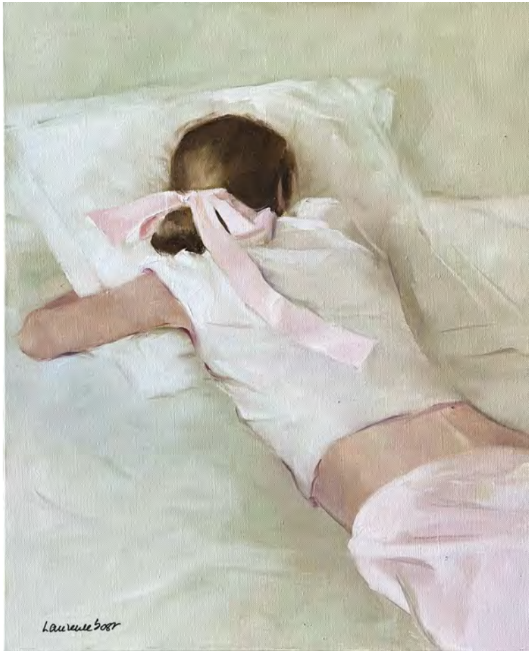
Le ruban rose - 73 x 60 cm