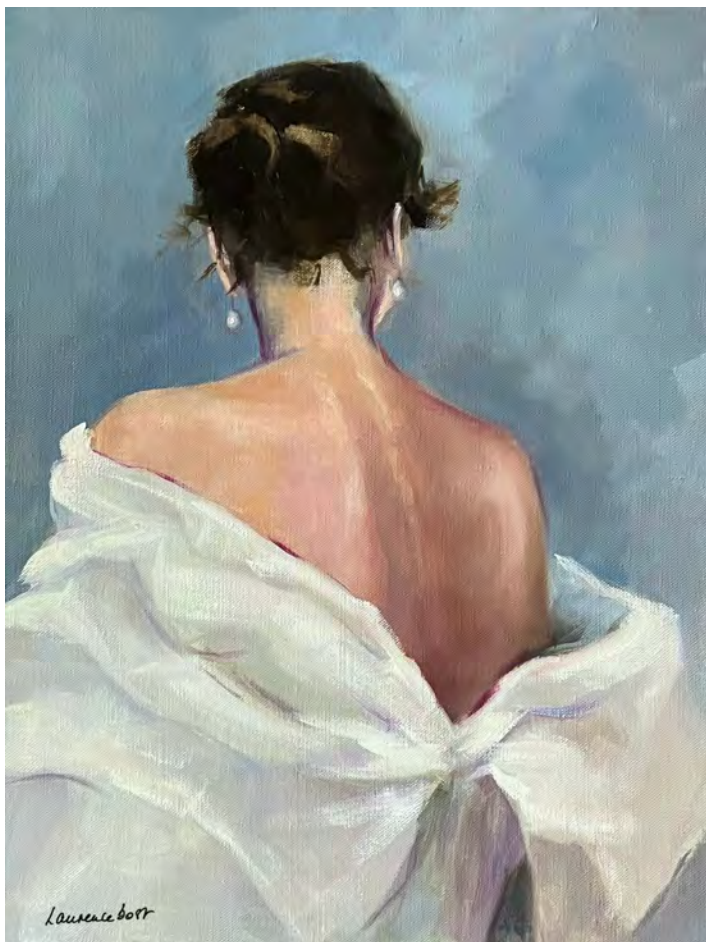
Organza - 65 x 50 cm