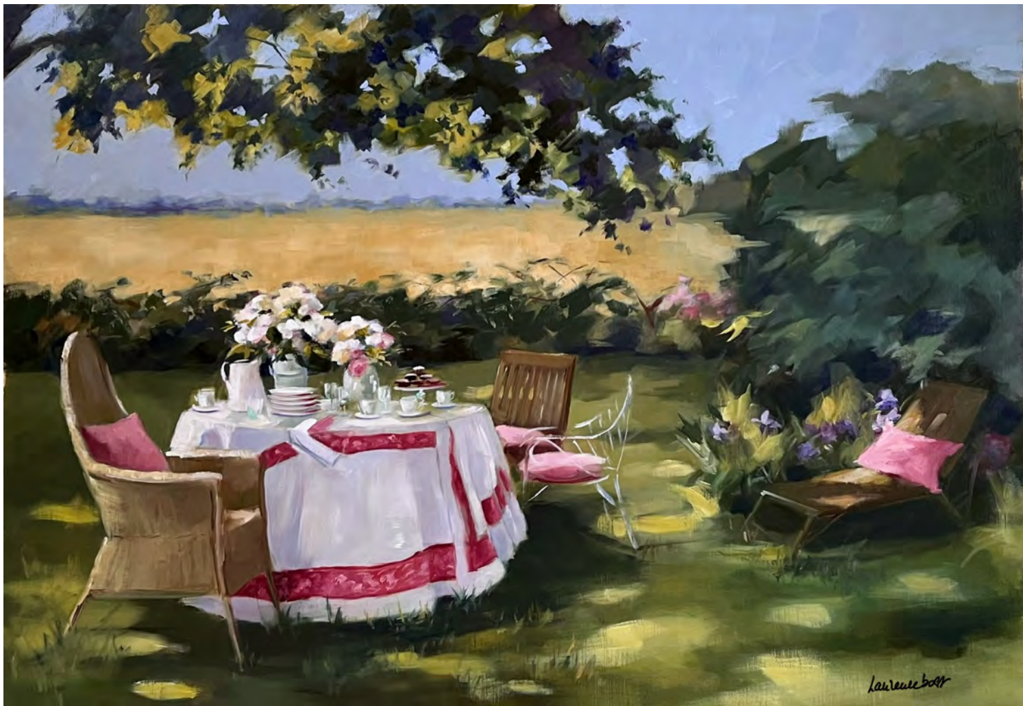
Goûter à la campagne - 81 x 116 cm