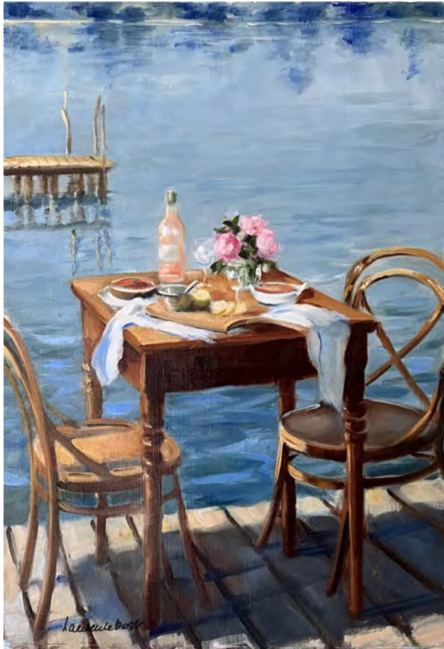
Rosé au fil de l'eau - 65 x 46 cm