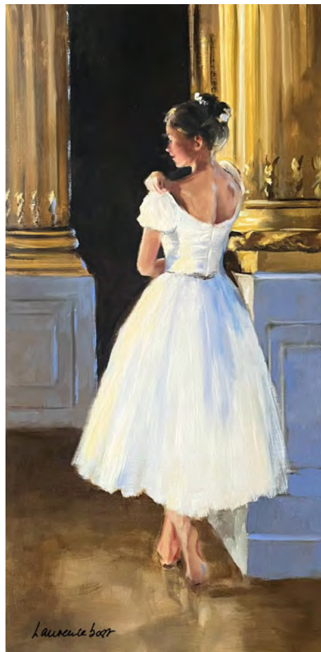
L'épaule - 100 x 50 cm