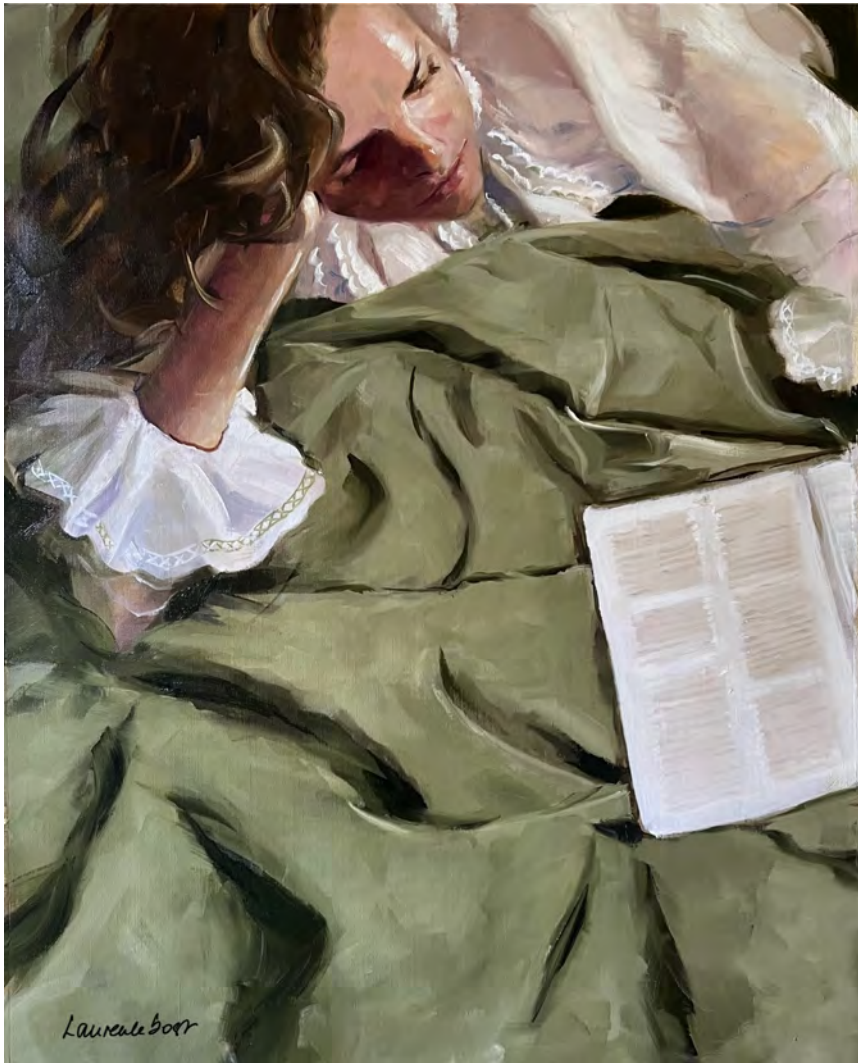
Les draps verts - 92 x 73 cm