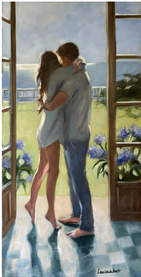
Réveil amoureux - 80 x 40 cm