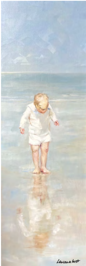
Le reflet 1 - 120 x 40 cm