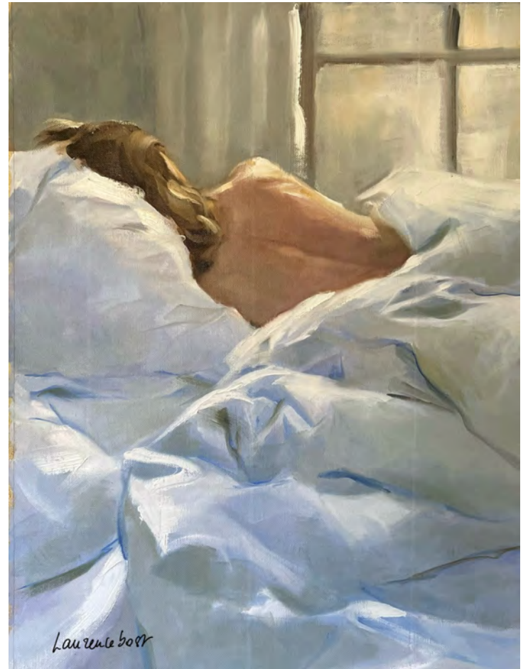
Les draps bleus - 73 x 54 cm