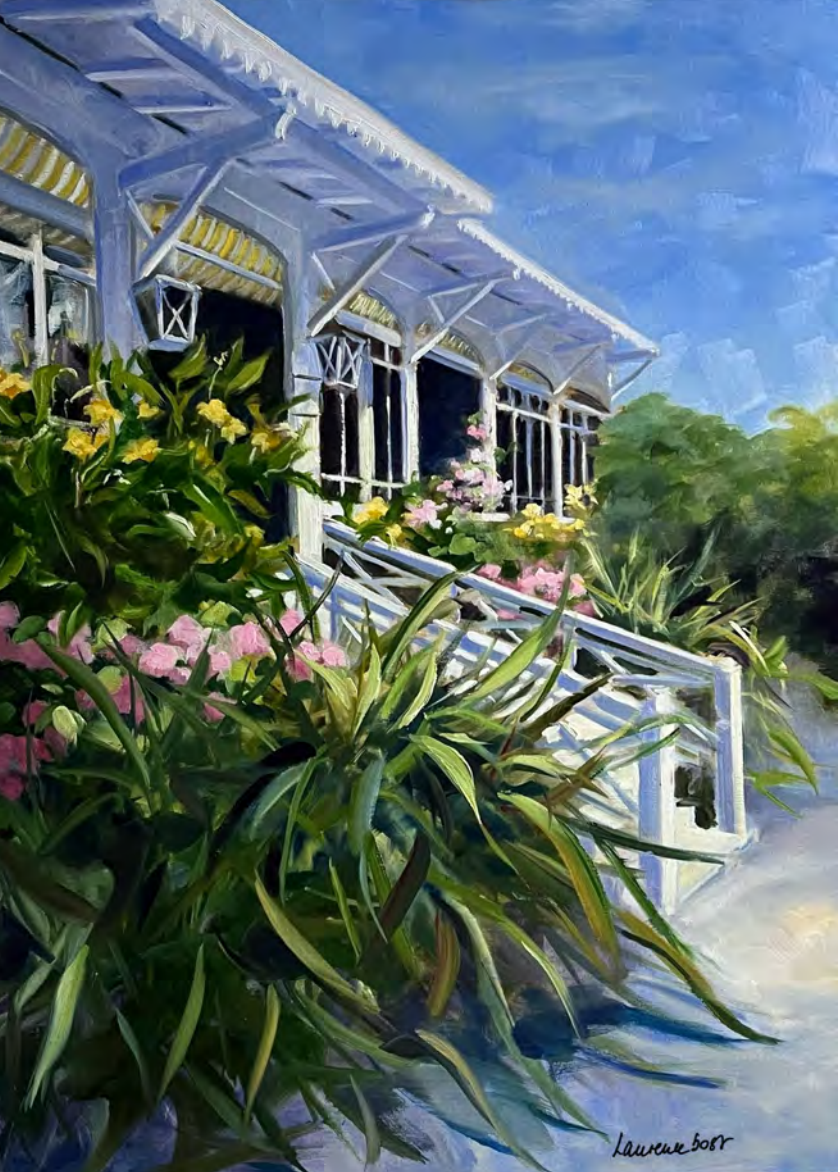
L'hôtel des Pins - 100 x 73 cm