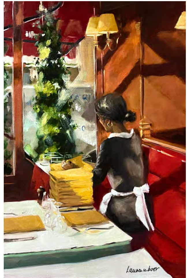
Les serviettes, l'Entrecôte - 81 x 54 cm