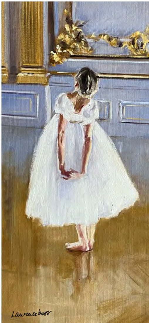
La petite danseuse de Degas - 60 x 30 cm