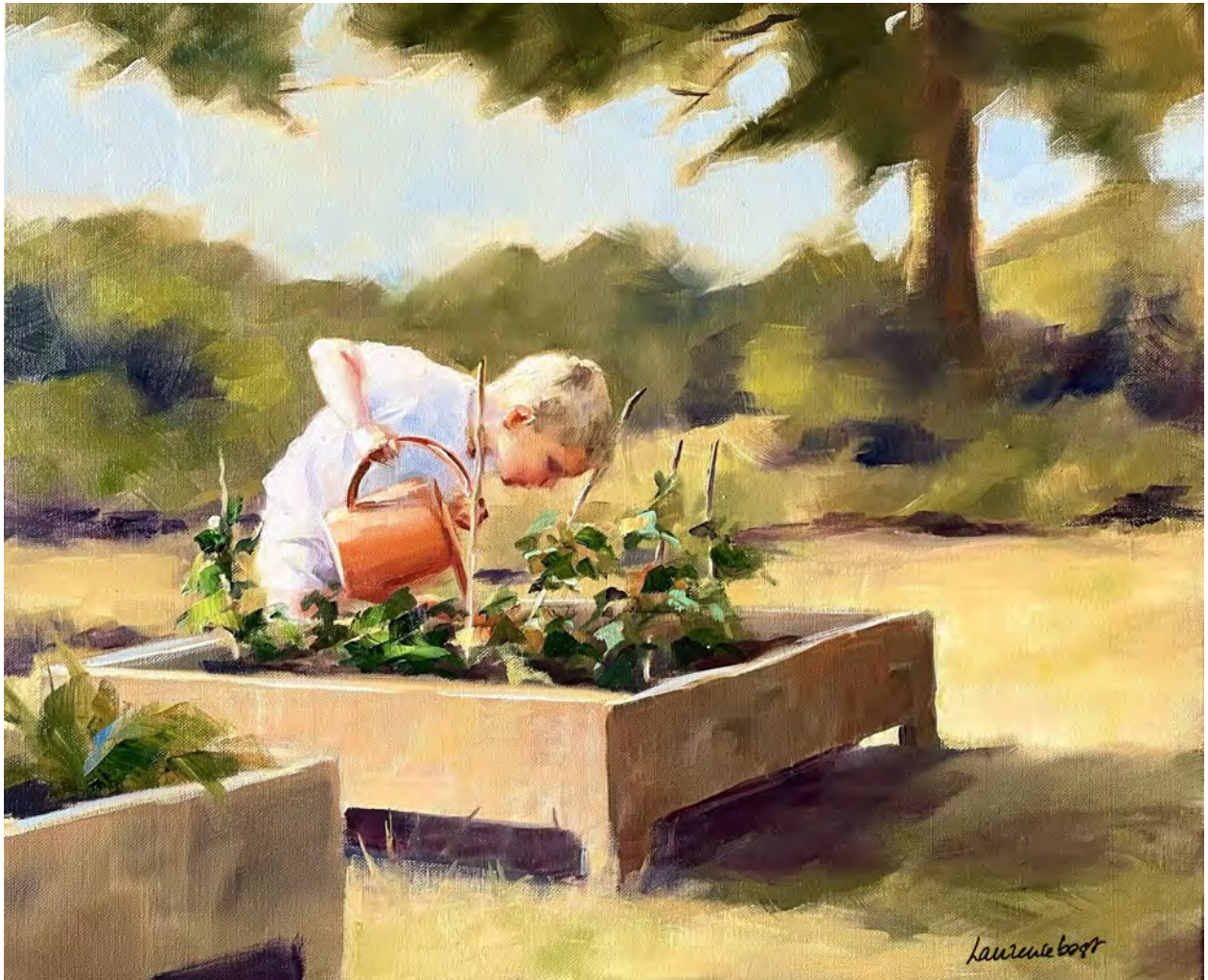
Au potager 3 - 60 x 73 cm