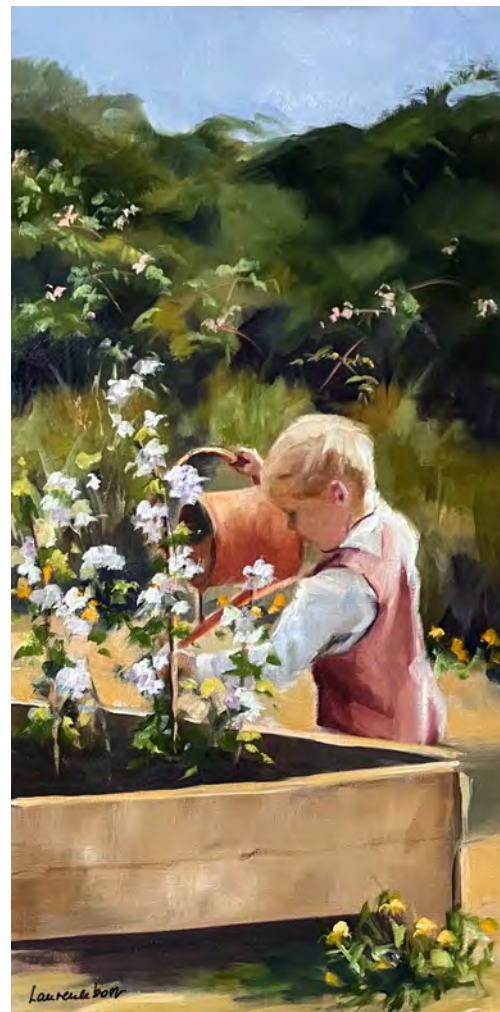
Au potager 2 - 80 x 40 cm