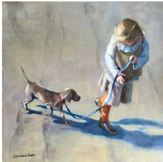
La promenade du chien - 70 x 70 cm