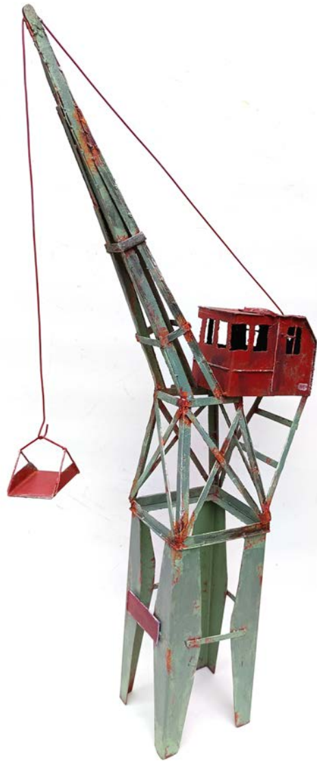
GRUE PORTUAIRE - 120 x 19 x 52 cm