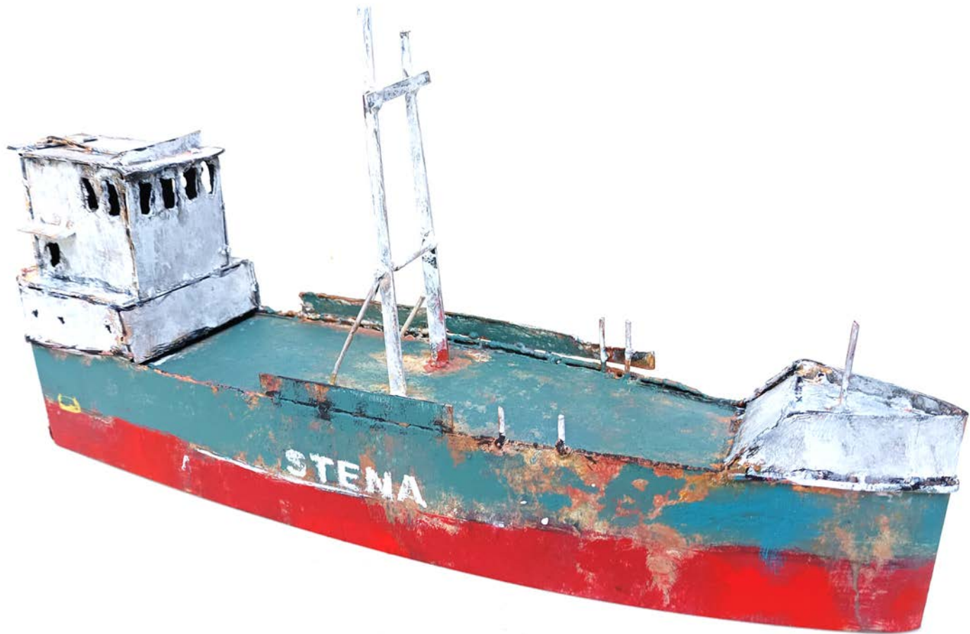
STENA - 25 x 50 x 12 cm