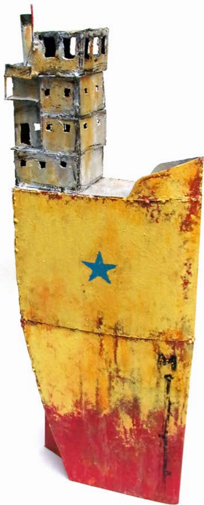
BATHAUT JAUNE - 72 x 25 x 10 cm