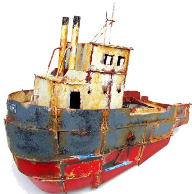
POUPE GRISE ET ROUGE - 32 x 38 x 18 cm