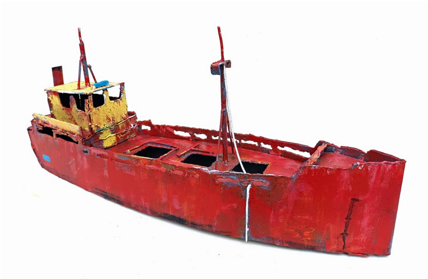
HARENGUIER ROUGE - 23 x 50 x 13 cm