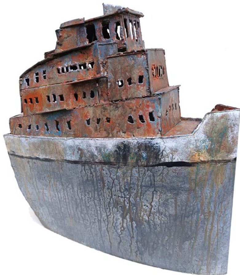
BP001 - 44 x 40 x 16 cm