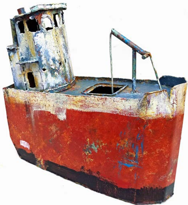
CABOTEUR ROUGE - 31 x 33 x 12 cm