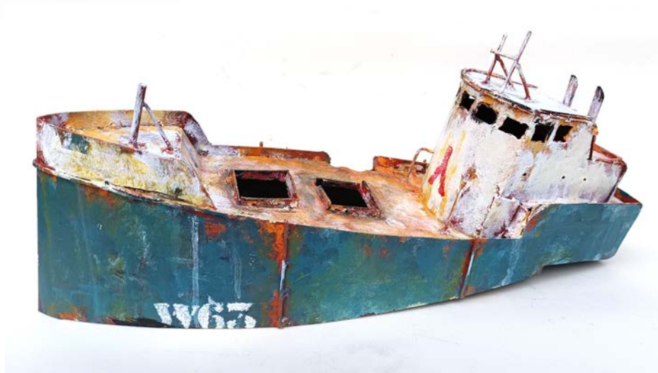
BATEAU W63 - 22 x 50 x 15 cm