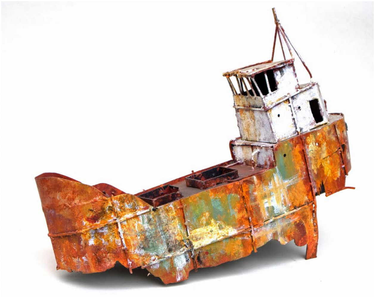
EPAVE DU SALT - 33 x 45 x 13 cm