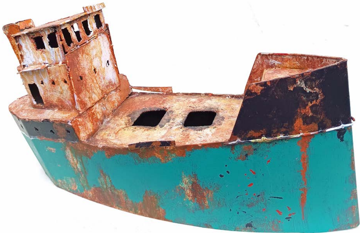
CARGO PLATON - 27 x 48 x 15 cm