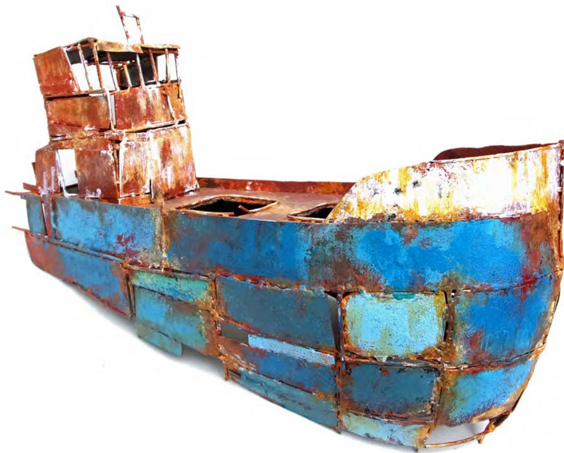
EPAVE BLEUE - 26 x 50 x 17 cm