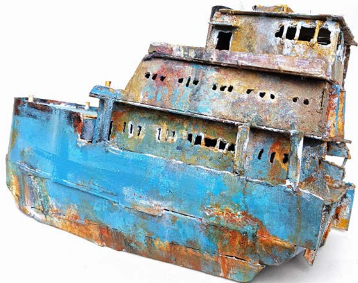
POUPE LEVY - 46 x 29 x 15 cm