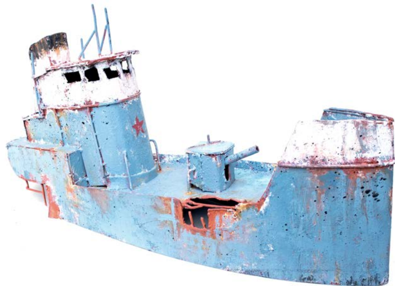
STRB WAR - 26 x 50 x 14 cm