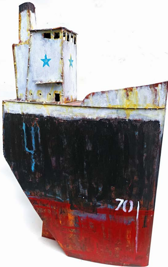
ONCLE WALT - 79 x 50 x 13 cm