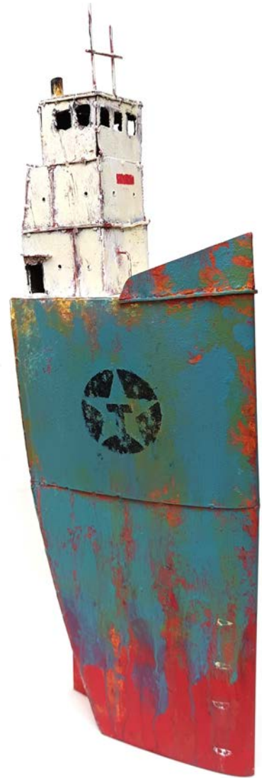
TEXAC'HAUT - 76 x 25 x 12cm