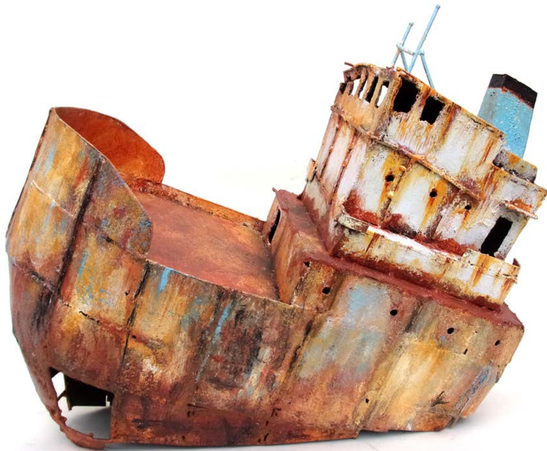
LE BALIDAR - 35 x 40 x 18 cm