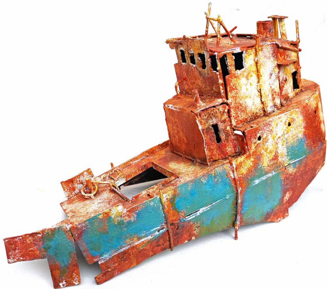
POUPE BLEUE - 25 x 45 x 14 cm