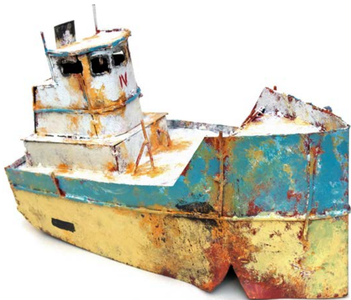
BATO IV - 23 x 35 x 14 cm