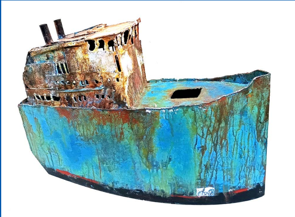
BP003 - 34 x 50 x 16 cm