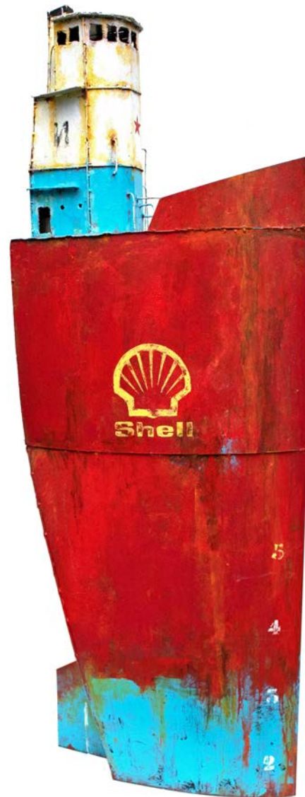
BATHAUT SHELL RED - 140 x 50 x 20 cm