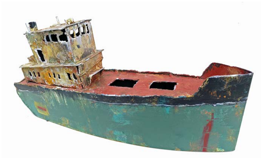
CARGO ALBERT - 18 x 40 x 10 cm