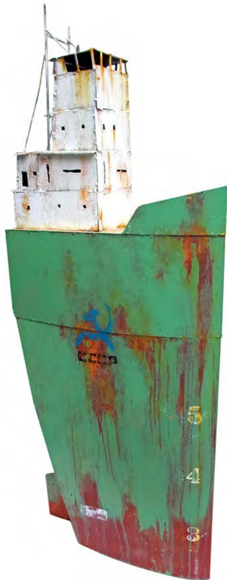
CARGO CCCP VERT -132 x 50 x 19 cm