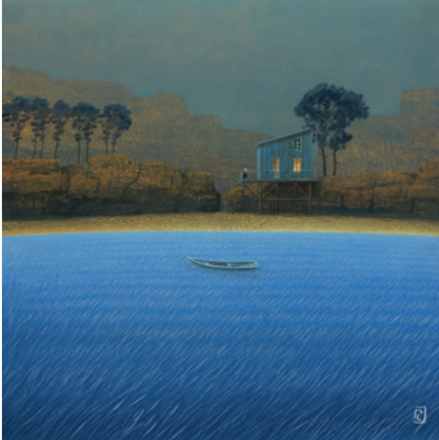
Une riveraine - 60 x 60 cm