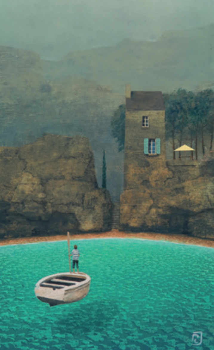
Retour - 50 x 30 cm