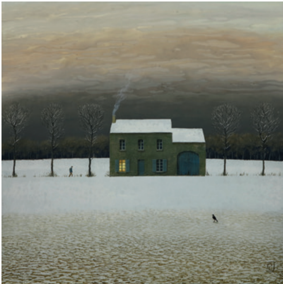
Retour d'école - 60 x 60 cm