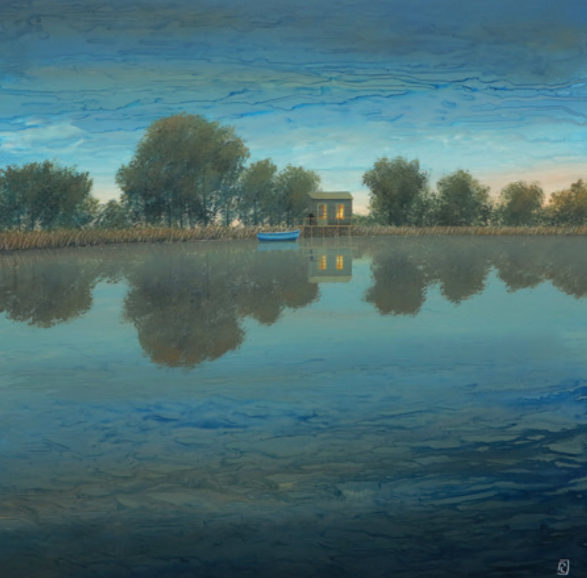
Un soir tranquille - 90 x 90 cm