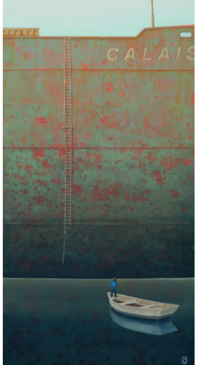
Le Calais - 120 x 60 cm