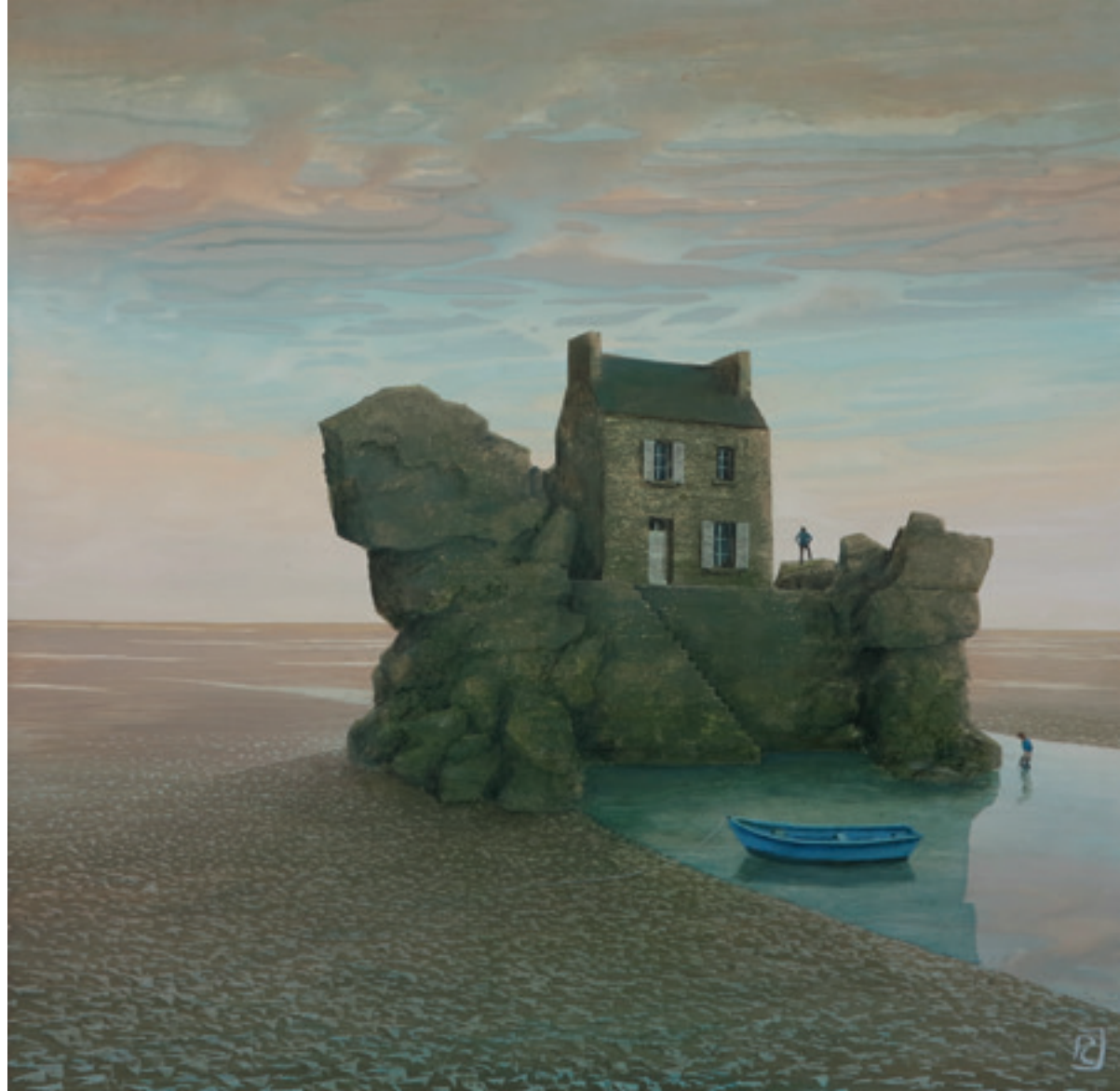
Le prix de la liberté - 60 x 60 cm