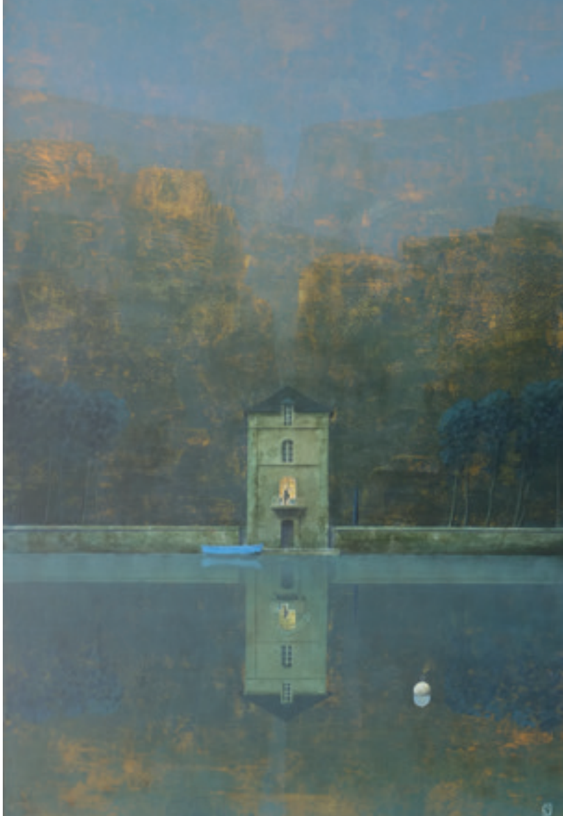
Reviens la nuit - 150 x 100 cm