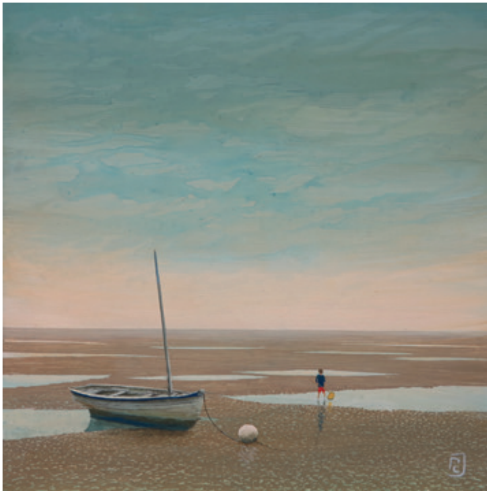
Pêche à pied - 40 x 40 cm