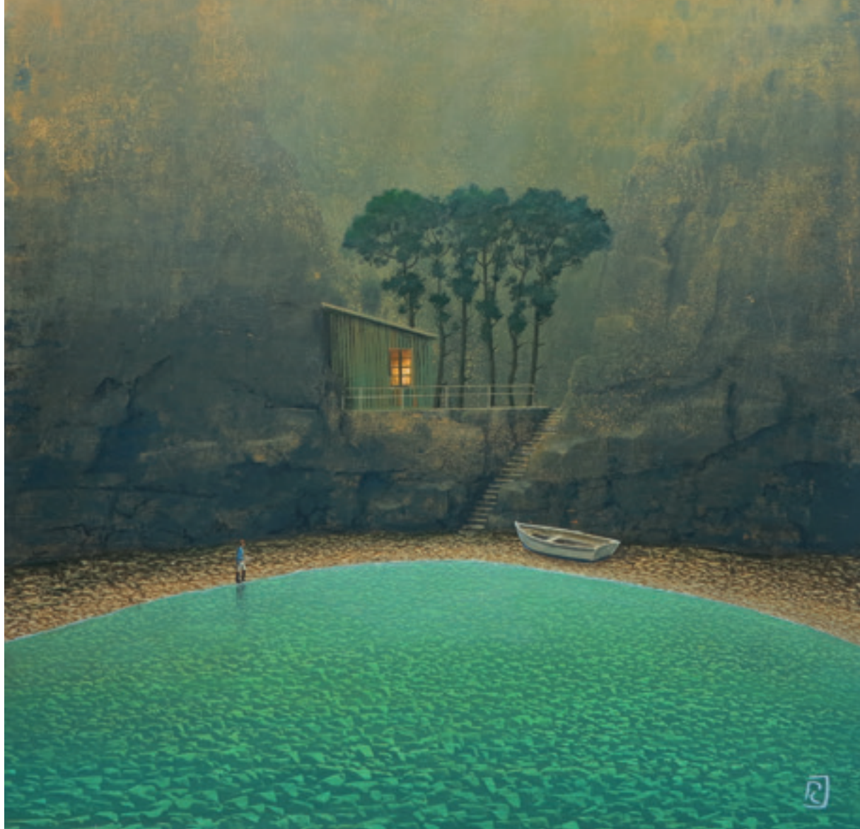
Le soir - 60 x 60 cm