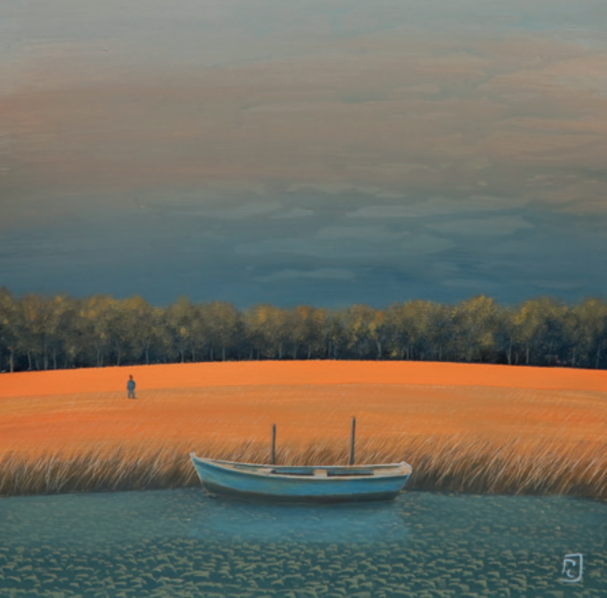
Fin d'été - 40 x 40 cm