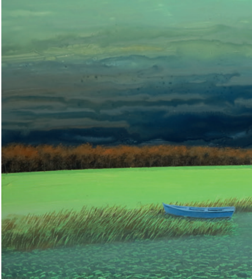
Le soleil après la pluie - 32 x 80 cm