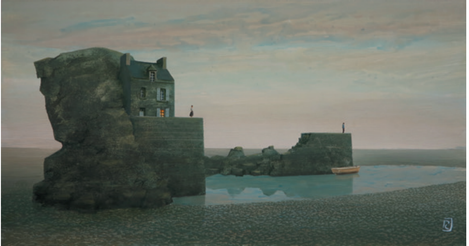
Dérive - 42 x 80 cm