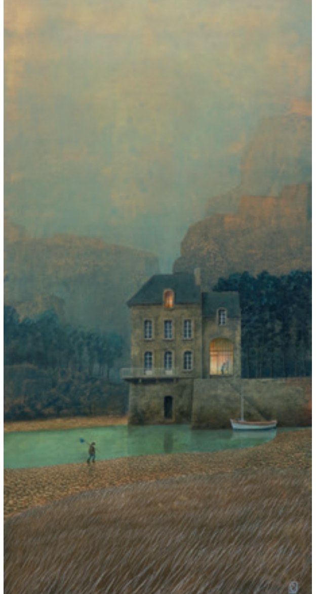
19h45 - 120 x 60 cm