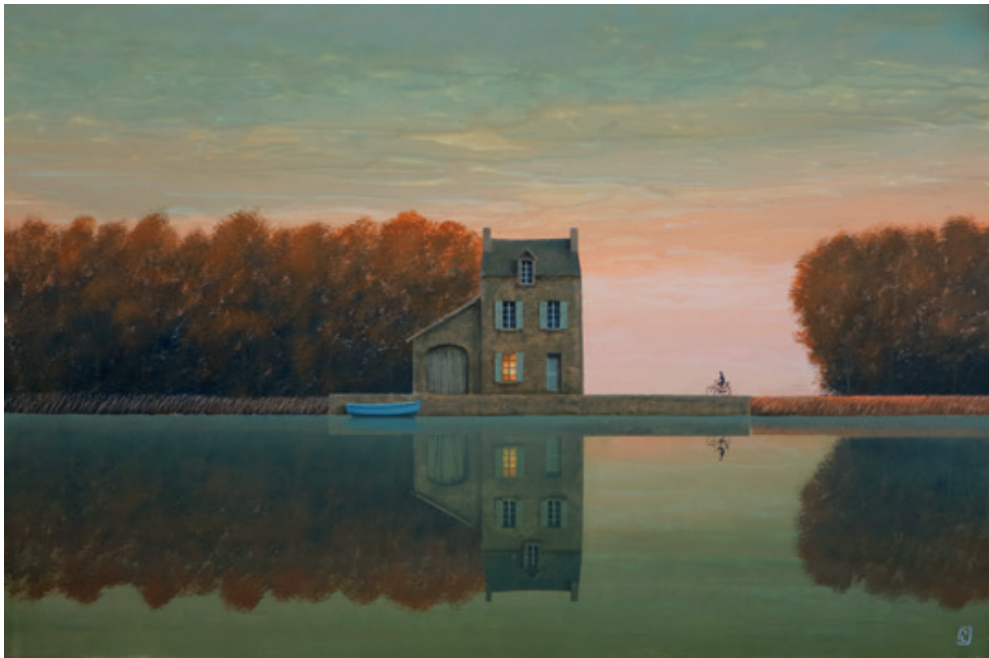
Lumière du soir - 80 x 120 cm