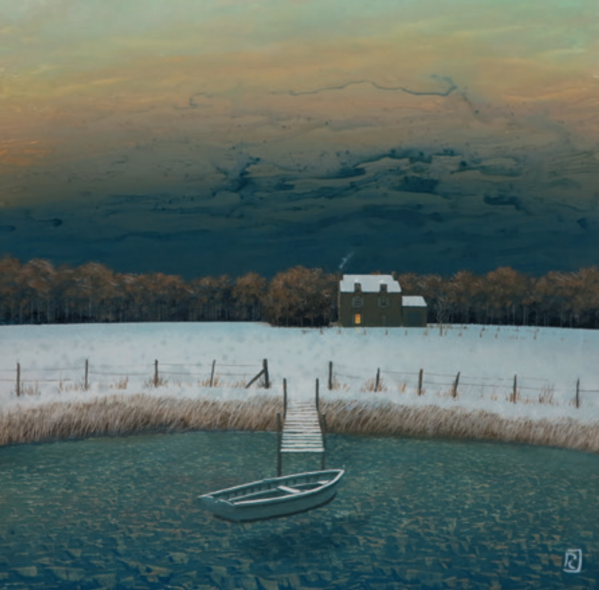
Un soir d'hiver - 60 x 60 cm