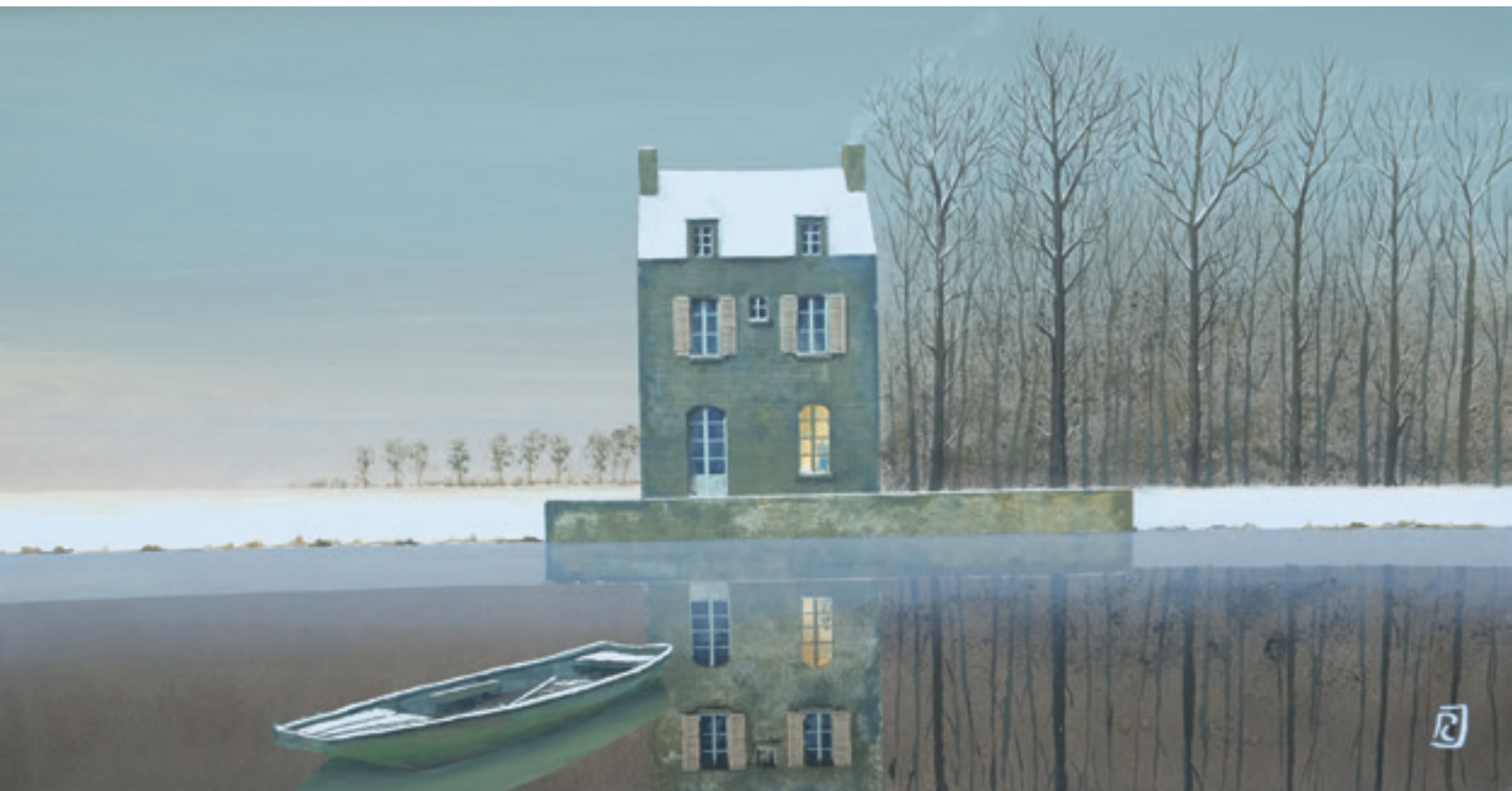
Un soir de janvier - 42 x 80 cm