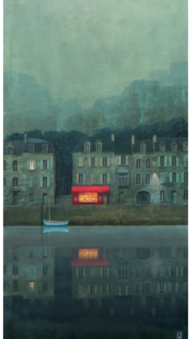
Le café du port - 122 x 63 cm