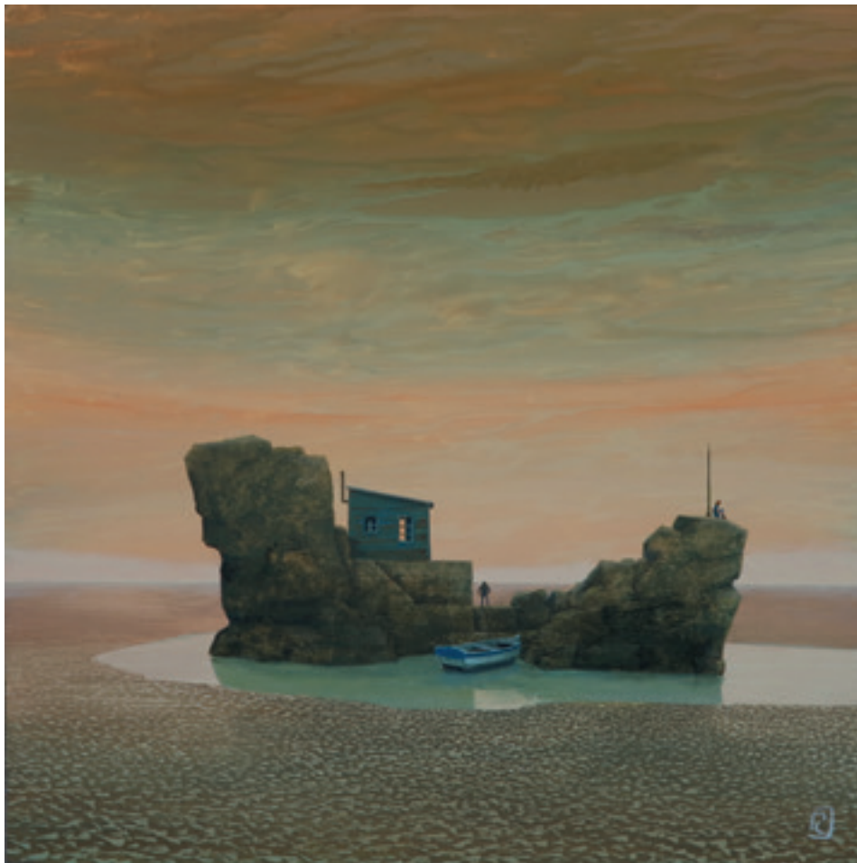
Les reclus - 60 x 60 cm