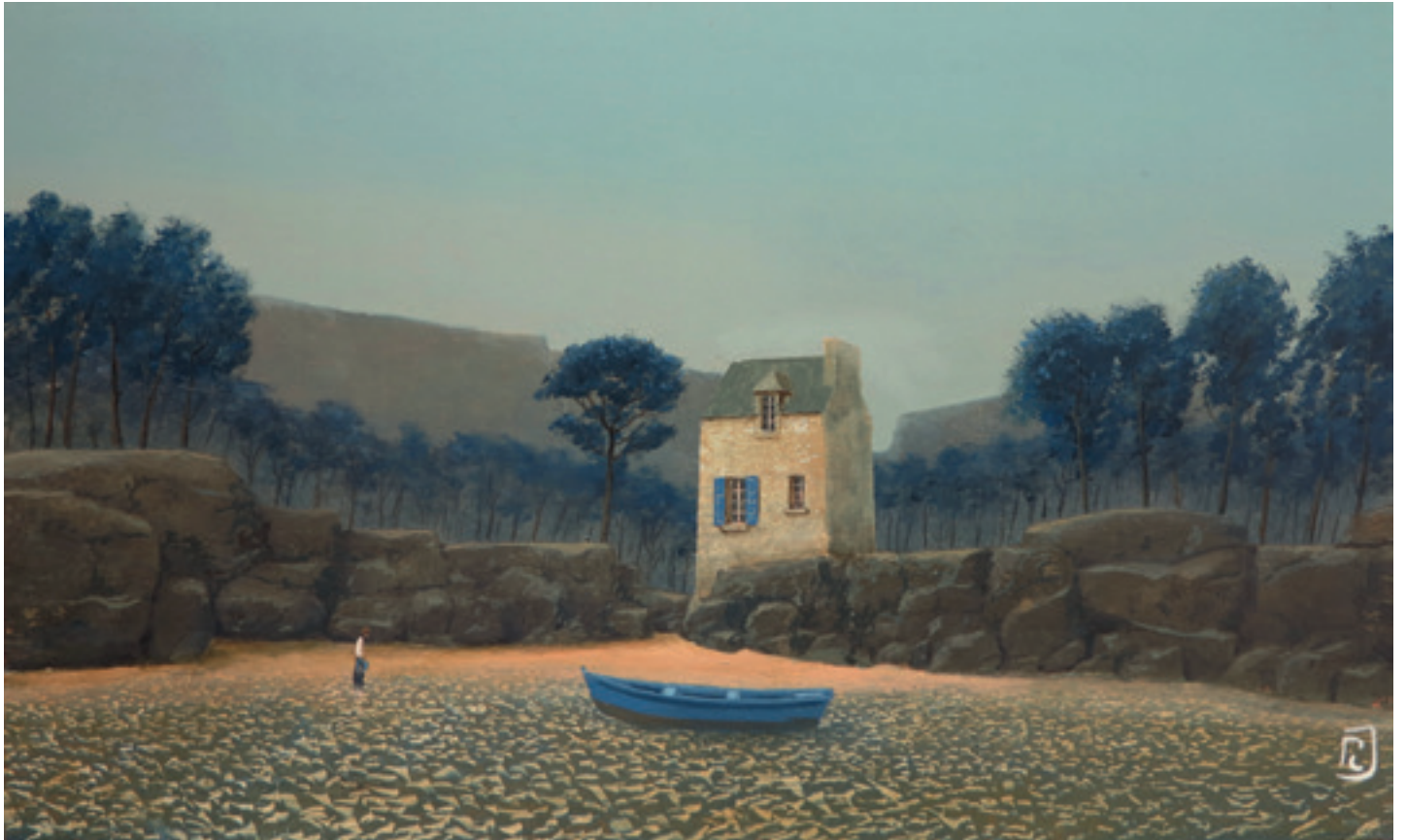
La crique bleue - 30 x 50 cm