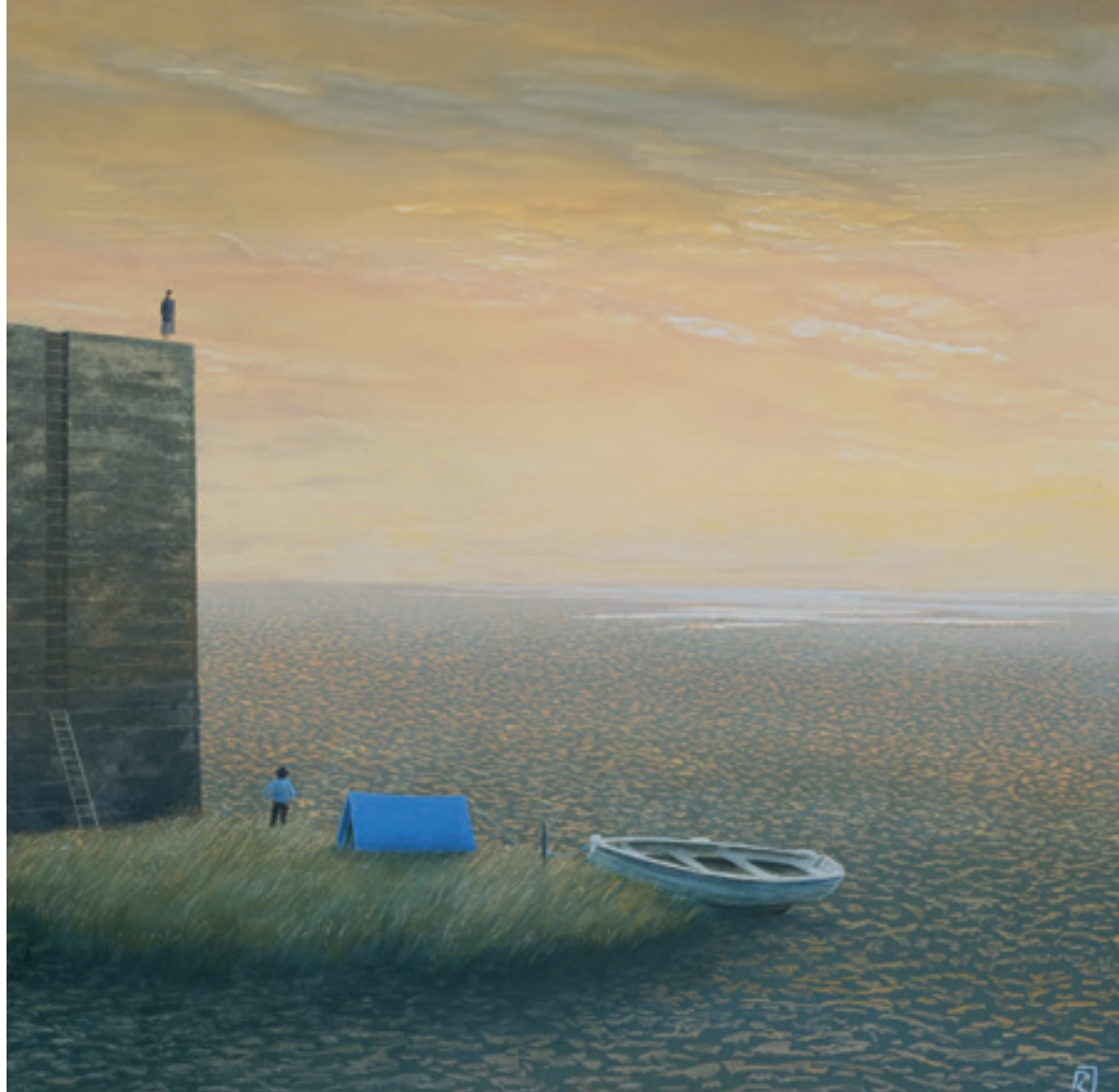
La tente ou l'attente - 80 x 80 cm