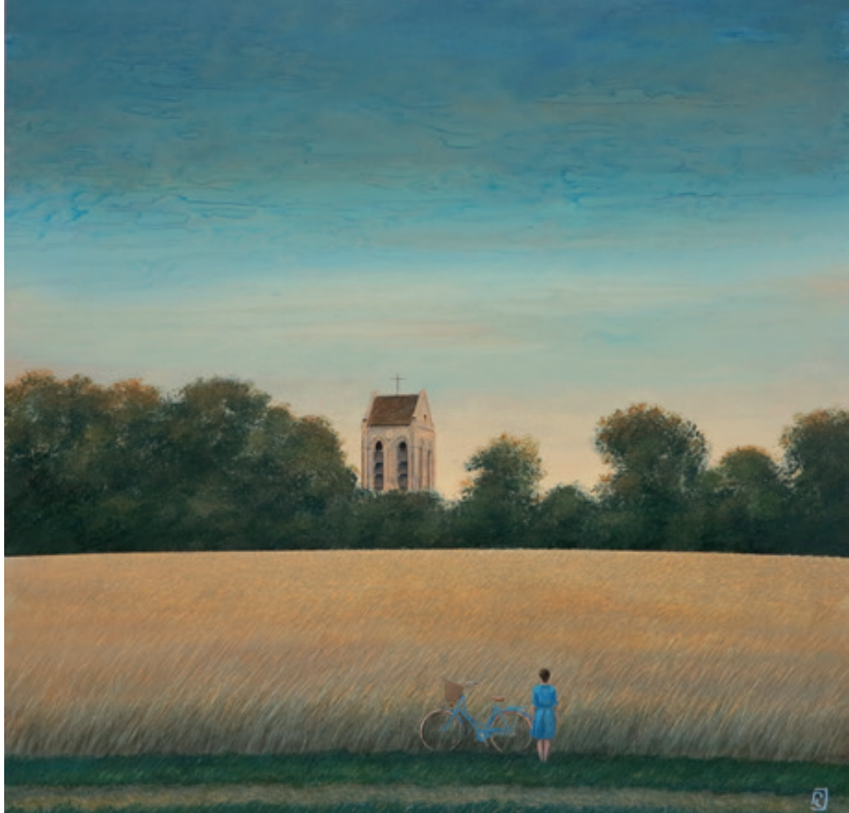
Auvers - 90 x 90 cm