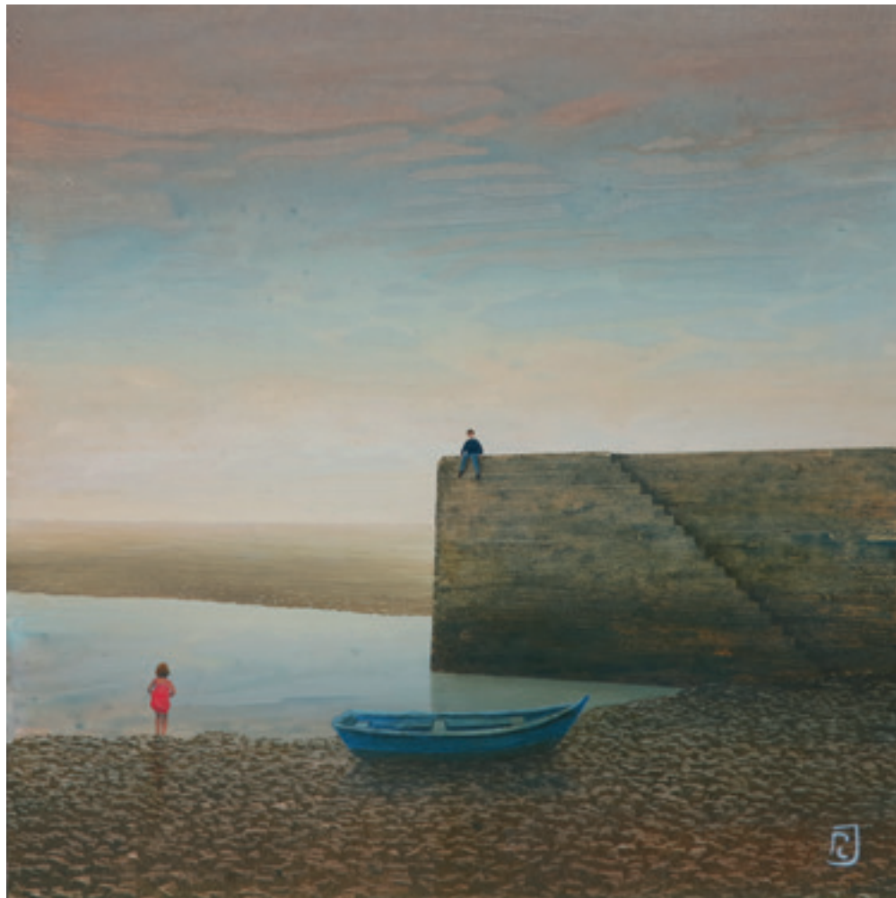
Au bout du quai - 40 x 40 cm