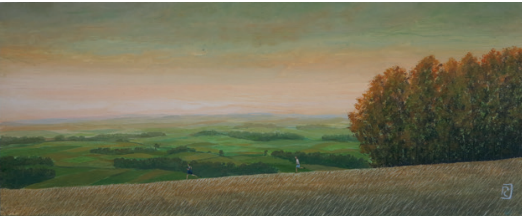
Une échappée - 32 x 80 cm