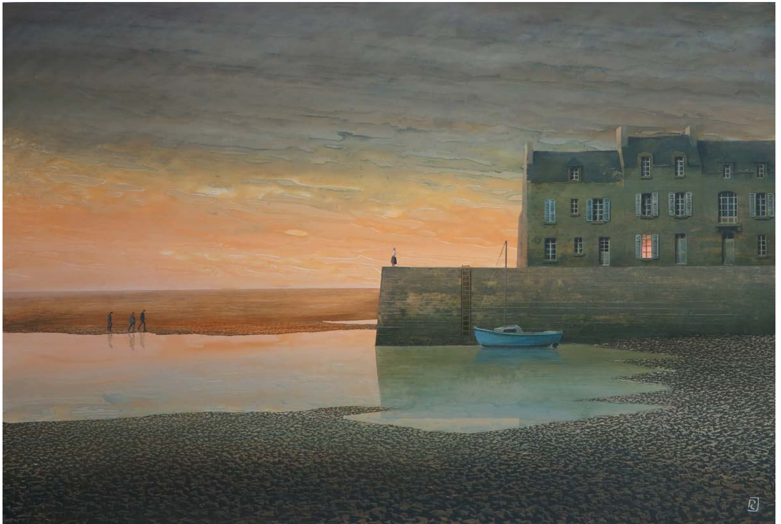
Les trois frères - 84 x 122cm