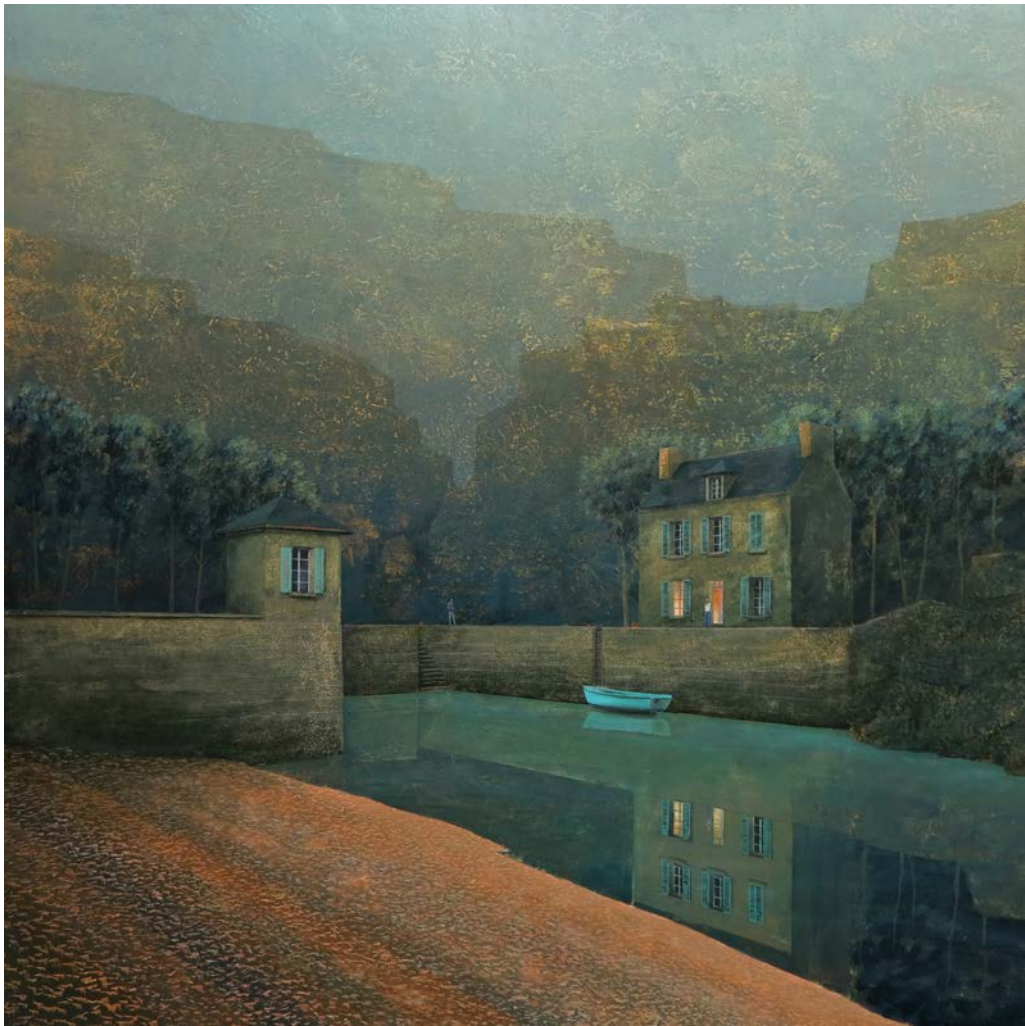
19h30 - 105 x 105 cm