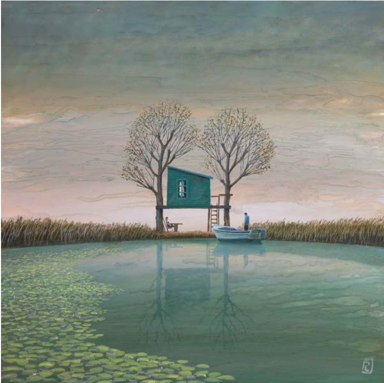
La cabane - 60 x 60 cm