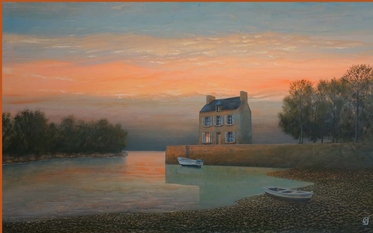
Fond d'estuaire - 72 x 115 cm