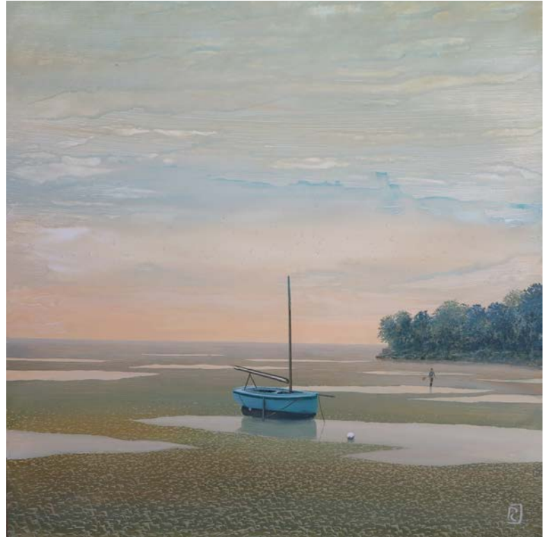
L'échouage - 60 x 60 cm