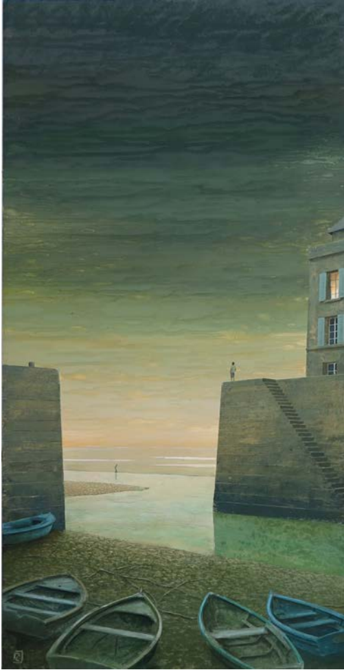
Le petit port - 120 x 60 cm